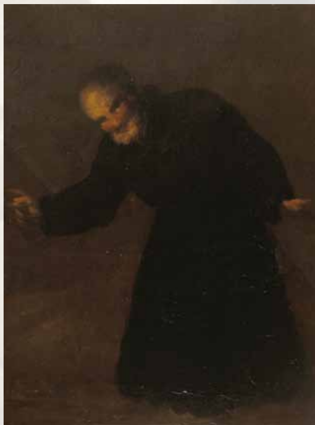
“San Cayetano” 37 x 30 cm Pintura mural pasada a lienzo Hacia 1772