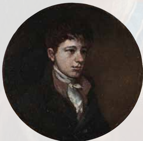
“Retrato de Francisco Javier Goya”

Algunos autores creen que es Leocadia Zorrilla de Weiss, ama de llaves y compañera de Goya en sus últimos años. También se le pone en relación con la figura de una mujer que aparece en las pinturas de la Quinta del Sordo.