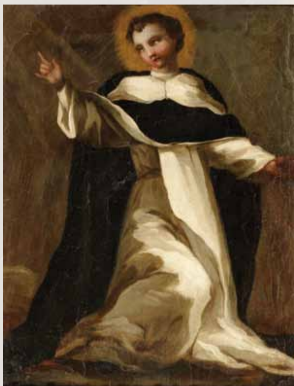
“San Vicente Ferrer” 37 x 30 cm Pintura mural pasada a lienzo Hacia 1772

Junto a esta última obra, se exponen otras dos más de tamaño reducido que también formaban parte de la decoración del oratorio de los condes de Sobradriel.