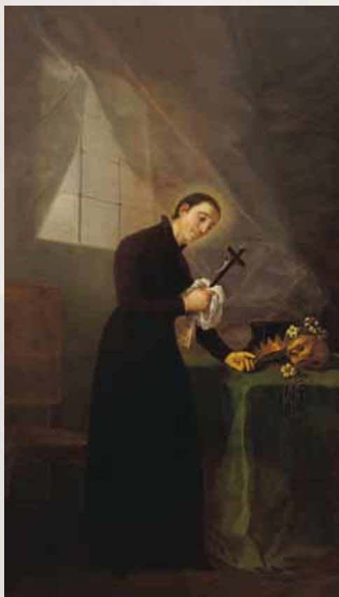
“San Luis Gonzaga meditando en su estudio ante un crucifijo” 261 x 160 cm Óleo sobre lienzo Hacia 1798

Hacia 1798, Goya debió de realizar esta pintura para uno de los altares de la iglesia de la Salesas Nuevas de Madrid. En 1991 el Gobierno de Aragón adquirió la obra a un coleccionista privado.