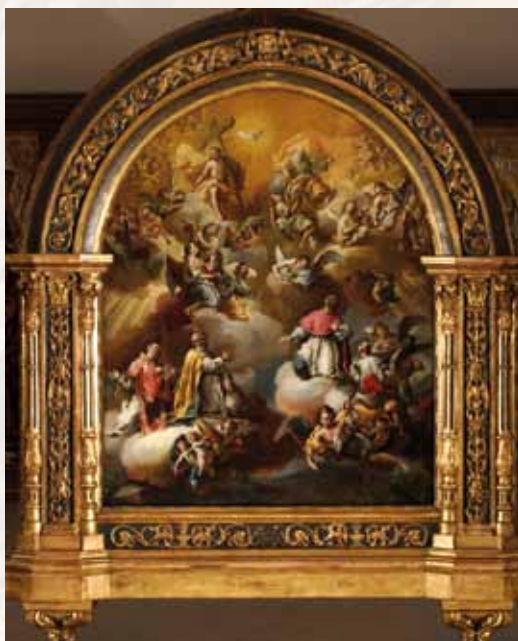
“San Valero, San Vicente Mártir, San Pedro Arbués y Santo Dominguito de Val, en la Gloria”

Junto con Goya y los hermanos Bayeu fue el pintor más destacado de la pintura aragonesa del siglo XVIII. Gracias al patronazgo de los Pignatelli, condes de Fuentes, viajó a Nápoles para que completara su formación artística. A su regreso a Zaragoza se convirtió en el artista más solicitado de la ciudad, donde mantuvo un activo taller y fue profesor de la Academia de Dibujo.