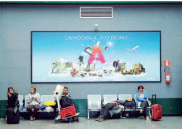
Aeroporto de Bérghamo (Italia).