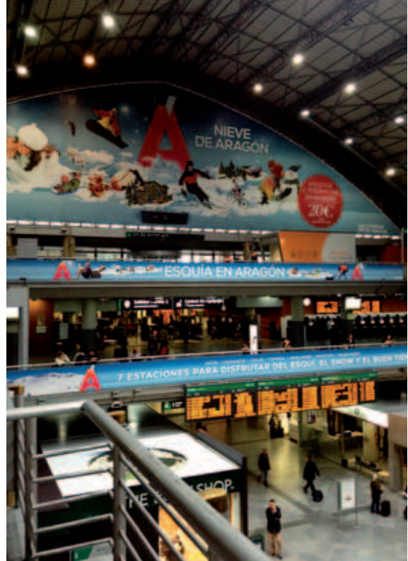
Estación de Atocha, Madrid.

La promoción turística es el conjunto de actividades realizadas por los técnicos de turismo encargados de la promoción, que enseñan y venden el “Destino Aragón” suscitando interés entre aquellas personas que desconocen la