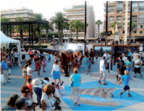
Dinosaurio en Salou.

La promoción es una de las actividades más gratas y atractivas en cuanto a su desempeño, pero más dinámicas y complicadas en cuanto a su ejecución, ya que requiere de una fuerte pro actividad debido a los constantes cambios que demandan los clientes de este sector. Aragón compite en un mercado con miles de destinos, con la intención de captar clientes siempre muy cambiantes en sus gustos, pero que se mantienen constantes en cuanto a su volumen. Por ello es necesario, dentro de las estrategias de promoción, reinventarse continuamente, innovar en las actuaciones con ciertas dosis de originalidad, actuar con celeridad en el desarrollo de actividades para estar con las últimas tendencias del sector turístico y solucionar los distintos problemas que surgen de cada promoción derivados de la multitud de intereses en juego y la cantidad de actores (empresas privadas, instituciones, asociaciones) implicados en la materia.