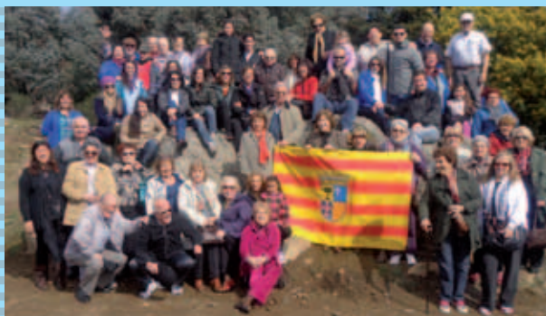
Buenos Aires y Mar del Plata.