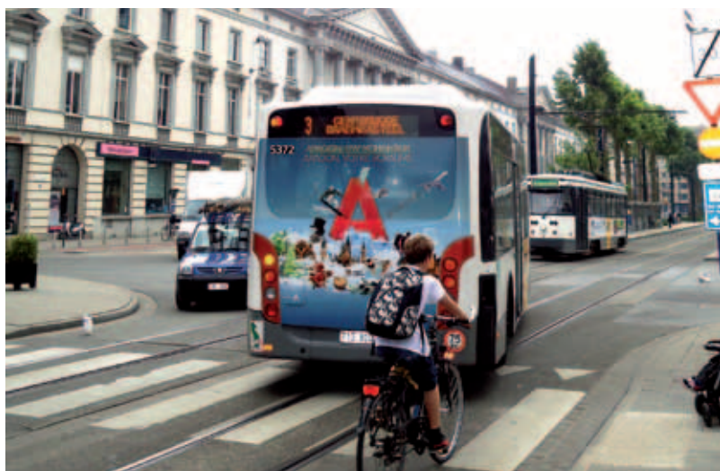
Autobús en Gante (Bélgica).

Por último, la Gastronomía se ha convertido en uno de los pilares de la promoción turística. Como se señalaba anteriormente, la gastronomía aragonesa tiene un gran potencial que ofrecer, existiendo una amplia variedad de restaurantes (de montaña, de diseño, urbanitas, tradicionales, de nueva cocina...) con una calidad-precio muy asequibles