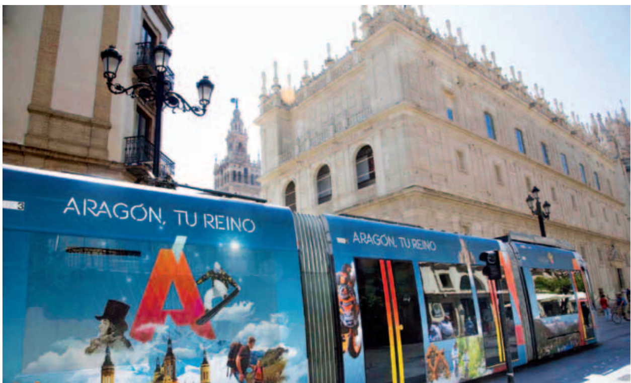
Tranvía de Sevilla.

El turismo es uno de los pilares claves de Aragón. Éste supone en torno a un 10% del PIB aragonés, siendo un campo que en estos momentos sigue creando empleo, generando riqueza y dinamizando un sector del que multitud de empresas (hoteles, restaurantes, museos, empresas de turismo activo, sector de la nieve, balnearios, etc.) dependen del mismo. Por estos motivos el cuidado del turismo es una cuestión a tener muy en cuenta, ya que cualquier inversión en el mismo es una apuesta importante para que más turistas vengan a Aragón y por tanto para que el mismo pueda seguir tirando de la economía como en estos momentos ya lo está haciendo.