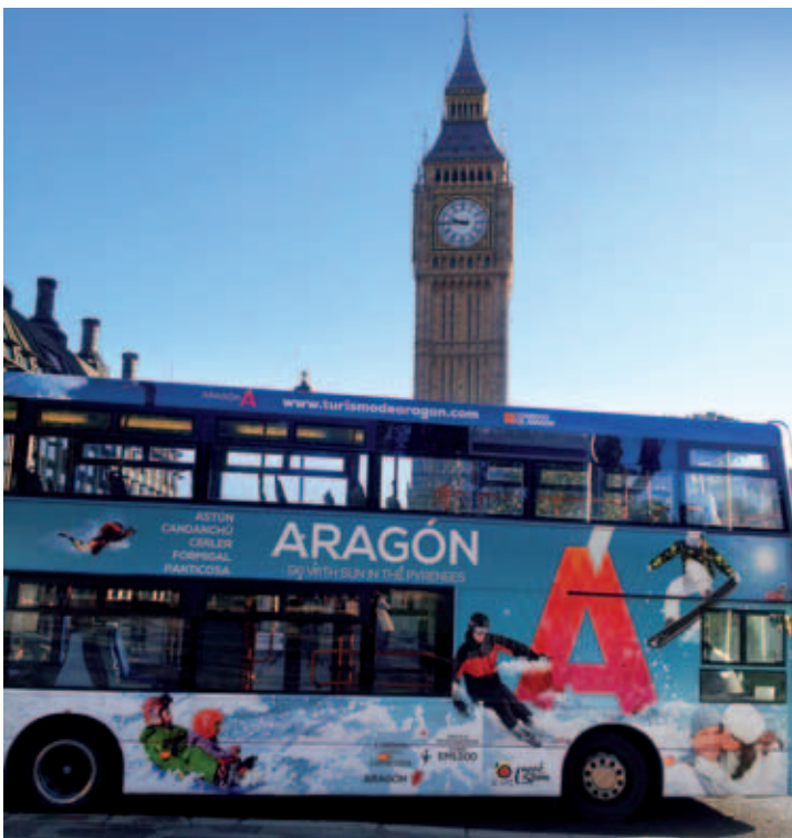
Big Ben, Londres.

El servicio de promoción turística es el principal “comercial” de nuestra Comunidad Autónoma. Somos aquellos que tenemos la tarea de promover y vender mejor que nadie los encantos aragoneses de manera que este sector tan importante en la economía pueda seguir manteniéndose