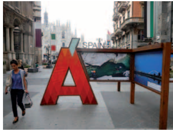
Duomo, Milán (Italia).

dose y desarrollándose, con la vista siempre puesta en incrementar el número de turistas y promover la calidad del turismo. Es por tanto un trabajo en positivo, contando historias bonitas, experiencias agradables, y mostrando con orgullo lo atractivo de nuestra tierra, con la responsabilidad última de presentar un trabajo perfectamente ejecutado ya que la imagen, más que nunca, vale más que mil palabras, y en el que cada euro gastado debe considerarse como una inversión que pueda retornarse multiplicada en el largo plazo. Con un objetivo correcto y una precisión adecuada en la ejecución, una buena inversión en promoción, puede dar resultados muy satisfactorios.