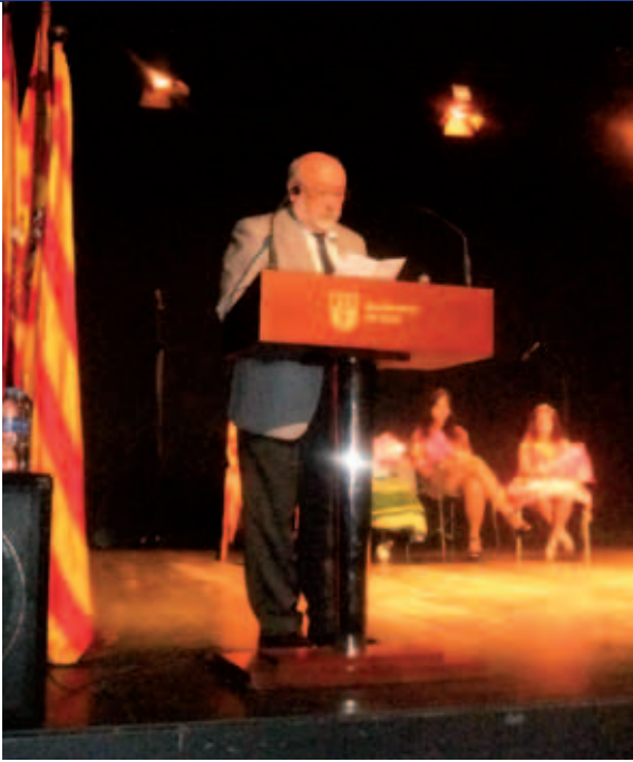
Por: Eloy Fernández Clemente