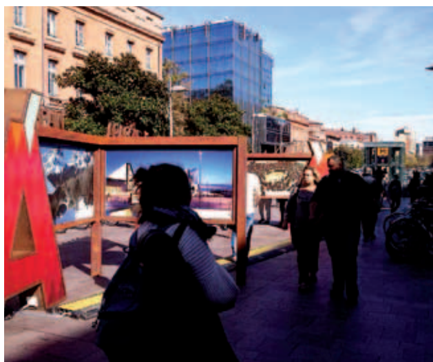
Exposición en Toulouse (Francia).

Del mismo modo, la mayoría de la población utiliza hoy en día algún tipo de móvil "smartphone", por lo que la estrategia en estos dispositivos debe ser afrontada igualmente. El cliente fija un mercado y debemos darle opciones para que pueda elegir un destino o desenvolverse a través de él. En este aspecto se han desarrollado dos aplicaciones, una Guía de Aragón representativa de toda la oferta turística aragonesa, y otra más especializada de la Nieve de Aragón que, con sus indicaciones de ¿qué ver?, ¿dónde comer? y ¿dónde dormir?, cumplen perfectamente dichas funciones.