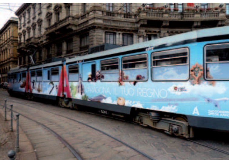
Tranvía de Milán (Italia).

los públicos. Una vez que conoces Aragón, su recuerdo será inolvidable.