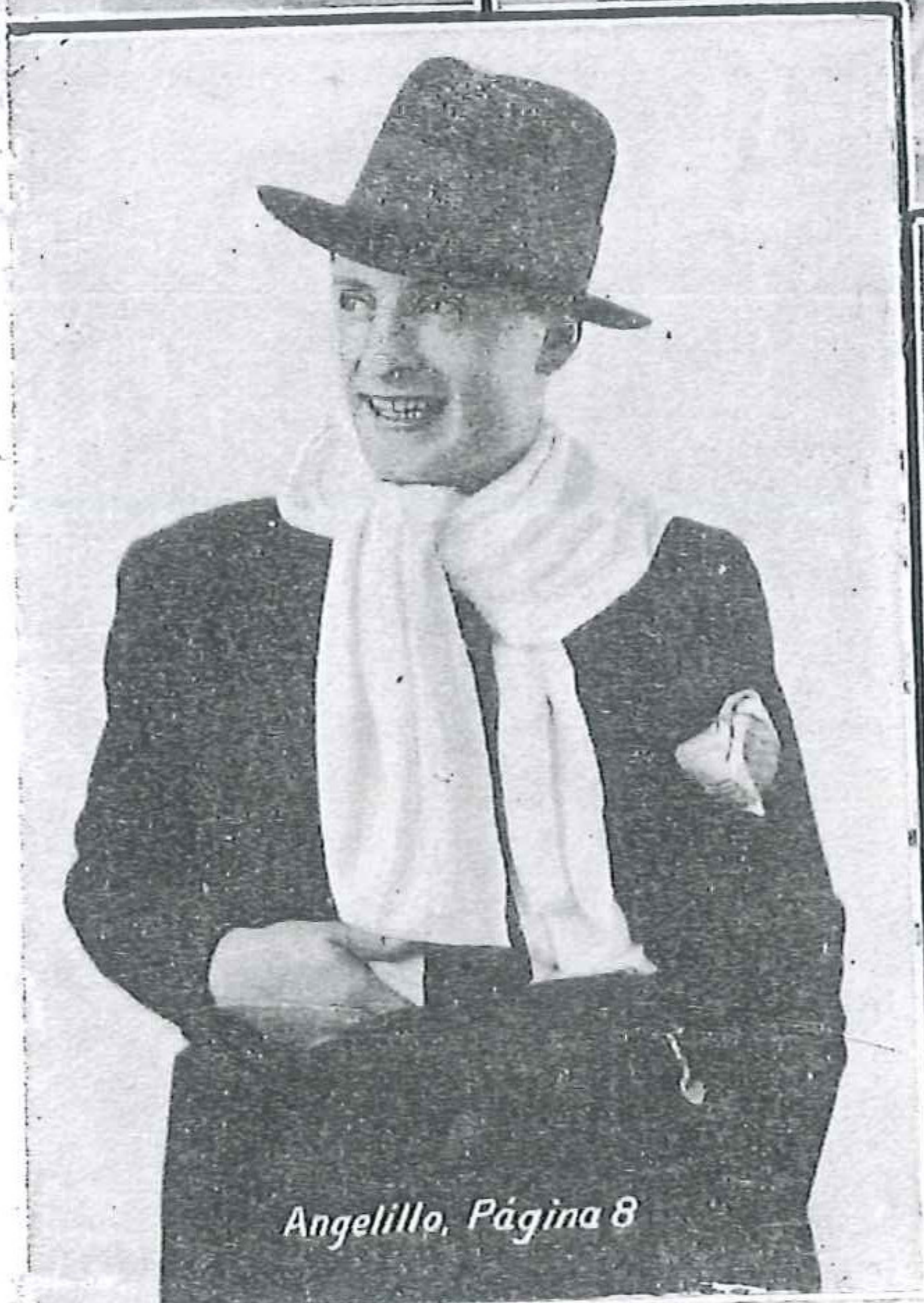
Angelillo, Página 8