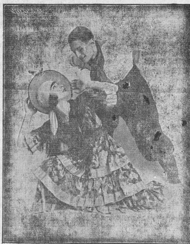
Afamada pareja de baile que se presentará en el Martín el sábado y domingo próximos

con sus hazñas se escribieran bellas páginas de oro en la historia de nuestra Patria: y, como contraste, aquel mismo hombre que momentos antes ostentaba sobre su pecho innumerables cruces y condecoraciones ganadas en el campo de batalla, en lucha abierta y feroz con el plomo y la metralla, sabe así mismo vestirse con el diplomático frac, y entender de los complicados asuntos de Estado.