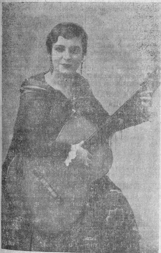
Estrella de la canción que actuará el sábado y domingo en el Teatro Marín