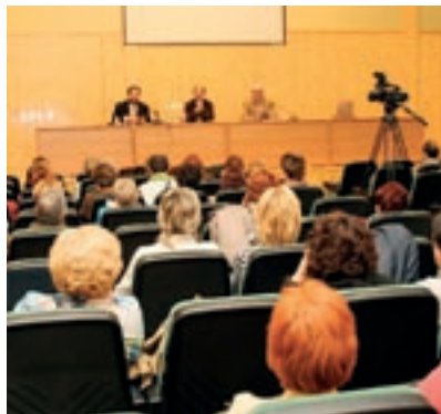
Aspecto del Auditorio