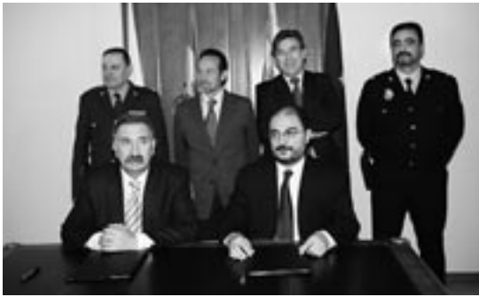
Autoridades presentes en la firma del convenio