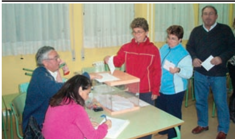
Momento de la votación en el barrio de La Llana