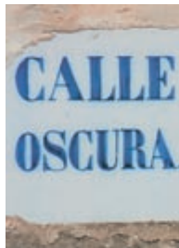
Las ánimas deambulaban por esta calle de Urriés