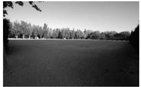
Ferial del Parque Central donde se construirá el nuevo colegio Cervantes

Desde hace tiempo, la Comunidad Escolar del C.P. Cervantes viene solicitando la construcción de un nuevo colegio. Las razones que se esgrimen son evidentes: los dos edificios que ahora ocupa tiene una antigüedad de más de 60 años, estando al final de su vida útil; el centro está integrado por dos edificios diferenciados e independientes (el de la calle Libertad para Educación Infantil y el de la Plaza de la Diputación para