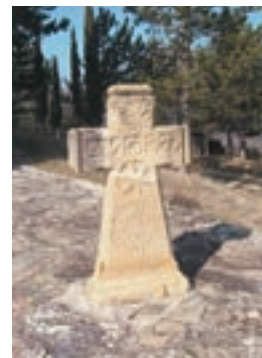
Cruz con símbolos en la ermita de la Virgen de la Sierra