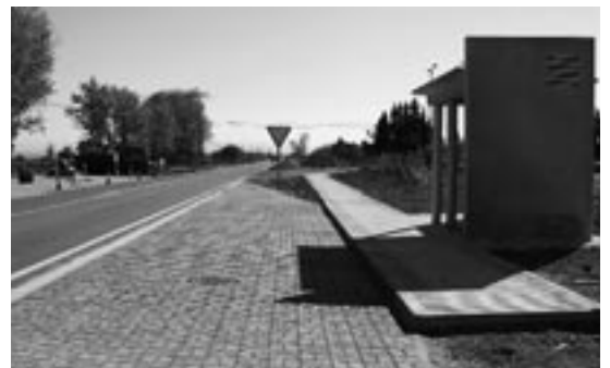
Parada de autobús en la entrada de Bardenas

De este modo, Bardenas recupera un servicio que había desaparecido hace dos años. «Con la parada se dota de nuevo a Bardenas de un servicio que era muy reclamado por los viajeros que hacen las ruta por los pueblos de colonización. Ahora, la llegada del autobús, la espera y