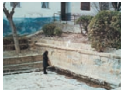
En Bañera hay un Caño del Ángel y otro del Demonio