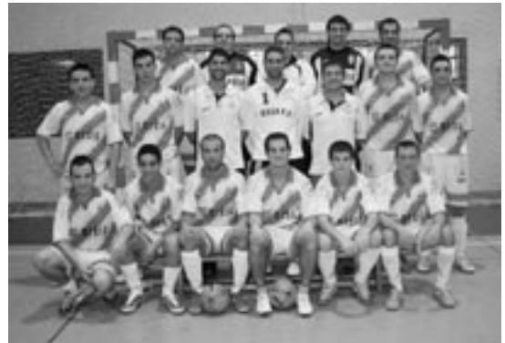
Plantilla del Exea Fútbol Sala

ha conseguido varios títulos importantes: Campeón 1º señor, Campeón Autonómica. Campeón por 3 veces consecutivas de la Maratón Villa de Ejea., Campeón de la Maratón Villa de Gallur, y Campeón de la Maratón Villa de Cortes.