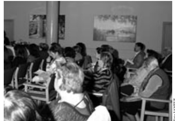
La jornada reunió a numeroso público

Se inició la mesa de trabajo con la ponencia de una técnica propia de Fademur, exponiendo uno de los proyectos que ve en esta ley un yacimiento de empleo para la mujer rural desempleada o en riesgo de exclusión social. Se trata de un proyecto de «cooperativas rurales de servicios de proximidad», llevado a cabo con éxito en otras comarcas de nuestra comunidad autónoma, además de en el resto del territorio español, que ha conseguido emplear a bastantes