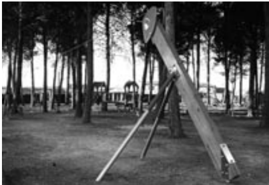
Remozado Parque de Pinsoro