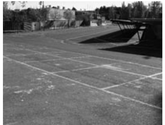
Zona dónde se ubicará el mercadillo

La voluntad del Ayuntamiento de Ejea ha conjugado el interés general de todos los vecinos y la intención de no perjudicar ni a vendedores ambulantes ni a compradores. De hecho, el mercadillo se traslada escasamente a 150 metros de la Avenida Fernando el Católico, en un espacio