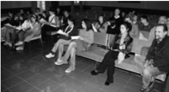
Recepción oficial a los esperantistas