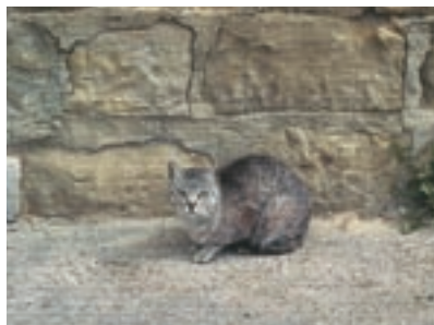
A veces las brujas se transformaban en gatos