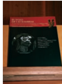
Portada del libro