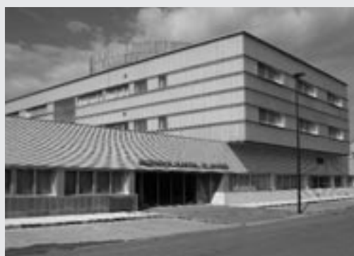
Residencia Municipal de Mayores gestionada por la Fundación Elvira Otal

dos Proyecto de Rehabilitación Funcional y Cognitiva, el primero y Proyecto de Intervención Social, el segundo, son dos programas muy ambiciosos, cuyo objetivo general es la atención integral de los usuarios de este Centro, incidiendo especialmente en la rehabilitación, la terapia ocupacional y el trabajo social como sistemas de garantía en la calidad de vida y favorecedores del mantenimiento máximo de los niveles de autonomía personal.