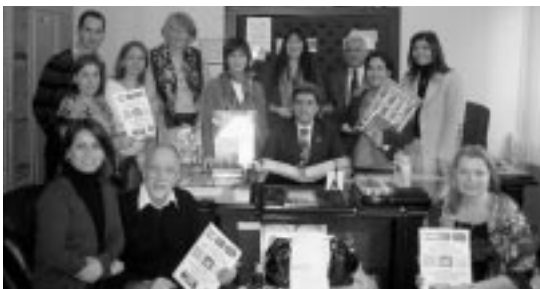
Profesores de Ejea, Turquía y Reino Unido en Adana.

está compuesta por productos muy variados, desde sonajeros, chupetes, productos de higiene, ropa, calzado y hasta una libreta de ahorros con una imposición de 150 euros, aportada por la entidad Cajalón.