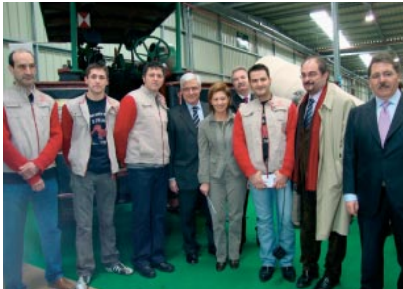
La Ministra Espinosa junto a Gonzalo Arguilé, Javier Fernández, Javier Lambán, Manuel Teruel y los hermanos Sergio y Óscar Miguel con sus colaboradores.

El visitante de Aquagraria conocerá de primera mano y de una forma didáctica la problemática actual en torno al agua y su relación histórica con Ejea de los Caballeros, su agricultura y su patrimonio agrario. Todo ello en un edificio moderno de más de 2.000 metros cuadrados de superficie.