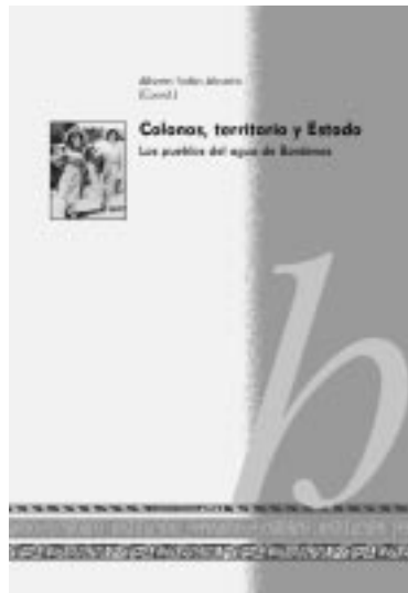
Portada del libro coordinado por Alberto Sabio.