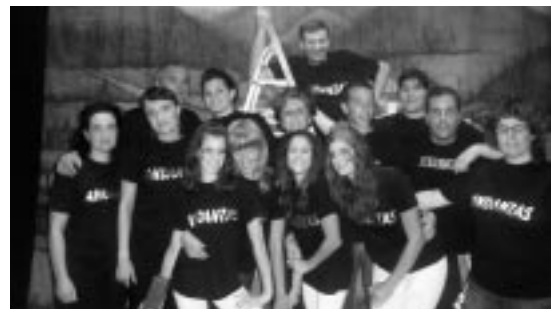
Miembros de Andanzas.

En esta nueva producción, ambientada en los años 50, se ha pretendido reflejar una realidad que, día a día, se vive en la sociedad actual: la emigración. Con ello se quiso homenajear a todas esas personas que un día abandonaron sus hogares. Todo ello con el simbolismo añadido de los cuatro elementos clásicos griegos (tierra, fuego, aire y agua). A través de las vivencias de distintos personajes, Andanzas muestra su particular visión