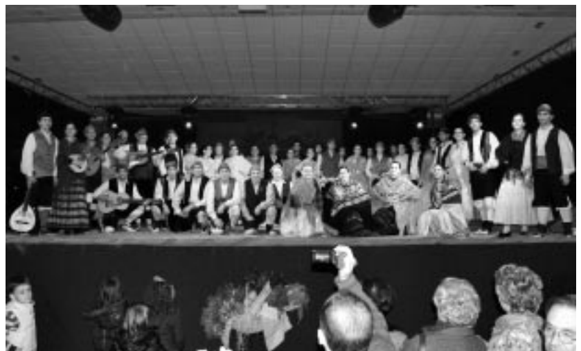
Grupo de Jotas «Cinco Villas» de Bardenas.