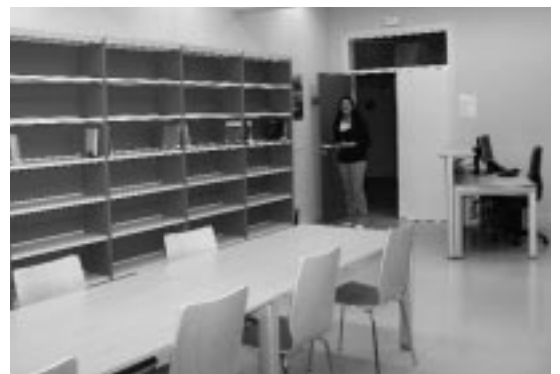
Una de las dependencias de uso común de la UNED de Ejea.

Por su parte, el Servicio de Atención al Estudiante, ofrece a los alumnos un servicio de apoyo para cualquier tema relacionado con su actividad académica, servicio de apoyo para los profesores-tutores y librería, donde se pueden comprar cualquier libro editado por la UNED.