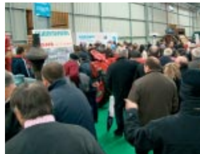
Multitudinaria presencia de público.