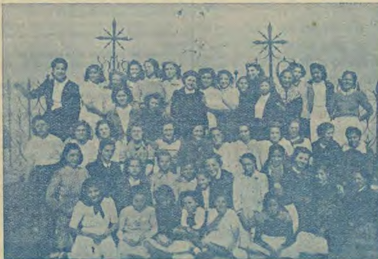
La Juventud Femenina en una visita al Monasterio del Pueyo

Quizá cuando vean la luz estas [p]obres líneas los destinos de la Juventud femenina barbastrense de A. C. estén en mejores manos que las mías. Pido a Dios que esta obra, tan mimada de la Iglesia, y en la que tanto cariño, ya que no otra cosa puse, se acreciente en nuestra