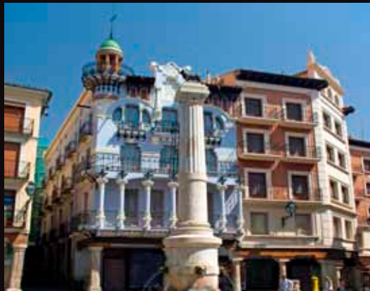
Edificio modernista en Teruel.

Pero no todo es medieval en Teruel. Encontraremos aquí una interesante ruta de arquitectura modernista, ejemplificada en varios edificios del casco antiguo. El broche de oro de nuestra visita, lo pondrá la hermosa Escalinata neomudéjar del Paseo del Óvalo.