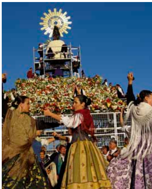
Ofrenda de flores en las Fiestas del Pilar de Zaragoza.