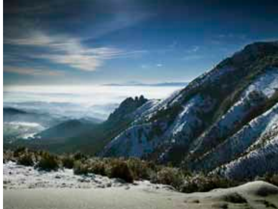
Moncayo. Vista desde la cumbre.