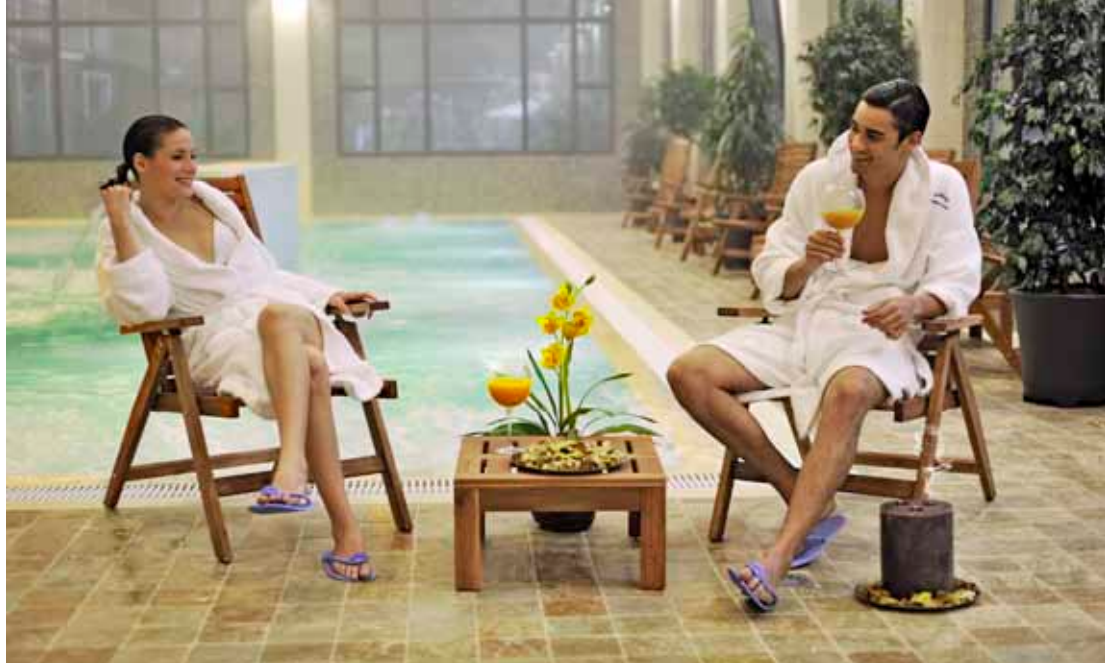
Balneario de Paracuellos de Jiloca.

ARAGÓN ES UNA TIERRA PRIVILEGIADA EN LO QUE A TERMALISMO SE REFIERE. ROMANOS Y MUSULMANES YA DESCUBRIERON EL PODER CURATIVO DE LAS AGUAS DE LAS TERMAS ARAGONESAS. HOY SE HAN CONVERTIDO EN MODERNOS BALNEARIOS CON MAGNÍFICAS INSTALACIONES DONDE PODRÁS ALOJARTE PARA DESCUBRIR UN MUNDO DE SENSACIONES A TRAVÉS DE LOS DIFERENTES TRATAMIENTOS DE SUS AGUAS MEDICINALES.