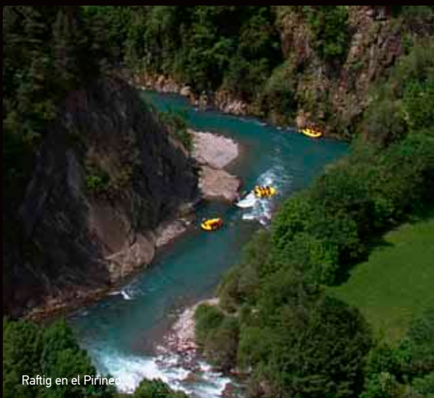
Rafting en el Pirineo