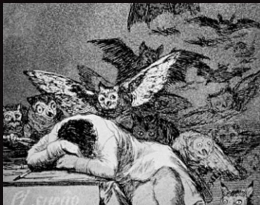
Grabado de Francisco de Goya. Serie Los Caprichos.