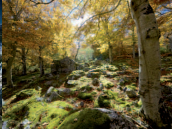
Hayedo en la falda del Moncayo.

mejores ejemplos de esta geografía abrupta son Les Roques del Masmut y el Parrisal de Beceite .