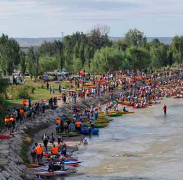
Descenso del Cinca en piragua.

El territorio aragonés te ofrece un amplio abanico de posibilidades para que disfrutes de la espeleología, un deporte que utiliza técnicas similares a las de la escalada, para explorar cuevas y grutas. En el Pirineo, son especialmente reseñables las abundantes cuevas del macizo de Cotiella , en las proximidades del Valle de Gistaín . Mencionaremos también el increíble recorrido de la cueva de Alba , en