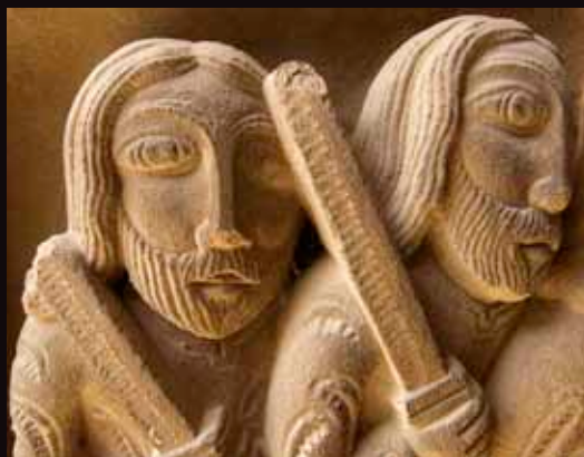
Capitel de la Catedral de Huesca.

www.patrimonioculturaldearagon.es/ruta-mudejar