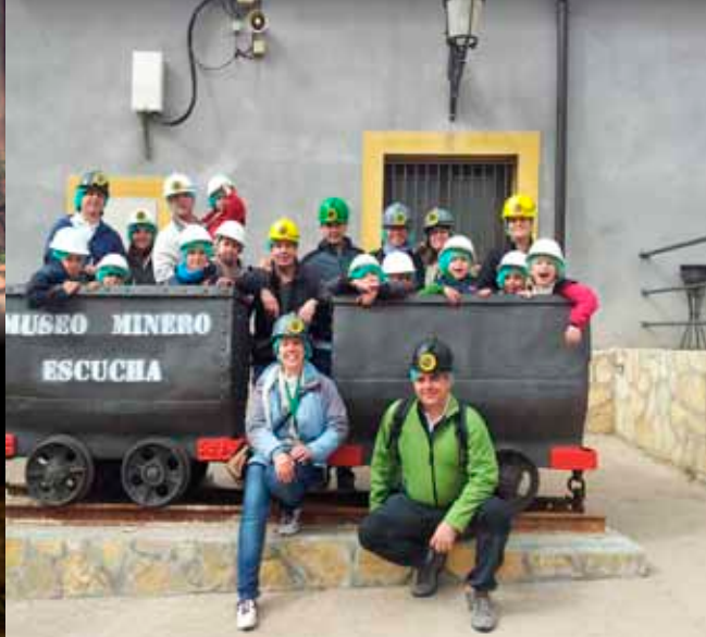
Museo Minero de Escucha.