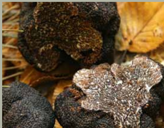
Trufa negra de Sarrión.

Una de las vertientes turísticas que mayor interés despierta hoy en día es el turismo enológico. Aragón cuenta con cuatro Denominaciones de Origen vitivinícolas: Somontano , Cariñena , Campo de Borja y Calatayud . Además el Consejo Regulador Cava, certifica vinos espumosos elaborados siguiendo el llamado "méthode champenoise" en 7 comunidades autó-