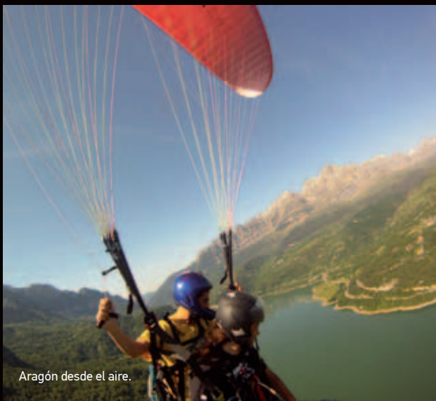
Aragón desde el aire.