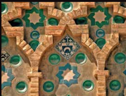
Mosaico típicamente mudéjar.