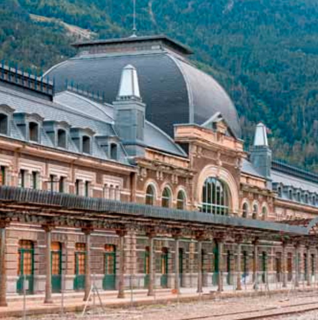
Estación internacional de ferrocarril de Canfranc.

Estos templos comparten protagonismo con centros defensivos o militares, como el Castillo de San Pedro en Jaca , más conocido como La Ciudadela . Sin olvidar el impresionante edificio modernista de la Estación Internacional de Ferrocarril de Canfranc .