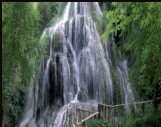
Monasterio de Piedra.

Recorre las angostas y sinuosas calles de su antigua judería, con todo su sabor medieval. La iglesia de San Juan el Real conserva unas pechinas pintadas por un joven Goya.