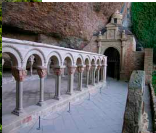
Monasterio de San Juan de la Peña.