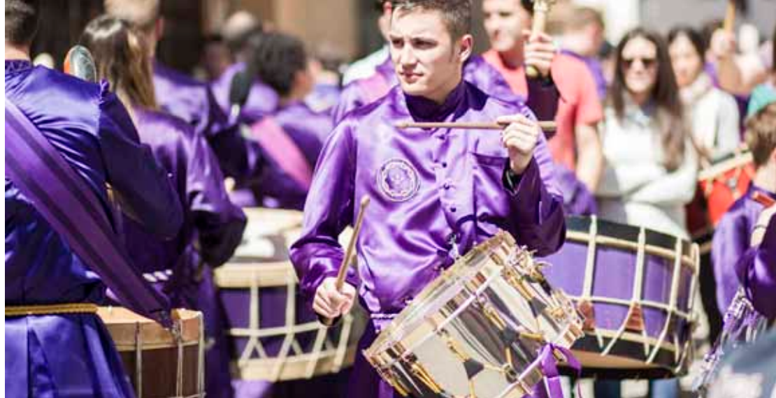
La Semana Santa en la provincia de Teruel, con su Ruta del Tambor y el Bombo, declarada de Interés Turístico Internacional.