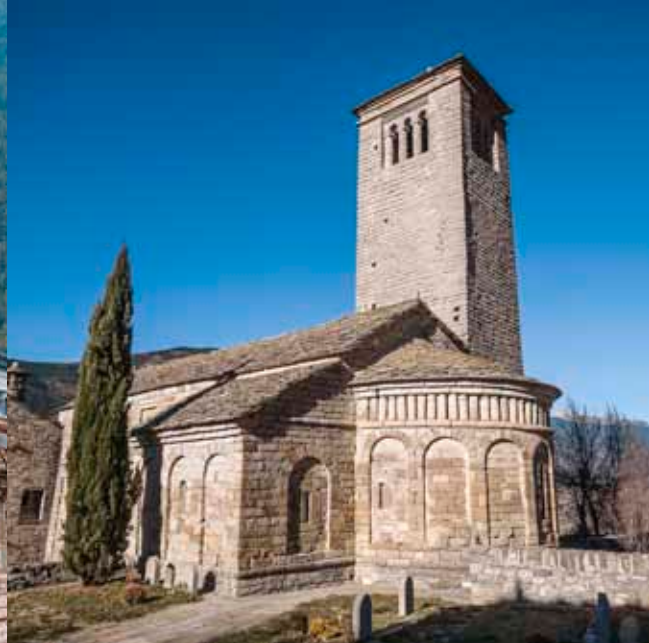
Iglesia de San Pedro de Lárrede. Ruta de Serrablo.

Los ibones de las cumbres, los bosques de pinos, hayas y robles, los valles, praderas y una red de bellos