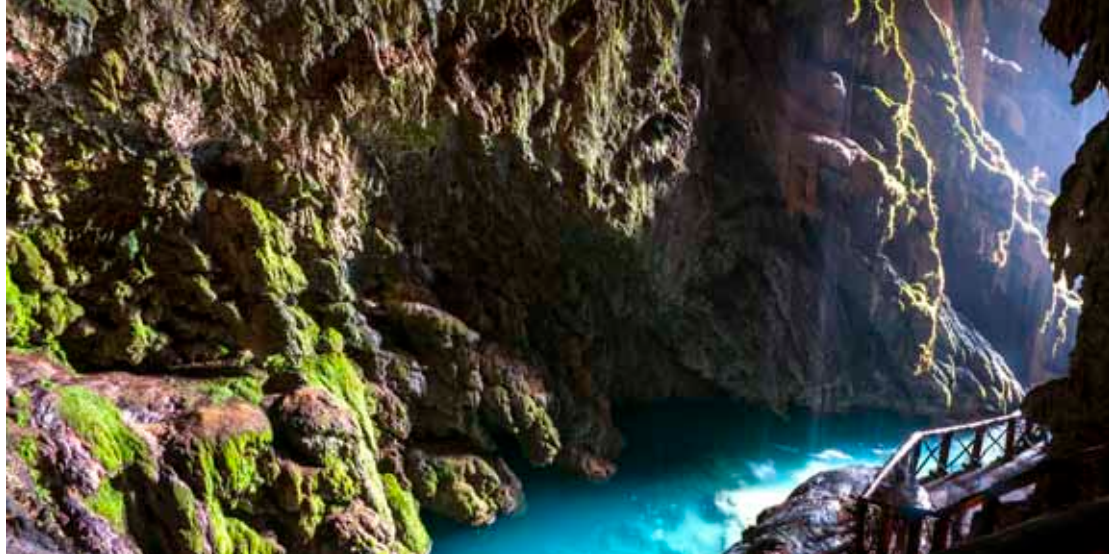
Gruta Iris en el Monasterio de Piedra.