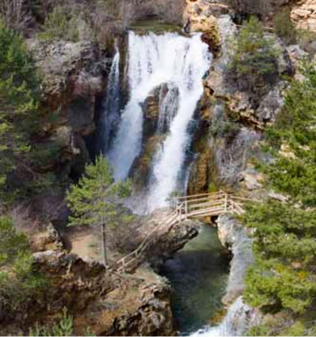
Cascada de Calomarde en la Sierra de Albarracín