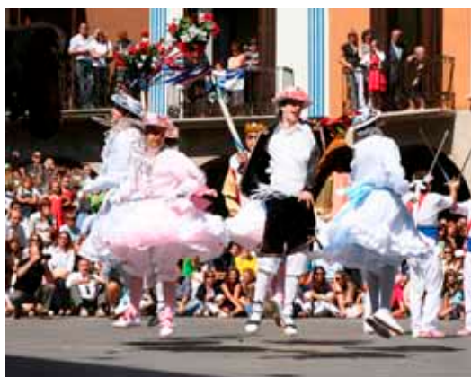
Baile de las espadas. Graus.