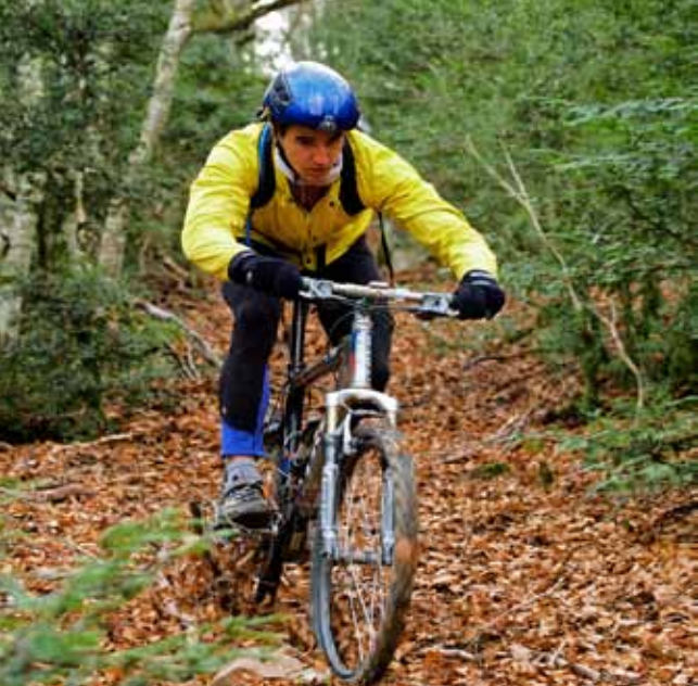
Aragón cuenta con una extensa red de rutas cicloturísticas.

Aparte de esta amplia red de senderos, existen en Aragón otras interesantes rutas como las antiguas vías de tren habilitadas para el uso turístico aptas para ser recorridas a pie, en bicicleta o a caballo: son las Vías Verdes .