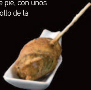
1/ Quesos de Aragón, variedad y calidad. 2/ Las tradicionales migas con huevo y uvas. 3/ Tapas: siempre innovando. 4/ El jamón de Teruel.