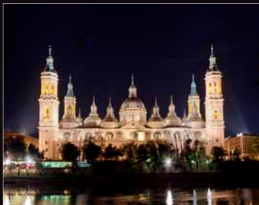
La Basílica del Pilar a orillas del Ebro.

Otro de los tesoros de Zaragoza es el espléndido palacio de La Aljafería, en el que conviven el palacio islámico del siglo XI, el mudéjar del XIV y el gótico-renacentista, de finales del siglo XV. Una auténtica joya.