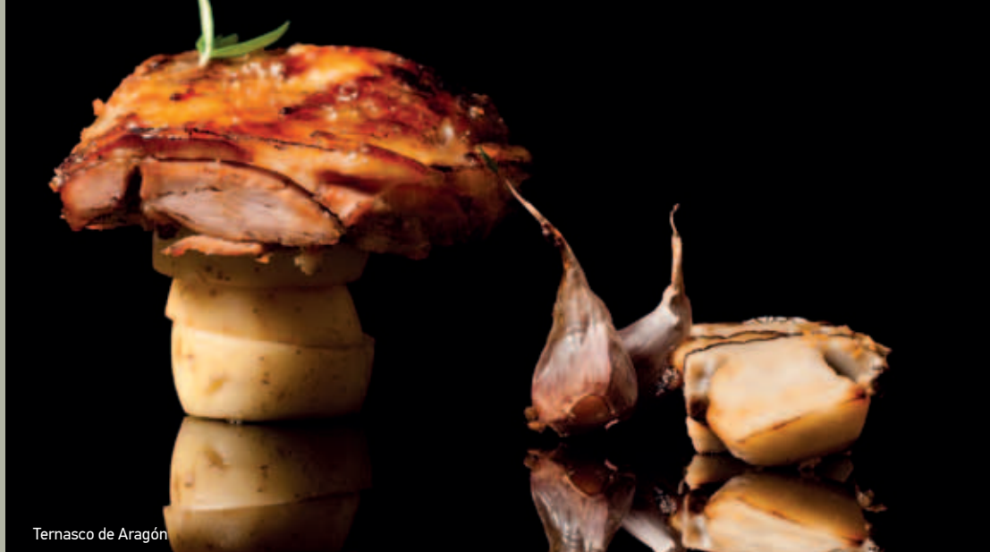
Ternasco de Aragón

EN ARAGÓN DESCUBRIRÁS LA SABIDURÍA DE LOS PLATOS TRADICIONALES PERO TAMBIÉN LA IMAGINACIÓN DE LOS NUEVOS COCINEROS. Y EL MEJOR MODO DE CONOCERLO ES PROBARLOS PORQUE CONTIENEN LO MEJOR DE NOSOTROS.