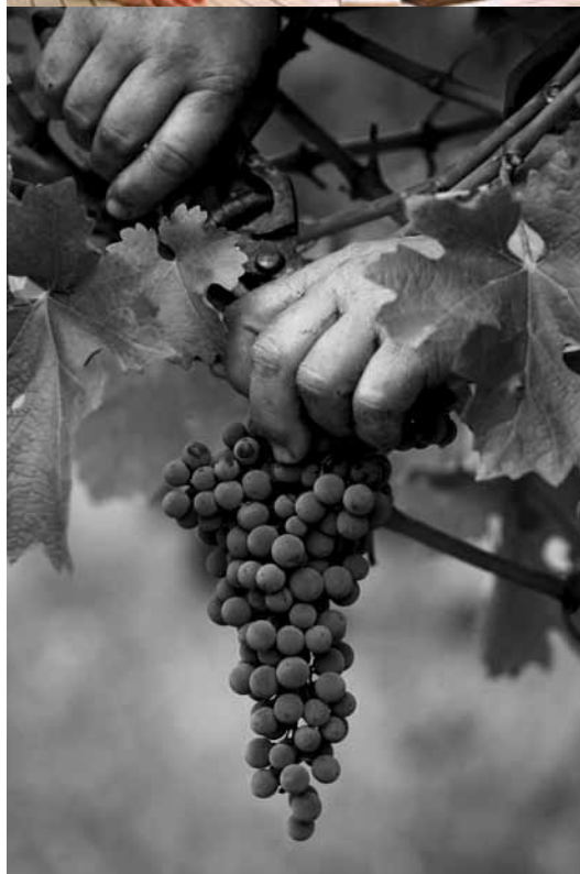
El enoturismo nos acerca a las bodegas y variedades del territorio.

Por otra parte la figura de Vinos de la Tierra ha sido creada para distinguir, en unos territorios concretos, una serie de caldos que guardan gratas sorpresas para los consumidores. Reconocida a nivel europeo como una Indicación Geográfica Protegida (IGP), esta figura identifica a los vinos de mesa que cumplen un conjunto de exigencias.