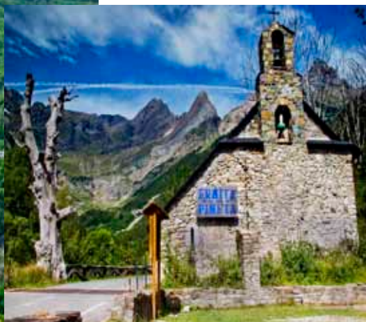
Valle de Pineta.