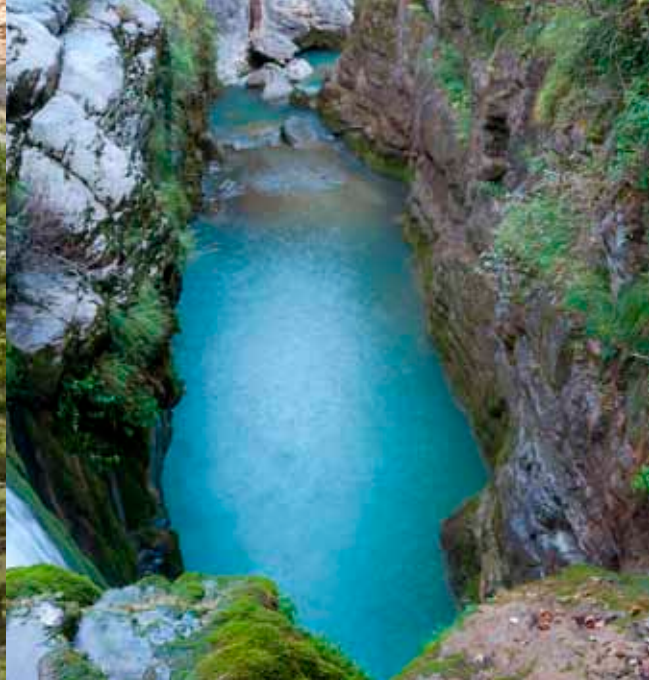
Cañones en Guara