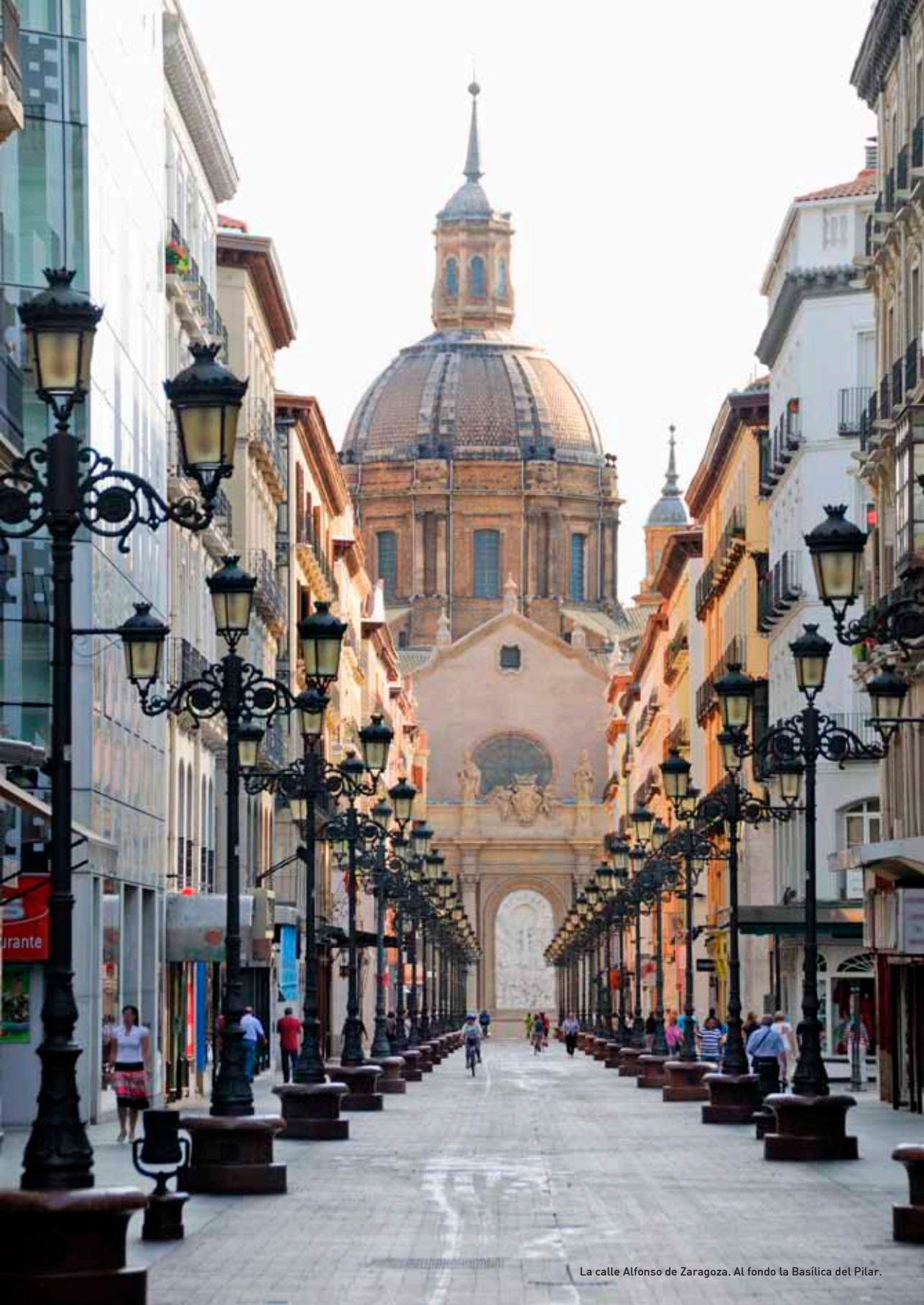
La calle Alfonso de Zaragoza. Al fondo la Basílica del Pilar.