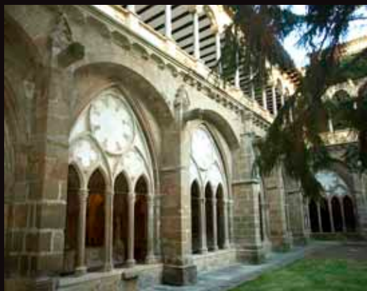
Monasterio de Veruela.

Zaragoza es una acreditada ciudad de congresos, renovada y embellecida tras la Exposición Internacional del 2008. El Pabellón Puente, la Torre del Agua y el Palacio de Congresos de Aragón, componen el flamante legado arquitectónico que la muestra dejó a la ciudad.