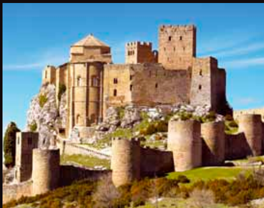
Castillo de Loarre.

Es el castillo románico mejor conservado de Europa, por lo que su visita supone un verdadero viaje a la Edad Media, habiendo sido también escenario de varias películas. El conjunto, de unos 10.000 m 2 , está rodeado en su zona sur por la muralla del siglo XIII, quedando protegido el resto por la misma roca en la que se asienta la fortaleza. Un paseo por su interior a 1.070 m. de altura, es un atractivo recorrido por pasadizos, torreones y mazmorras hasta llegar al Mirador de la Reina, desde el que se contempla una fantástica panorámica de la Hoya de Huesca. Una experiencia difícil de olvidar.