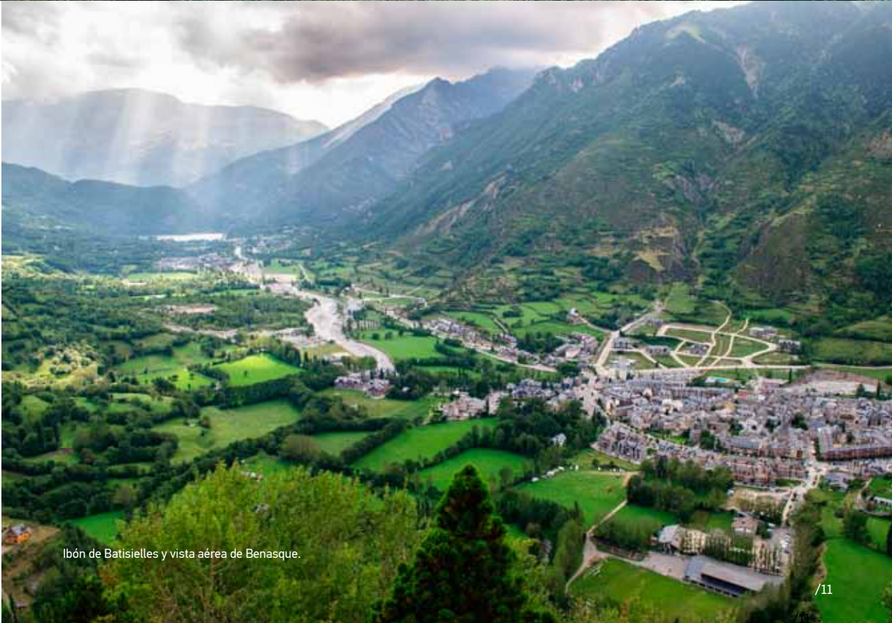
Ibón de Batisielles y vista aérea de Benasque.