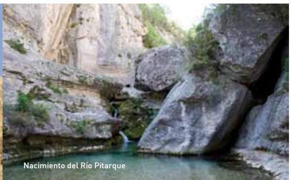
Nacimiento del Río Pitarque