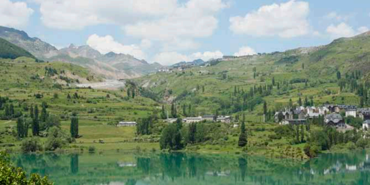
Vista del Valle de Tena desde Lanuza.

indescribible sensación de paz y sosiego. Recorrer sus rutas bien marcadas en tan espectacular entorno natural es una experiencia que permanecerá en tu recuerdo.