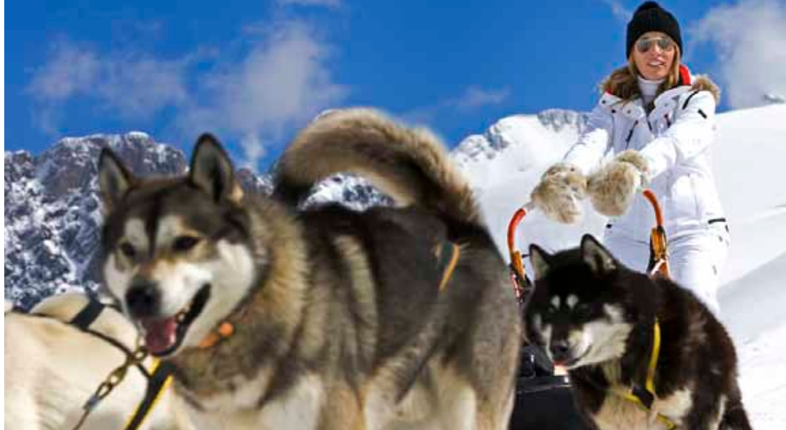
Trineos tirados por perros. Otra manera de disfrutar de la nieve.

SU ALTITUD Y SU CLIMA HACEN DE ARAGÓN EL PARAÍSO PARA LOS AFICIONADOS A LOS DEPORTES DE INVIERNO, TANTO EN SUS MODERNAS INSTALACIONES COMO AL AIRE LIBRE.