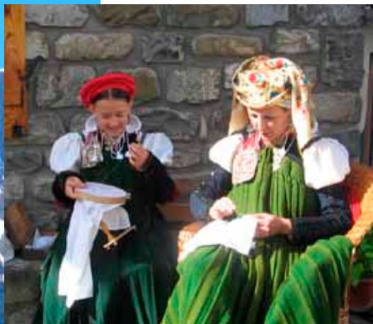
Traje tradicional del Valle de Ansó.

Pero los monumentos más emblemáticos de esta zona son la catedral románica de Jaca , con su Museo Diocesano (referente mundial en pintura medieval), y el conjunto monástico de San Juan de la Peña , que incluye las dos iglesias de Santa Cruz de la Serós . Este conjunto monástico se encuentra enclavado en el Paisaje Protegido de San Juan de la Peña y Monte Oroel que destaca por sus masas de pinos, quejigos y hayas donde se refugian buitres, quebrantahuesos y alimoches, además de los habitantes del bosque: jabalíes, zorros, garduñas, corzos... Es una zona escogida por el turista ornitológico.