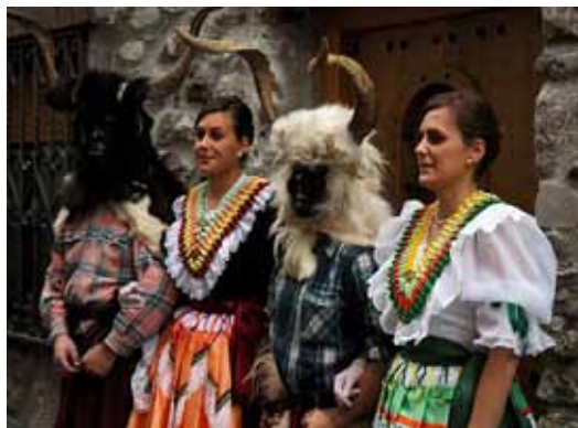
Carnaval de Bielsa (Huesca).

El Primer Viernes de Mayo se celebra en Jaca (Huesca) la fiesta que conmemora la victoria de los jaqueses contra un ejército musulmán que intentaba conquistar la ciudad. Consiste en un ruidoso y colorido desfile popular de victoria con vistosos trajes.