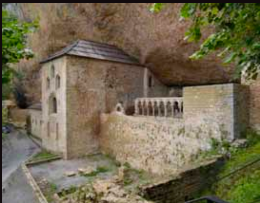
Monasterio de San Juan de la Peña.

Construido al abrigo de una inmensa peña que le da nombre, el conjunto aparece perfectamente mimetizado con su excepcional entorno natural. En su interior, cuya amplia cronología se inicia en el siglo X, destacan la primitiva iglesia mozárabe, el denominado Panteón de Nobles, la iglesia superior, consagrada en 1094 y la bella capilla gótica de San Victorián. Pero sobre todo, sobresale el bellísimo claustro románico, donde los capiteles representan escenas bíblicas de gran expresividad, y el Panteón Real, de estilo neoclásico y construido en el siglo XVIII.