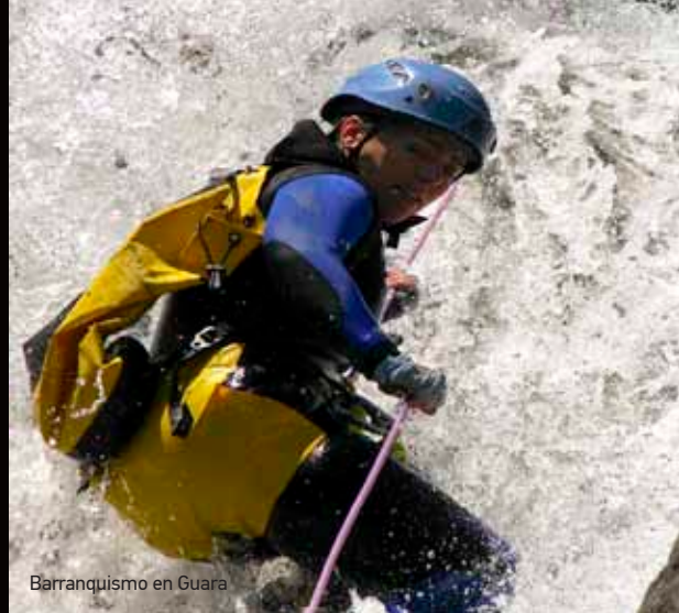
Barranquismo en Guara

También podrás surcar los cielos aragoneses en avioneta o ultraligero, o si te atreves, lanzándote en paracaídas. Los aeródromos de Benabarre , Castejón de Sos , Monflorte , Tardienta y Villanueva de Gállego , te servirán de base en esta apasionante aventura.