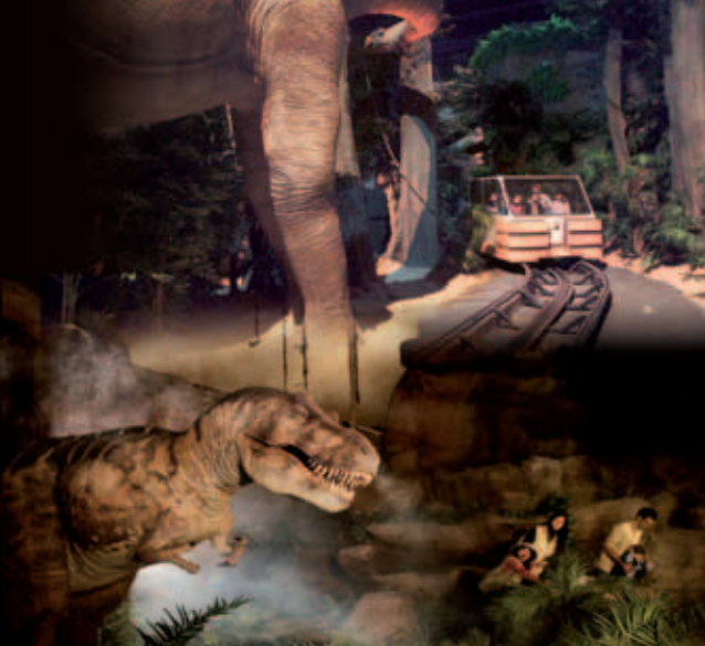
Territorio Dinópolis consagrado a los dinosaurios.