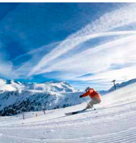
Valdelinares, en Teruel.