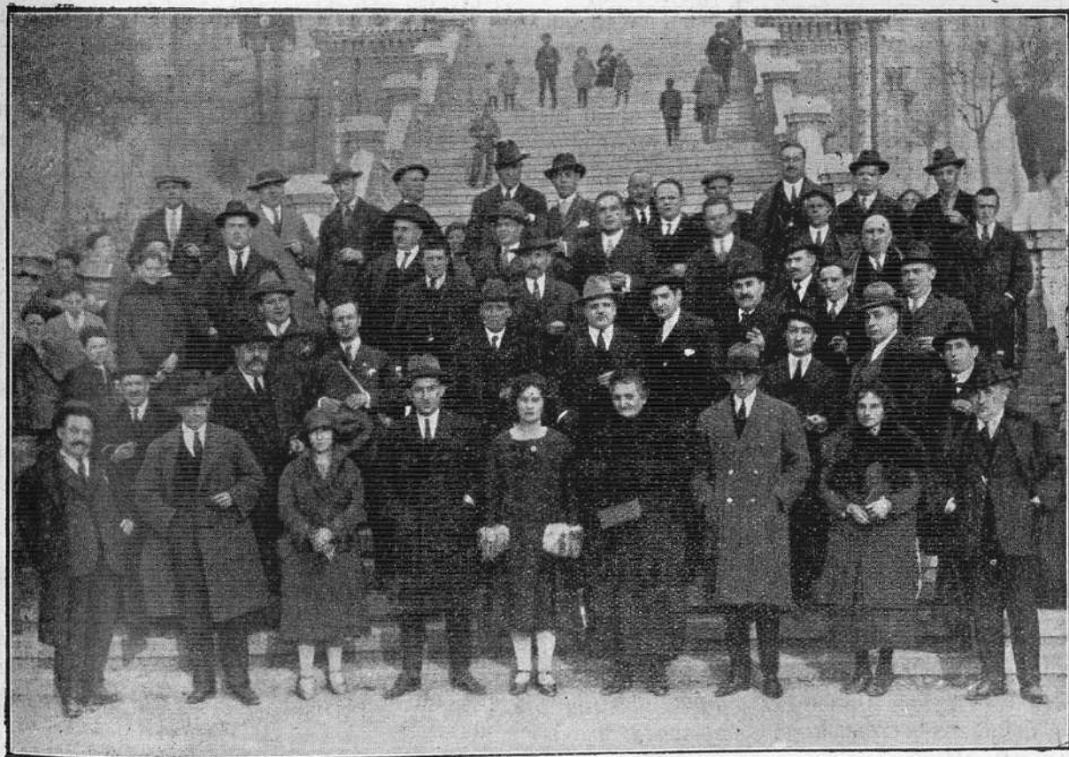
Grupo de varios señores asistentes al banquete después de la Asamblea celebrada el 28 de Febrero en el Círculo Católico de Obreros.