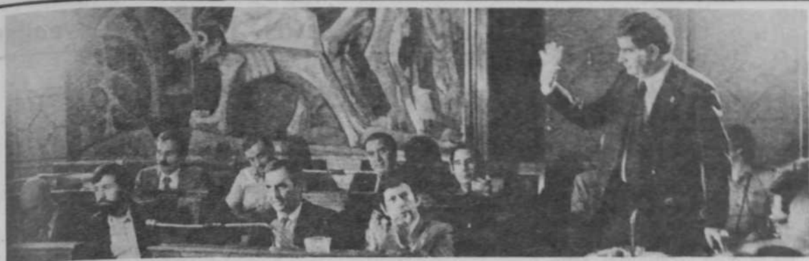
Bolea saluda, UCD aplaude, PSOE pone caras largas.