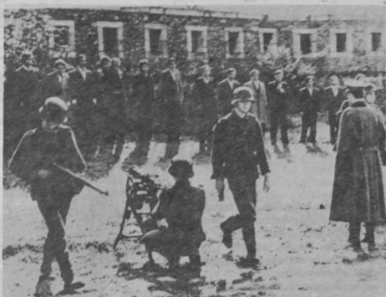
Emotivo momento de «L'Affiche Rouge».

Frank Cassenti, realizador de «El afiche rojo» («L'affiche rouge», 1977), toma la Historia como motivo, mas no como fin. En esencia, se nos propone en este film un espectáculo político que tiene muy en cuenta los postulados de Brecht, concernientes a signos que han configurado sus métodos teatrales. En Cassenti hay que tener muy en cuenta, por supuesto, la distanciamiento tanto como la audacia en un montaje escénico que toma como contexto la ejecución de veintitrés militantes de la Resistencia Francesa, asesinados por la Gestapo el 21 de febrero de 1944, cuando el destino de la guerra estaba poco menos que decidido. Frank Cassenti cuestiona un contexto histórico «que está fuera de la histo-