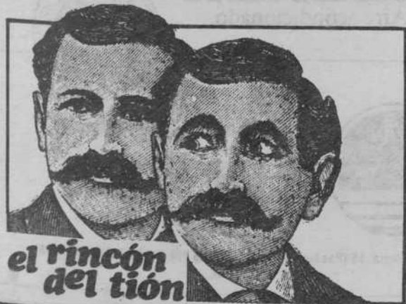
el rincón del tión

Monegros, núm. 5 (976) Teléf. 43 18 18 ZARAGOZA - 3