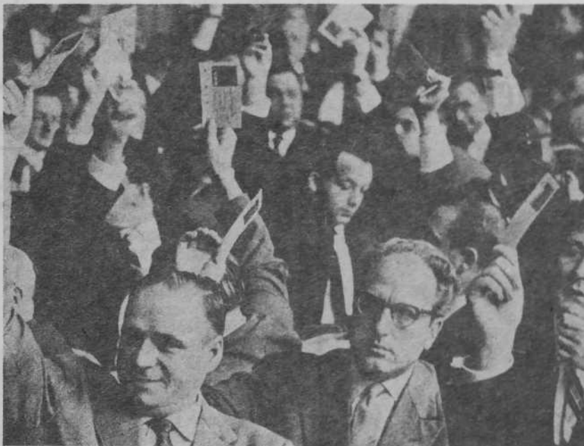
1959: los socialistas alemanes votando el nuevo programa en la ciudad-balneario de Bad-Godesberg.

paron de reformar los estatutos del partido, neutralizando preventivamente a la burocracia del SPD en Bonn, la llamada «barraca». Aunque tampoco hay que olvidar que, en el XXVIII Congreso del PSOE, la única comisión que parece fue visitada por miembros de la ejecutiva con una mentalidad distinta a la de «lo toma o lo deja» fue precisamente la de Estatutos, por algo será.