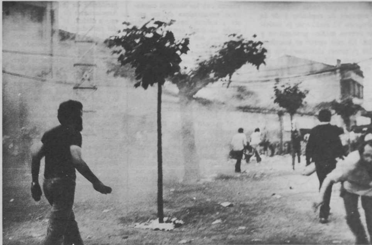
Tudela: ¿dónde estaba el derecho de reunión?

Hacia el mediodía, cada cual buscó una sombra, o un fresco agujero por el centro de Tudela, para echar buena cuenta de comida, café, copa y faria. El programa previsto para la tarde, y que nunca se llegaría a cumplir, era acudir de nuevo al lugar de concentración hacia las 4, donde habría nuevas intervenciones sobre los temas por los que allí estábamos concentrados. La idea de una toma simbólica del polígono de tiro se había desechado, ya que, previamente, toda la zona que rodea el polígono había sido tomada por fuerzas de orden público, y los controles en la carretera que conduce de Tudela a Arguedas hacían impensable pasar por ella. Para evitar, pues, situaciones de violencia y tensiones, todos los grupos convocantes y cuantos se sumaron a la concentración