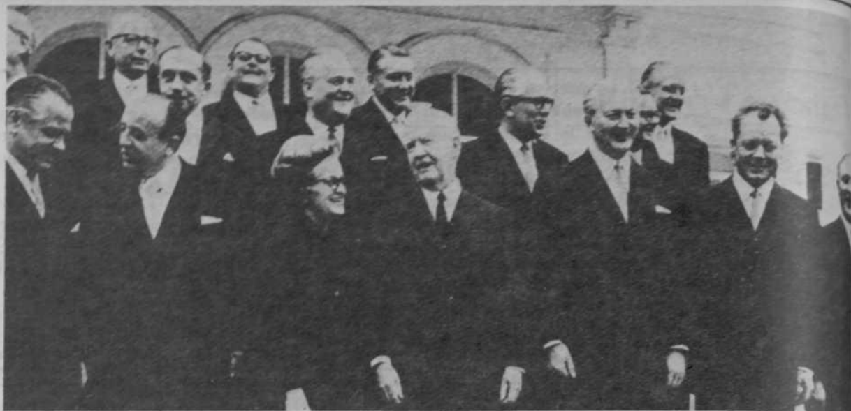
1967: el gabinete de la «Gran Coalición»: diez demócratacristianos, nueve socialistas.

Resulta un poco difícil creer que la ejecutiva del PSOE no supiese lo que se le venía encima con la celebración del XXVIII Congreso del Partido: el espectáculo único en Europa de un congreso que parece refutar todas las sabias teorías sobre la inercia de los aparatos y su capacidad de reproducción. Por eso, resulta más extraña la insistencia en mantener la fecha de la convocatoria tras dos campañas electorales sucesivas, y a pesar de las propuestas de aplazamiento que se recibieron, para permitir un período de preparación adecuado. Desde fuera da la sensación de que se ha querido forzar al partido en caliente, tras la ducha escocesa de las referencias ininterrumpidas al marxismo, de que se ha jugado conscientemente la carta de la fogosidad e inmadurez de una militancia, en parte de aluvión, para facilitar una operación de reajuste al servicio de proyectos a largo o medio plazo.