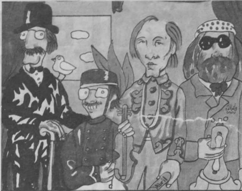
PUTURRÚ DE FUÁ

Puturrú de Fuá parecen conscientes de que la época que les ha tocado en suerte no difiere en mucho a la que vivieron las huestes de Moncho Alpuente... «En nuestro corto recorrido nos hemos dado cuenta de la existencia de una gran represión de cara al humor. Hay miedo a reir, a participar, a aplaudir, a reaccionar... La válvula de escape ha sido en los últimos años un humor miedoso (como en casi todo). Basta mirar la corta lista de precedentes en España para comprender que los últimos tiempos han sido de humor institucionalizado, cateto y moralista. Todo eso se advierte y se sufre a la hora de hacer humor y recibirlo; más todavía