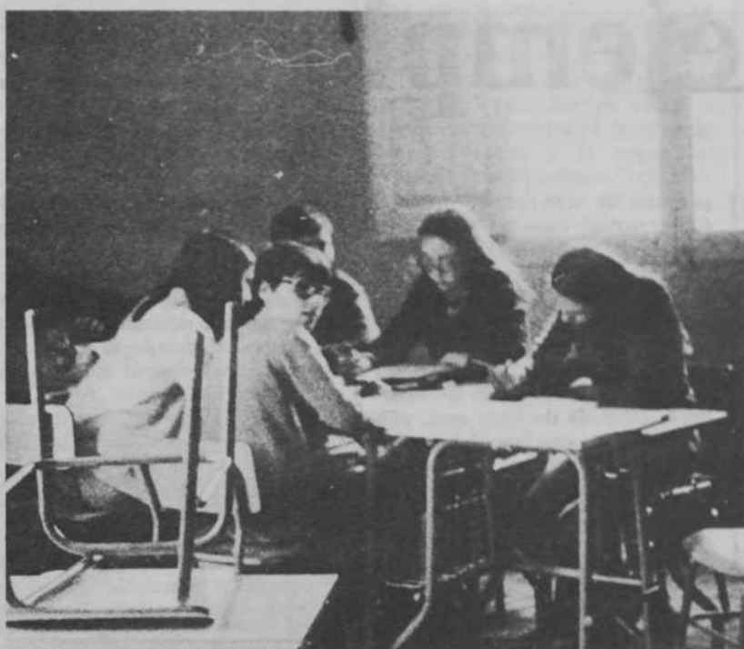
No quieren que los niños emigren

Los 96 niños en edad escolar son atendidos por 5 maestros, de los que 3 pertenecen a la plantilla del ministerio y 2 han sido contratados por los propios padres, que desembolsan mensualmente cuotas voluntarias que oscilan entre 300 y 1.000 pesetas. Dado que la escuela es «ilegal», las evaluaciones deben ser revisadas en Peñalba. Sin embargo, esto no es obstáculo para impedir que, en opinión de varios maestros que conocen el tema, la calidad de la enseñanza sea de mejor calidad que la que se imparte en