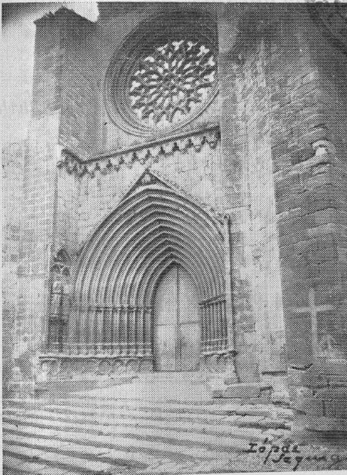
VALDERROBRES. - Artística portada de la iglesia de Santa María.

DIRECCION, REDACCION Y ADMINISTRACION: AMANTES, 26 - TERUEL