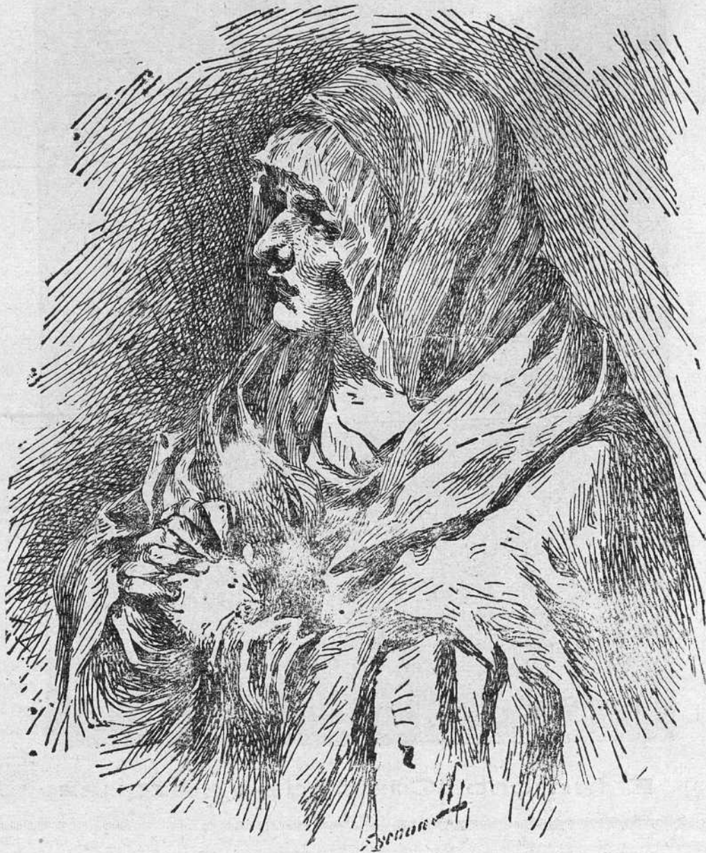
“STABAT MATER DOLOROSA”...

En aquel momento aciago, en que nuestro amor so Jesús está levantado entre el cielo y la tierra como hostia de propiciación, siente con amargos dolores, la intensidad de sus penas, las más acerbadas que se pueden concebir. No sólo le aquejan los clavos, las espigas que taladran sus sienes, las llagas que abrieron los azotes, la sed que abrasa sus fauces, las he-