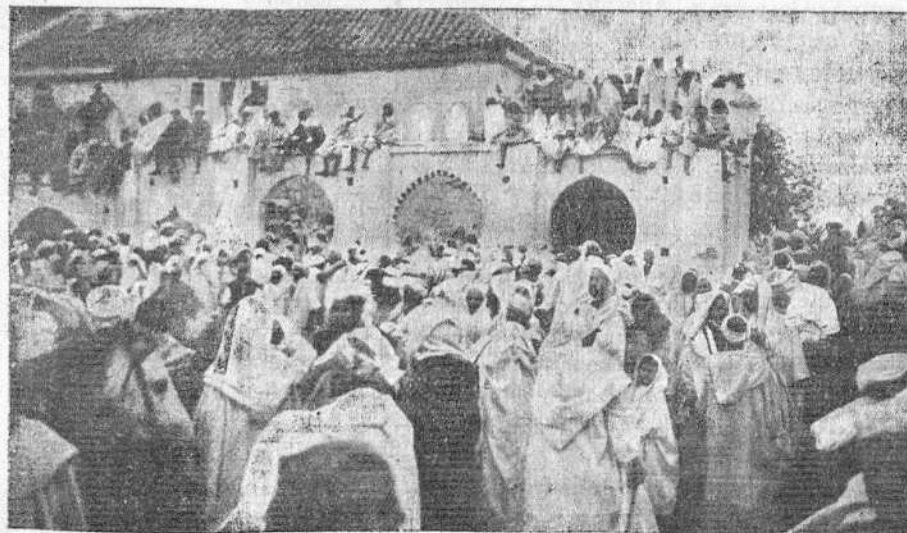
La muchedumbre apiñada en la plaza pública esperando la llegada del caíd