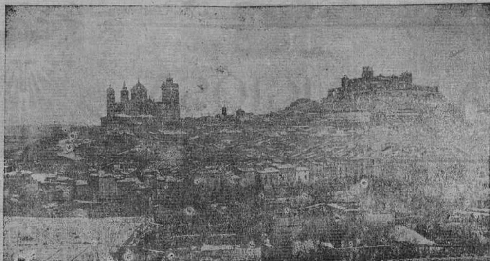
Vista general de Alcañiz, la hidalga ciudad, cobijada bajo las poderosas siluetas de su Colegiata y su Castillo.