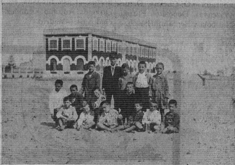
A la llegada al Sanatorio, los pequeños colonos desprovistos de su calzado para jugar sobre la arena. Al fondo el pabellón «Infanta María Cristina» que han de ocupar durante su estancia en la Malvarrosa.