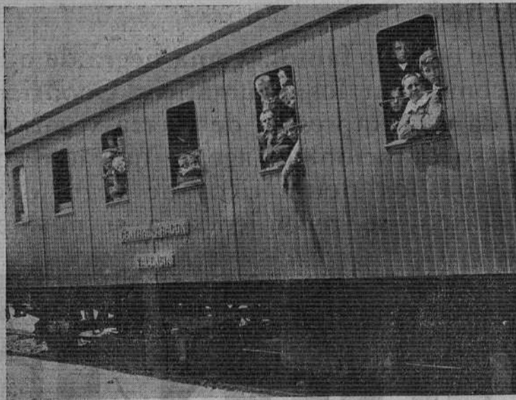
Los niños de nuestra Colonia escolar asomados a las ventanillas del tren que los condujo hacia las salutíferas playas de Levante.

Mañana 23 empieza el novenario; a las ocho y media la Santa Misa y por la tarde a la siete los demás actos.