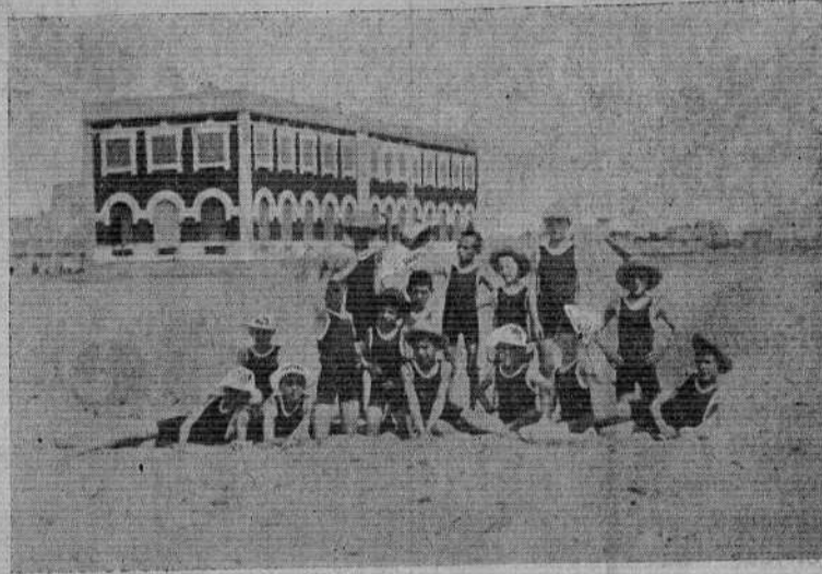
Ataviados con sus ligeros maillots y dispuestos a tomar su cotidiano baño, que tanto bien ha de producirles tonificando sus organismos.

El desayuno es a las ocho de la mañana; a las doce y media la comida; a las cuatro y media la merienda y a las ocho y media la cena.