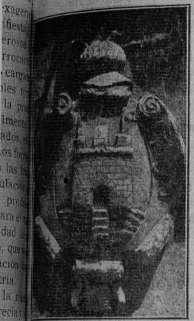
El escudo de la Villa