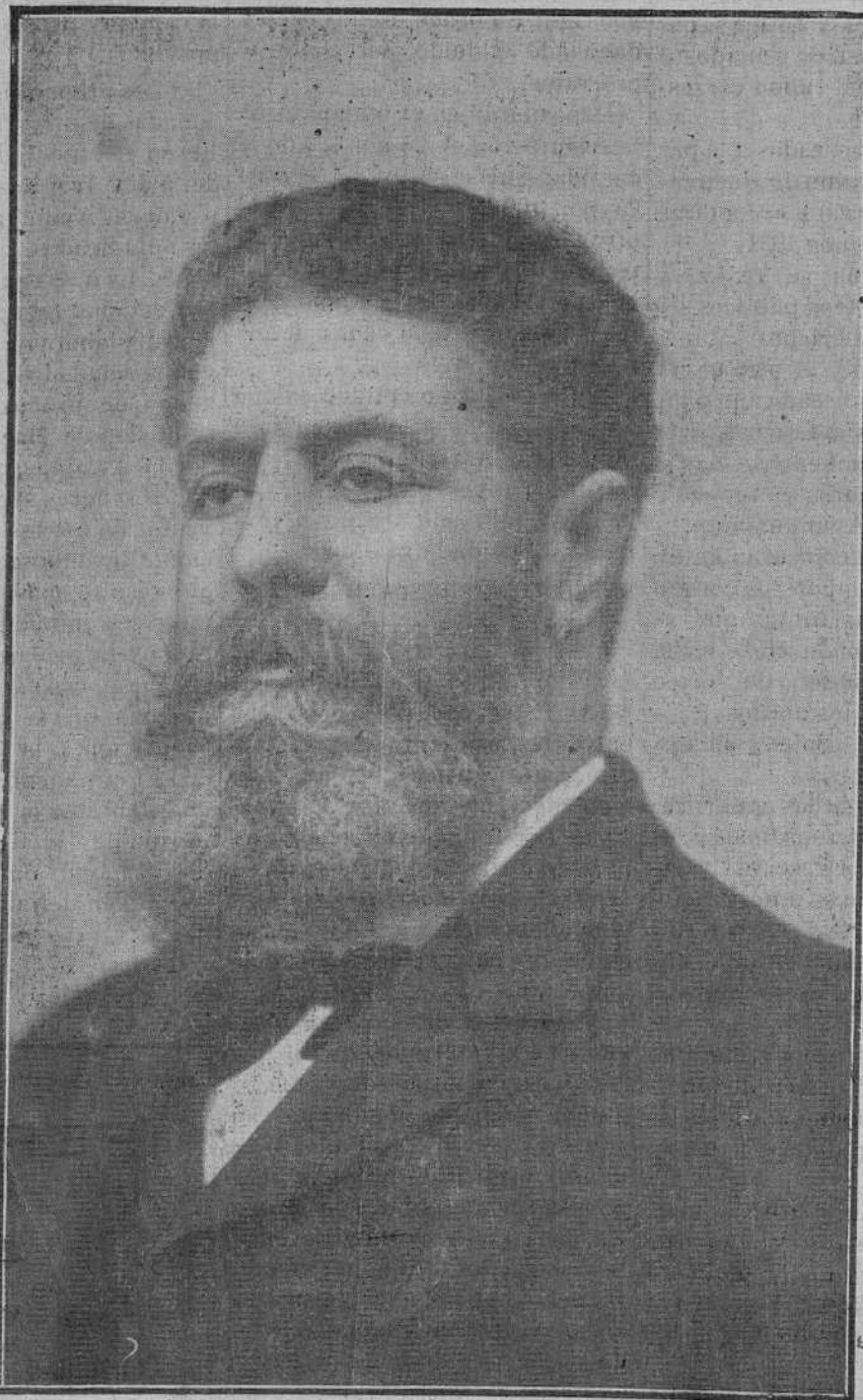
El insigne aragonés don Joaquín Costa, a quien se ha erigido un monumento en Graus con asistencia del jefe del Gobierno.