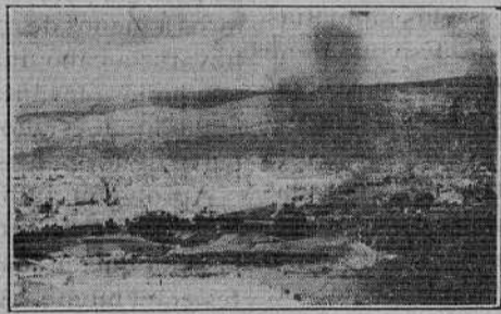
(Fotografía obtenida desde un avión)

importa mucho determinar serenamente el rumbo a seguir. Prever, equivale a no tener que lamentar.