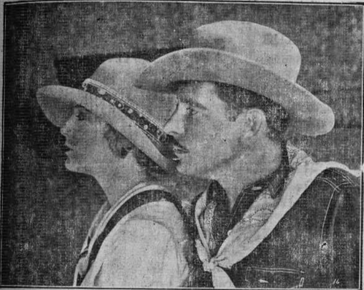
Ronald Colman y Vilma Banky en una interesante escena de «Flor del Desierto», según la famosa novela de Harold Bell Wright, adaptada por Francis Marion y dirigida por Henry King.