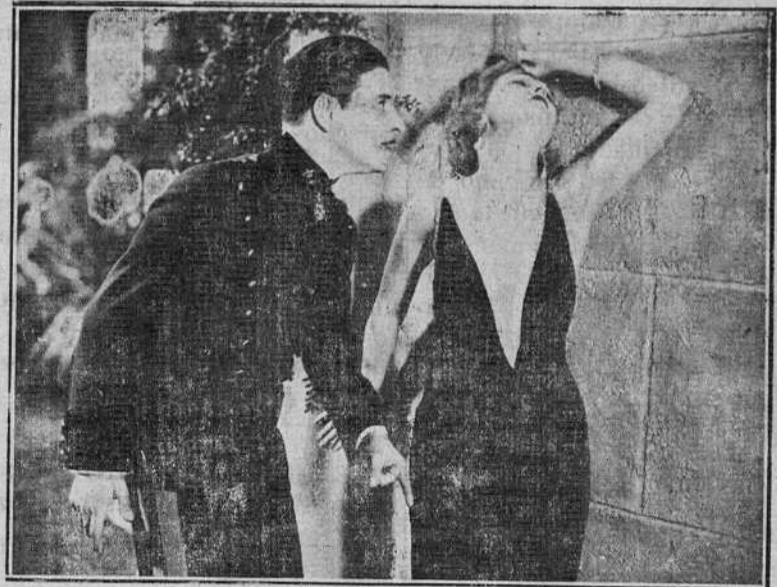
Ronald Colman y Vilma Banky en «La llama mágica», dirigida por Henry King, según la célebre novela húngara de Rudolph Lotan, titulada «Arlequín Rey».

Abajo, en el suelo, siguieron a un tiempo mismo la ruta aérea de Blanca dos vehículos de distinto porte: un carro vulgar, guiado por Tito, y un lujoso auto regido por la enguantada mano del conde Casati. Al aterrizar el paracaídas en que se lanzaba desde la altura la resuelta artista, el aristócrata la esperaba ya. Galante, marchó a su encuentro. Un hondó estupor paralizó a Blanca, tenía ante ella un hombre de tan absoluta semejanza física con Tito, que no pudo dominar el efecto sobrecogedor. Mas no, no era su amado. Decíanlo cierta distinción