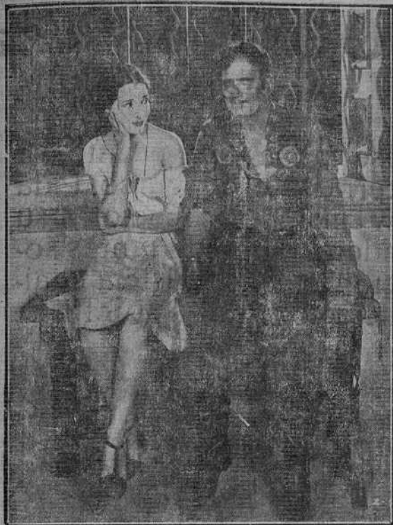
El famoso artista Douglas Fairbanks en una escena de la extraordinaria película «El Gaucho»