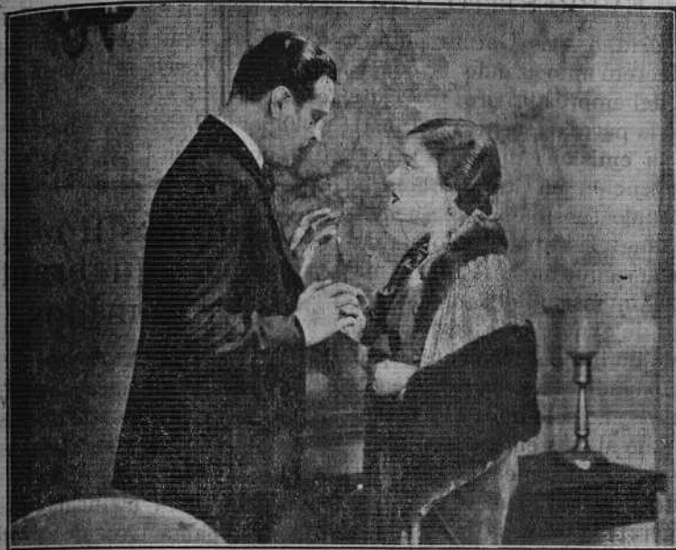
La bellísima estrella cinematográfica Gloria Swanson en una escena de la extraordinaria cinta EL AMOR DE SONIA