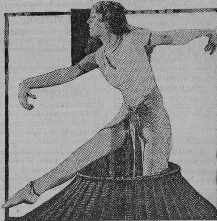
OLIVE BORDEN EN LA PELÍCULA «DEDOS AMARILLOS»

Apenas hace tres años que ha des-puntado esta actriz de la Fox y sin duda es ya la más comentada entre las stars neoyorquinas.