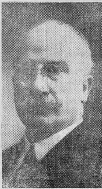
D. Alejandro Lerroux

alharacas. Su figura prócer, de hombre venerable y digno, atrae. Sus palabras, retienen. En la adversidad acertó a cantar las primicias de la República. En el triunfo, supo reflejar la propia y extraña alegría con estas palabras: Amaneció aquel día la República como el día primaveral que pudiera soñar un poeta, inundando en todos los espíritus las esperanzas; en todas las almas, la pasión y la fraternidad. Las gentes se abrazaban por las calles, como si hubieran llegado a la plenitud de los tiempos y el Paraíso fuera en cada hogar una expresión del