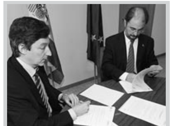
En la imagen, Javier Lambán y Carlos Pastor firman el acta de cesión de los terrenos. Estos antiguos terrenos de la CHE serán ahora parte del espacio donde se va a desarrollar la Ciudad del Agua. Estos terrenos circundan el actual edificio de la Comunidad General de Regantes de las Bardenas, lo que todos los ejeanos conocen como la Granja. Allí se experimentó en los años 40 del siglo XX con diferentes cultivos agrícolas. Uno de ellos, el «Aragón 03» se extendió por gran parte de España.

Ebro. Una vez desafectados, pasaron a Patrimonio del Estado, ente que depende del Ministerio de Economía y Hacienda. Ahora, por fin, después de un farragoso camino burocrático, esos terrenos han pasado de forma gratuita a ser propiedad del Ayuntamiento de Ejea de los Caballeros.