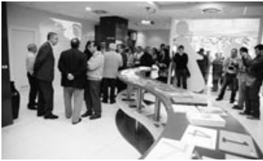
Aspecto del interior de la nueva Oficina Municipal de Turismo de Ejea.