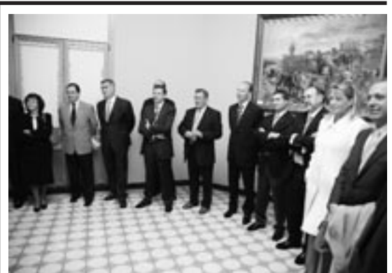
Consejeros de la CAI en el Ayuntamiento de Ejea.

Por eso, el ayuntamiento acordó «reiterar ante el Gobierno de Aragón la solicitud de un régimen especial en los términos ya planteados en acuerdo plenario de 7 de marzo de 2007». En el debate correspondiente, se puso de manifiesto que Javier Lambán y Javier Allué ya han mantenido contactos con el Consejo de Relaciones Institucionales del Gobierno de Aragón, Rogelio Silva, para tratar de encauzar esa concesión de régimen especial.