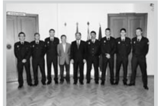
Los policías locales que aprueban una oposición deben pasar 3 meses realizando un curso de formación para su ingreso en los Cuerpos de Policía Local de Aragón. Son los únicos funcionarios que, una vez superada la oposición, deben superar también el curso de formación. Allí los preparan en derecho, técnicas de seguridad, pruebas físicas y manejo de armas reglamentarias, entre otras materias.

Ahora se procederá a ocupar parte de éste para extender las dependencias policiales y poder trabajar en unas mejores condiciones físicas.