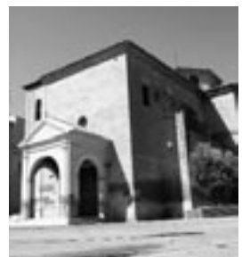
Iglesia de la Virgen de la Oliva.

La intención es que estos edificios, que en los últimos tiempos han sufrido diversas agresiones vandálicas, tengan un sistema de vigilancia constante y en tiempo real. De este modo, la intervención