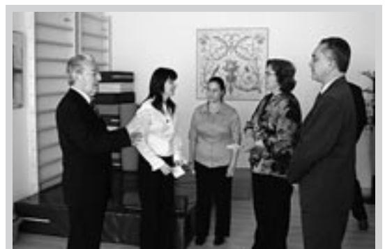
Momento de la visita al Centro.

Las actividades de FAT, acreditadas por el IASS, están concertadas con el citado organismo. Aquellas familias que deseen acceder al servicio del Centro de Atención Temprana deberán de dirigir su solicitud a través de los centros base o del Instituto Aragonés de Servicios Sociales, donde pueden hacer la solicitud de valoración, derivadas bien por los servicios sanitarios, educativos y sociales o bien por iniciativa propia. El Centro Base 1, al que pertenece la Comarca de las Cinco Villas, está ubicado en C/Sta.Teresa 19-21 de Zaragoza (tel: 976 715 666).