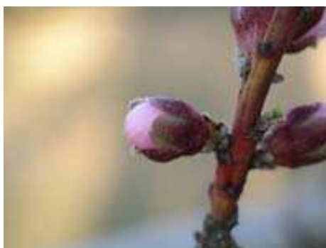
Estado fenológico D

Es previsible que en las zonas más tempranas, hacia finales del mes de febrero, se alcance el estado fenológico D (botón rosa) , será el momento de tratar contra el pulgón verde. Es muy importante realizar el tratamiento en el momento oportuno, antes de que una mínima apertura de los pétalos permita que las hembras penetren en el interior de la flor e imposibilite su control. (Ver fotografías). En las zonas tardías, es probable que el tratamiento pueda demorarse hasta principios del próximo mes.