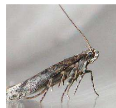
Adulto Tuta absoluta