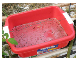
Trampa de agua