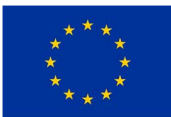
Fondo Europeo Agrícola de Desarrollo Rural: Europa invierte en las zonas rurales.

Queda suspendida en el período comprendido entre el 27 de enero de 2016 y el 2 de febrero de 2016 las solicitudes de ayuda para el almacenamiento privado de carne de porcino previsto en el Reglamento de Ejecución (UE) 2015/2334 . No se aceptarán las solicitudes de celebración de contratos presentadas durante ese período e igualmente serán desestimadas las solicitudes presentadas a partir del 21 de enero de 2016, cuya aceptación habría de decidirse durante el período antes citado, de acuerdo con el Reglamento de Ejecución (UE) 2015/2334 de la Comisión ( DOUE nº 17 de 26/01/2016 )