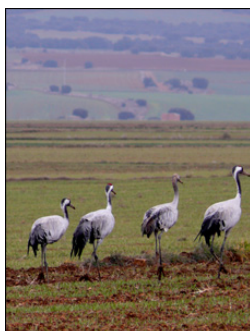
Grullas en Gallocanta

Este convenio de colaboración entre el Gobierno de Aragón y la Fundación bancaria "la Caixa", publicado mediante la Orden de 22 de diciembre de 2015 ( BOA nº 12 de 20/01/2016 ), tiene por objeto establecer las condiciones para la cooperación en el desarrollo y la ejecución de actuaciones para la protección, promoción, conservación y mejora del medio ambiente en espacios naturales protegidos gestionados por el Gobierno de Aragón, con la finalidad de alcanzar la mejora del estado de conservación y la reducción de la fragilidad ante posibles perturbaciones y la adecuada orientación del uso público, posibilitando, además, la oferta de trabajo a colectivos discapacitados o en riesgo de exclusión social.