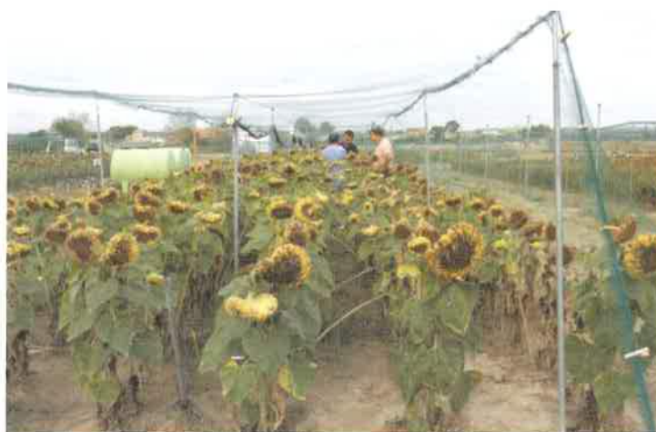
Foto 1. Cultivo de girasol.

Este trabajo se ha realizado en una parcela experimental del S.I.A. de Zaragoza, que dispone de riego por aspersión sectorizado. Entre cuatro aspersores se ubicó el ensayo durante tres años (96-97-98) y se utilizó la semilla comercial Albasol. La siembra se hizo con sembradora de microensayos, la recolección a mano y el resto de labores con aperos tradicionales.