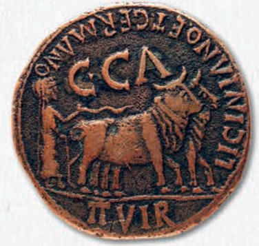
Moneda fundacional Caesar Augusta