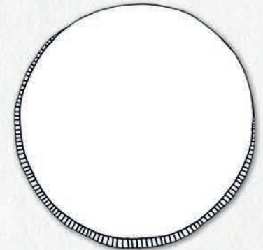
Dibuja tu propia moneda