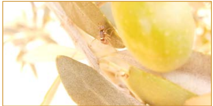
Adulto mosca del olivo

En caso de realizar tratamiento con caolín la aplicación deberá realizarse cuando la aceituna sea receptiva para la mosca, que coincide con el endurecimiento de hueso y antes de que sea atacada.