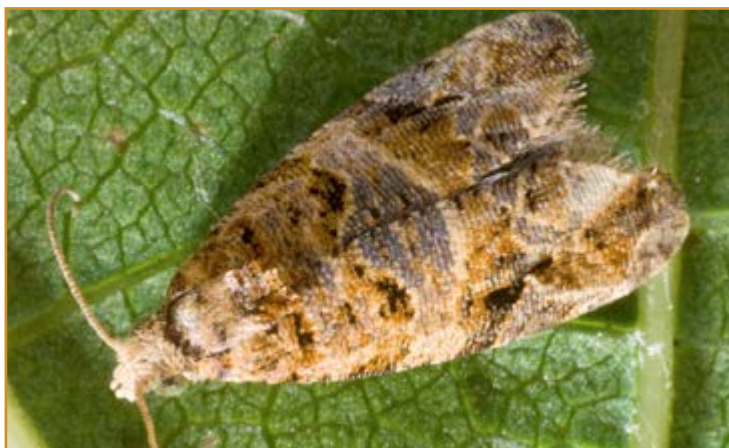
Adulto de Lobesia botrana

Los productos recomendados para el control de esta generación y la tercera figuran en el siguiente cuadro: