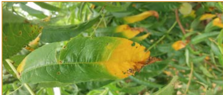
Daños de Xanthomonas en hoja de melocotonero

Se trata de una bacteria de cuarentena que, en nuestras condiciones, afecta al almendro y a todos los frutales de hueso excepto al cerezo. La experiencia acumulada en los últimos años permite afirmar que los daños son notablemente más importantes en algunas variedades como Honey Royale, Honey Blaze, Royal Summer, Ryan Sun o Sweet Dream.