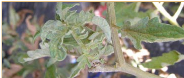
Eriófidos en tomate

Abamectina 1,8%EC, 1,8EW (VARIOS-Varias), azadiractin 3,2%EC (VARIOS-Varias), azufre varias formulaciones (VARIOS-Varias) y spiroresifen 24%SC (OBERON-Bayer).