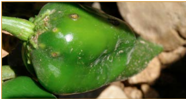
Daños de Xanthomonas