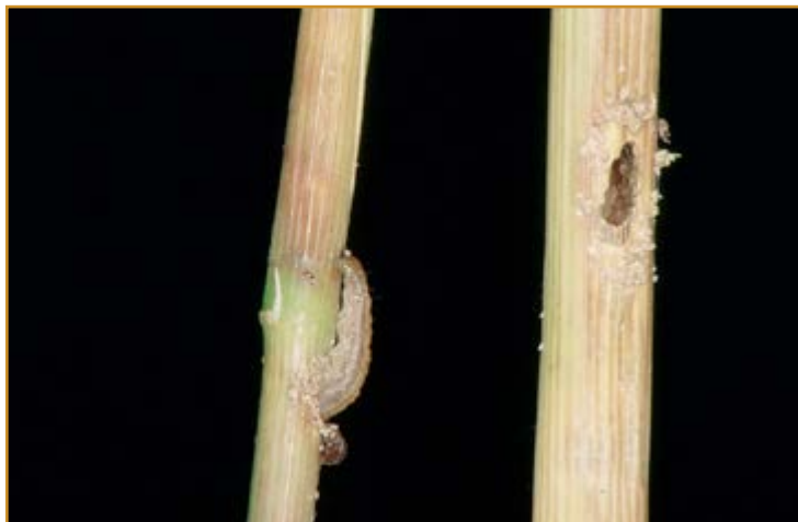
Larva de Chilo suppressalis

Hay que vigilar el cultivo cuando las temperaturas oscilan entre 22°-29°C y se alcanzan elevadas humedades relativas en torno al 90%.