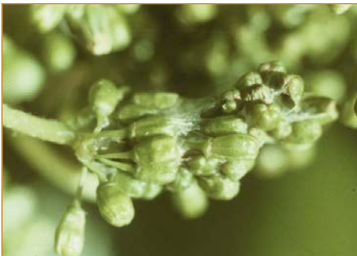
Glómulo de polilla del racimo

Se recomienda utilizar alguno de los siguientes productos: