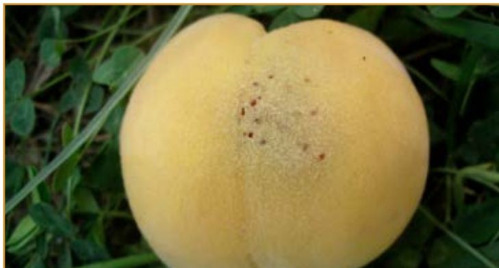
Melocotón atacado por la mosca mediterránea de las frutas

Puesto que este insecto es capaz de multiplicarse en los frutos que quedan en el árbol o en el suelo tras la recolección, y para intentar limitar la extensión de la plaga a otras variedades próximas a madurar, es muy importante eliminar de la parcela toda la fruta, tanto del suelo como del árbol, inmediatamente después de concluir la recolección.