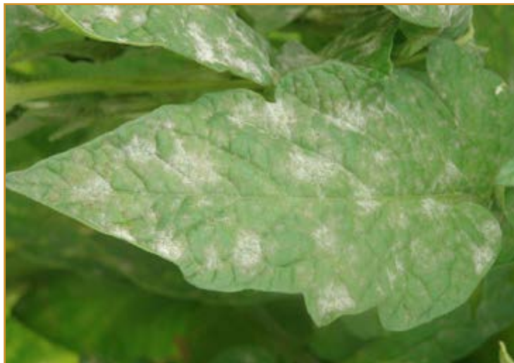
Daños de oidio en hojas

Xanthomonas vesicatoria . En caso necesario, se tratará con uno de los siguientes productos, alternándolos según su modo de acción: