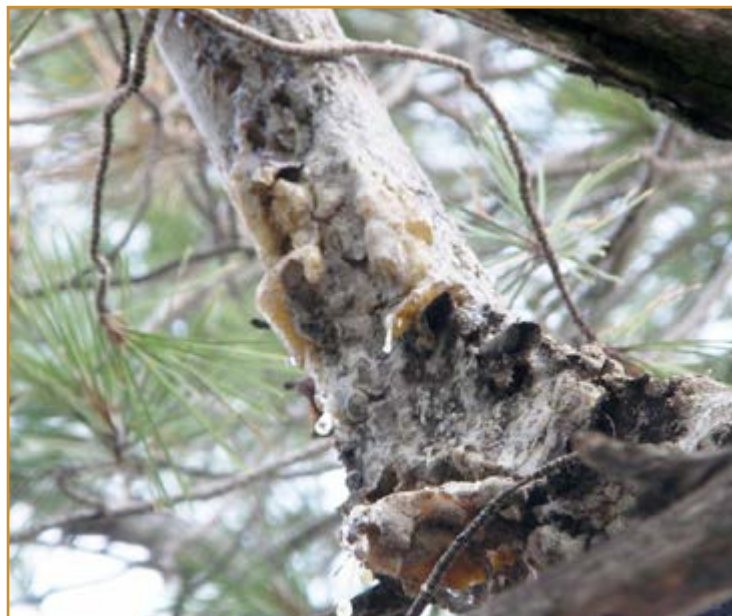
Daños de Cronartium flaccidum

Los signos más característicos son exudaciones de savia en forma de pequeñas gotitas translúcidas, prácticamente imperceptibles. En uno o dos años se desarrollan ecidios en forma de vesículas grandes, de hasta 6 mm de diámetro, saliendo a la corteza. Su tonalidad es anaranjada cuando están repletos de ecidiósporas.