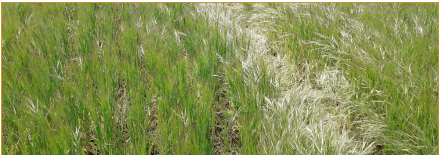
Parcela infestada por Bromus spp.