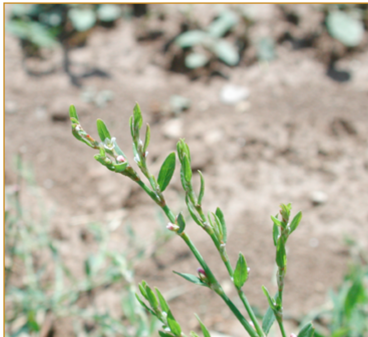
Diferentes estadios de Polygonum aviculare o ciennudos.