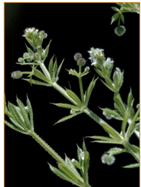
Diferentes estadios de Galium aparine o amor del hortelano.