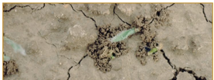
Detalle de orificios originados por Zabrus