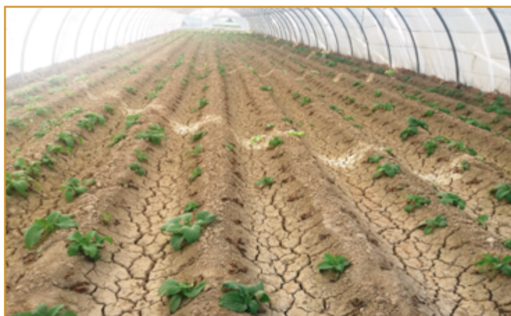
Daños en invernadero de fusarium

Desde el CSCV, y cara a la próxima campaña, se llevarán a cabo una serie de medidas y controles para intentar minimizar los daños producidos por este hongo.