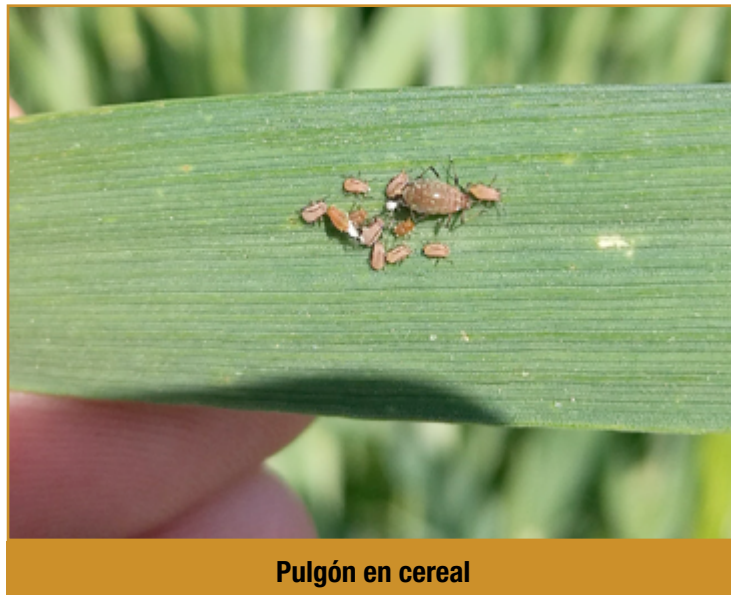
Pulgón en cereal

El riesgo de ataques por pulgones está favorecido por las siembras tempranas y las condiciones climáticas suaves. Se recomienda retrasar las siembras y en el caso que sea necesario realizar tratamientos químicos con productos autorizados, entre el estado de 3 hojas e inicio de ahijado del cereal, cuando se observe el 10% de las plantas colonizadas con al menos un pulgón y la temperatura sea superior a 6°C.