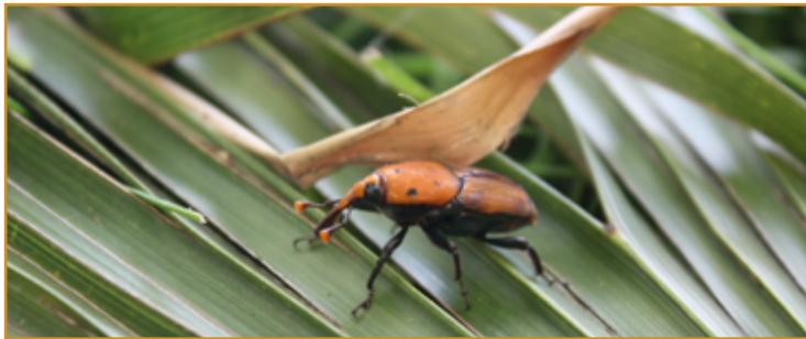
Adulto de Picudo rojo