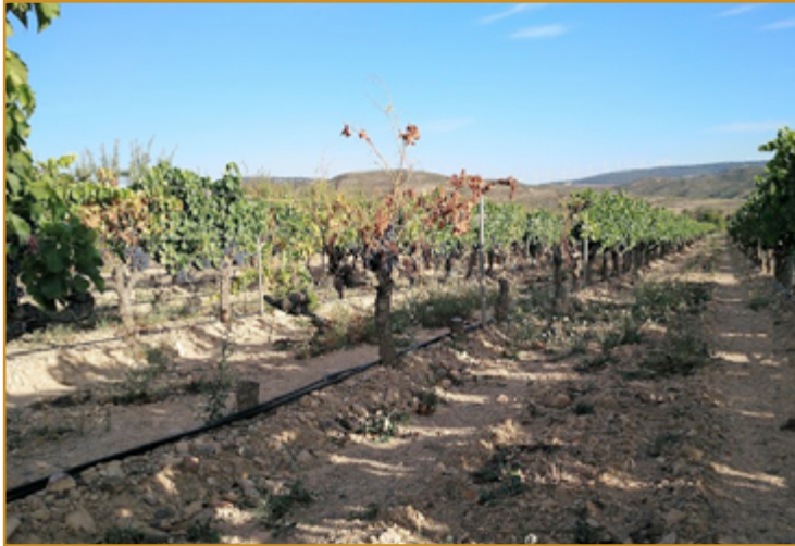
Daño de enfermedad de madera

observar la evolución y la afección de la enfermedad de la madera antes de arrancar, así como confirmar su diagnóstico, como se realiza en el CSCV.