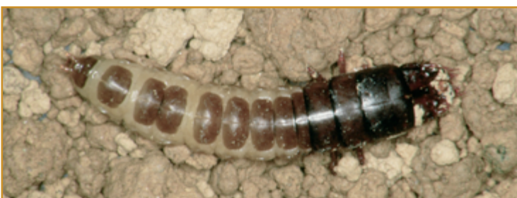
Larva de Zabrus

Es interesante, en este caso, determinar si el ataque es generalizado en toda la parcela o bien se limita a determinados rodales, en cuyo caso el tratamiento se dirigirá exclusivamente a las zonas afectadas.