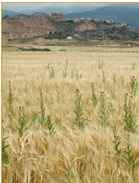
Infestación de cardo ( Cirsium arvense ) en cebada postemergencia