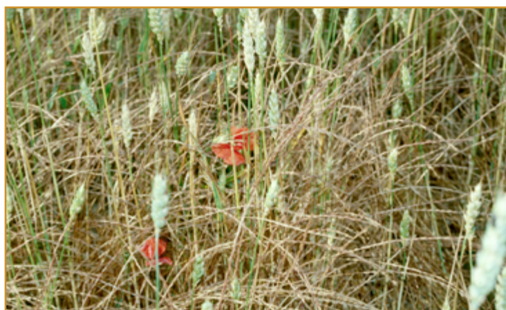
Vulpia myuros , la especie más común, e infestación de V. unilateralis en trigo, éste último se puede confundir con vallico.