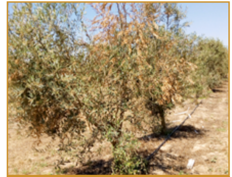
Verticilosis en olivo

Ambas enfermedades (verticilosis y tuberculosis) carecen de métodos efectivos de control por lo que hay que recurrir a una serie de medidas culturales y de manejo que mitiguen en lo posible su desarrollo y expansión.