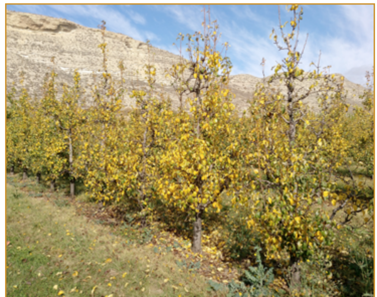
Caída hojas en perales

En 2018, los daños causados por moteado en manzano y peral han sido muy poco relevantes, sin embargo, se han observado infecciones tardías de septoriosis. En aquellas parcelas que hayan padecido síntomas es re-