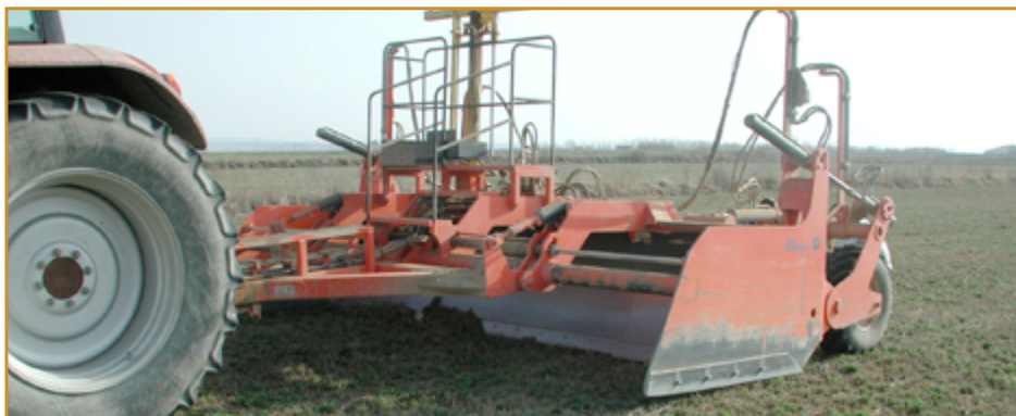
Pase de niveladora en campo de alfalfa durante la parada invernal