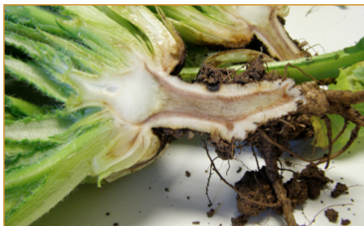
Daños en raíz y base del tallo