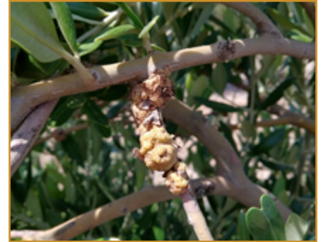
Daño de tuberculosis