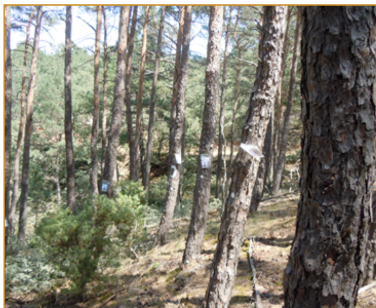
Parcela de la Red de evaluación

y se evalúa su estado fitosanitario (defoliación, decoloración, agentes nocivos presentes, etc.), con el fin de proporcionar una información sistematizada, periódica y actualizada sobre el estado de salud de los montes de nuestra Comunidad. Con la remisión de los informes, se dará por concluida la prospección del año 2018.