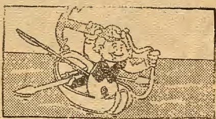
Con natural alegría tras un viaje de emoción, llegó Gil donde quería. Lugar en que pretendía matar la Constitución.