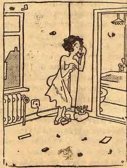
—¿A recolectar votos? ¡Ay, sí, enseguida! Que tengan preparados los colchones, que yo ya estoy a punto.