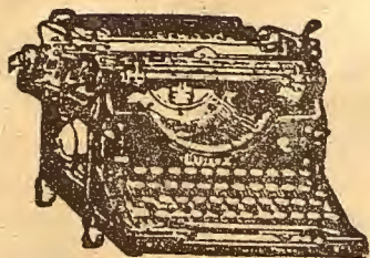
desde 20 pesetas mensuales