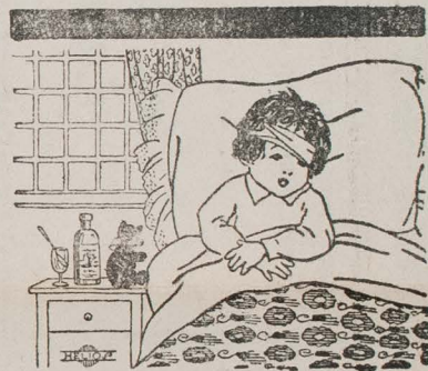
Manolito está en cama. ¿Qué tendrá Manolito?

Lo que comunica por medio de la Prensa local.