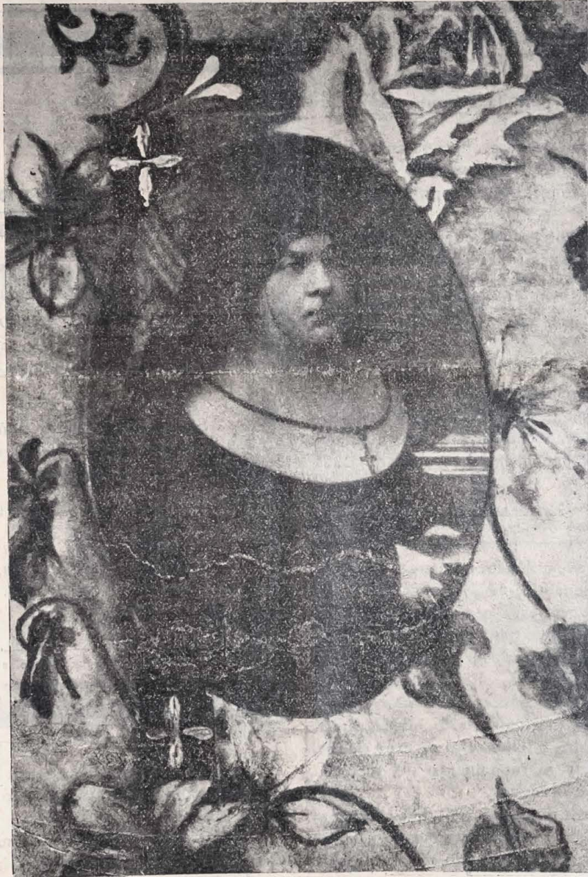
La Rda. Madre Soledad Torres y Acosta Fundadora del Instituto de Siervas de María