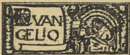
DOMINGO DE PASCUA (S. Marc. XVI, 1-7)

Comenzará en breve una nueva página de la historia de la humanidad; nosotros, los apóstoles de Cristo preparémonos para no ser espectadores sino actores. Fortalezcamos nuestra alma con los Ejercicios Espirituales y nuestro espíritu con los Círculos de Estudio. Pero apresurémonos en nuestra formación: Está terminando el Viernes Santo y se acerca ya la Resurrección: El mundo, destruido, se levantará de entre sus ruinas gloriosas para empezar una nueva etapa más realista, más humana, más justa y más cristiana.