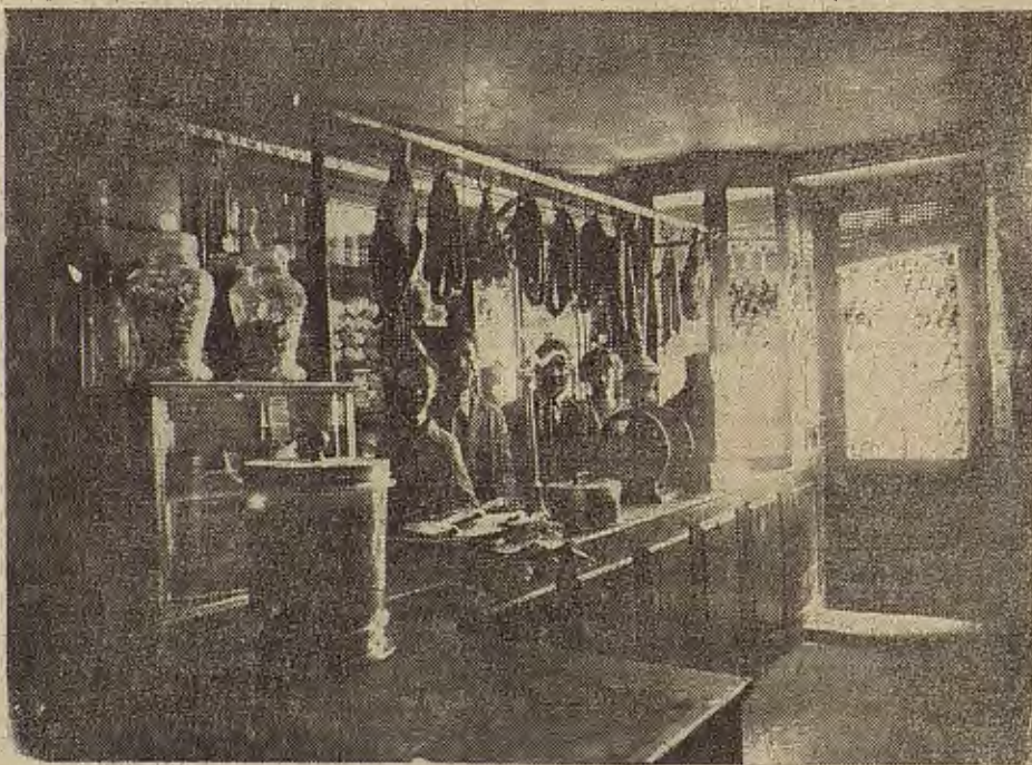
Vista interior del popular comercio de ultramarinos «La Rabalera», sito en la calle del Rosario (Arrabal)

Como respondiendo plenamente a la sugerencia La Rabalera que os presenta en su portada.