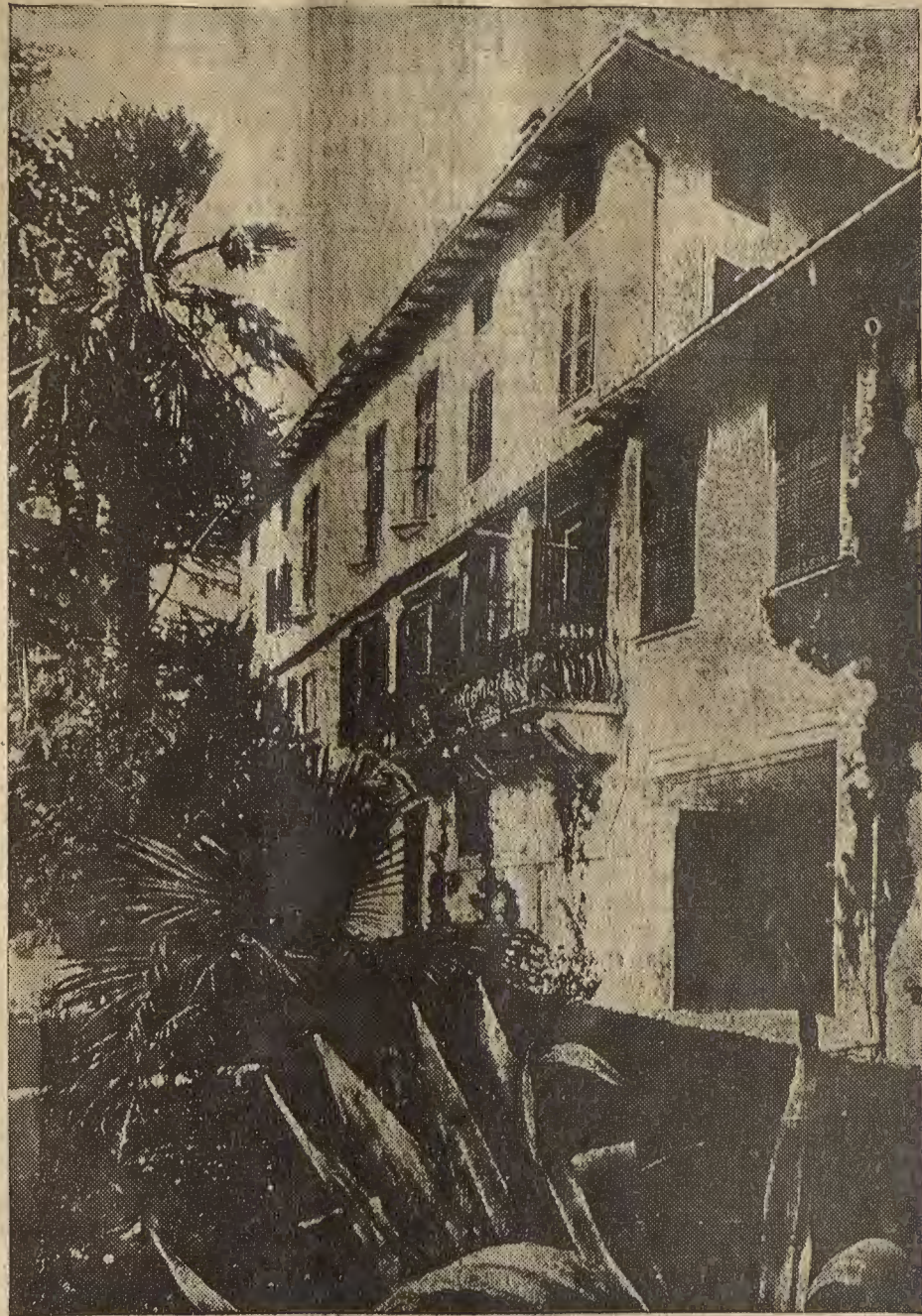
La villa de D'Annunzio en Gardona sul Garda, que ha regalado al Estado después de haberla convertido en Museo de la Victoria