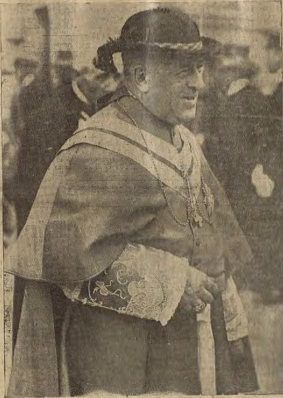
FIGURA DE ACTUALIDAD