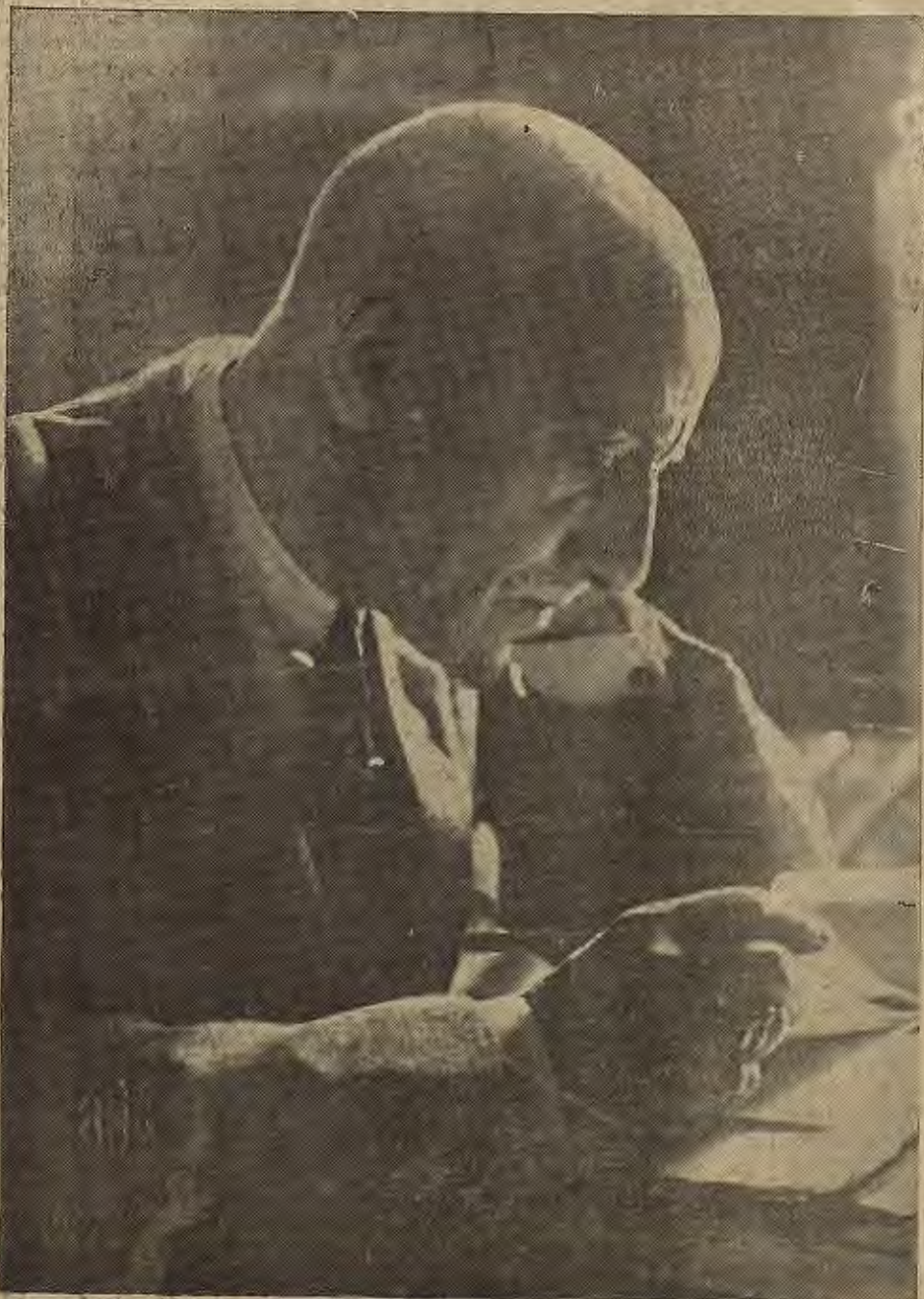
El poeta italiano D'Annunzio, que ha hecho donación al Estado, de su villa de Gardona, la cual ha convertido en Museo de la Victoria.