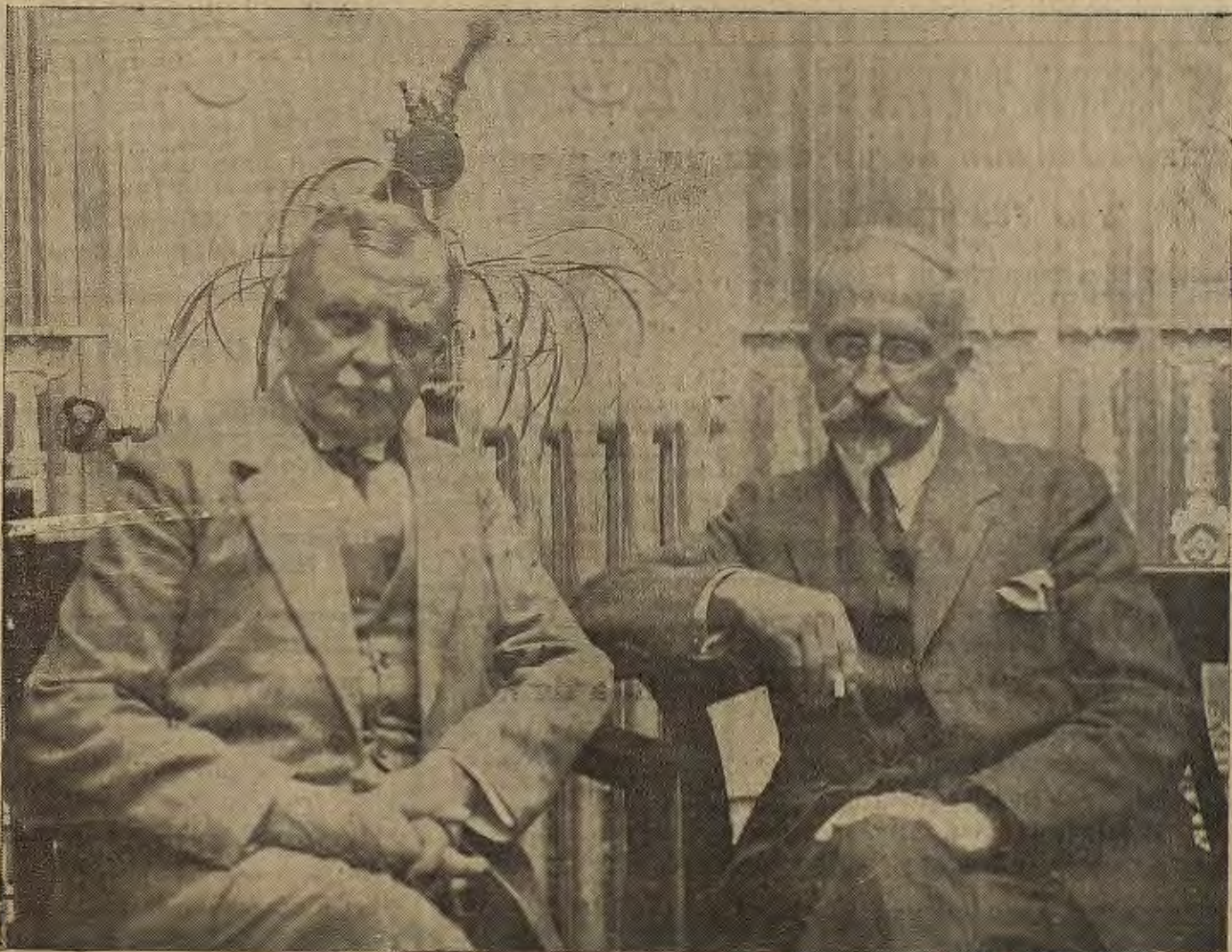
MADRID.—El embajador de Alemania barón Langwerf, von Simmern con el sabio profesor de la Universidad de Berlín (x) señor Dessoir, que ha dado unas interesantes conferencias en la Universidad Central

Cuando pase el próximo verano, se instalará el Príncipe de Asturias en las habitaciones de palacio, llamadas del duque de Génova.