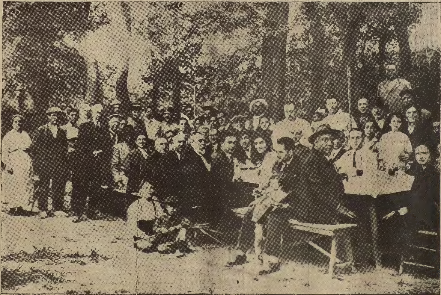
FIESTA FESCADERIL CELEBRADA EL DOMINGO A ORILLAS DEL EBRO. - Comida que se sirvió en la plazuela de "Las Peñetas".

Enseguida se bañan con huevo y se meten en un horno algo caliente, y cuando estén dorados y esponjados se sacan, debiéndose comer en seguida, pues pierden todo el mérito si se vuelven a calentar. El mariscal Duque de Richelieu decía que para comer a gusto estos pastelillos era necesario que cada comensal llevase un horno en el bolsillo. A nuestro gran poeta don José Zorrilla le gustaban tanto que frecuentaba mucho, en busca de ellos, una vieja pastelería de la calle de Mesón de Paredes.