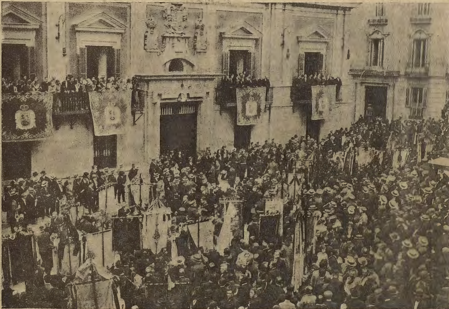
ACERD.—Los coros Clavé, de Cataluña, cantando ante el Ayuntamiento de la Corte