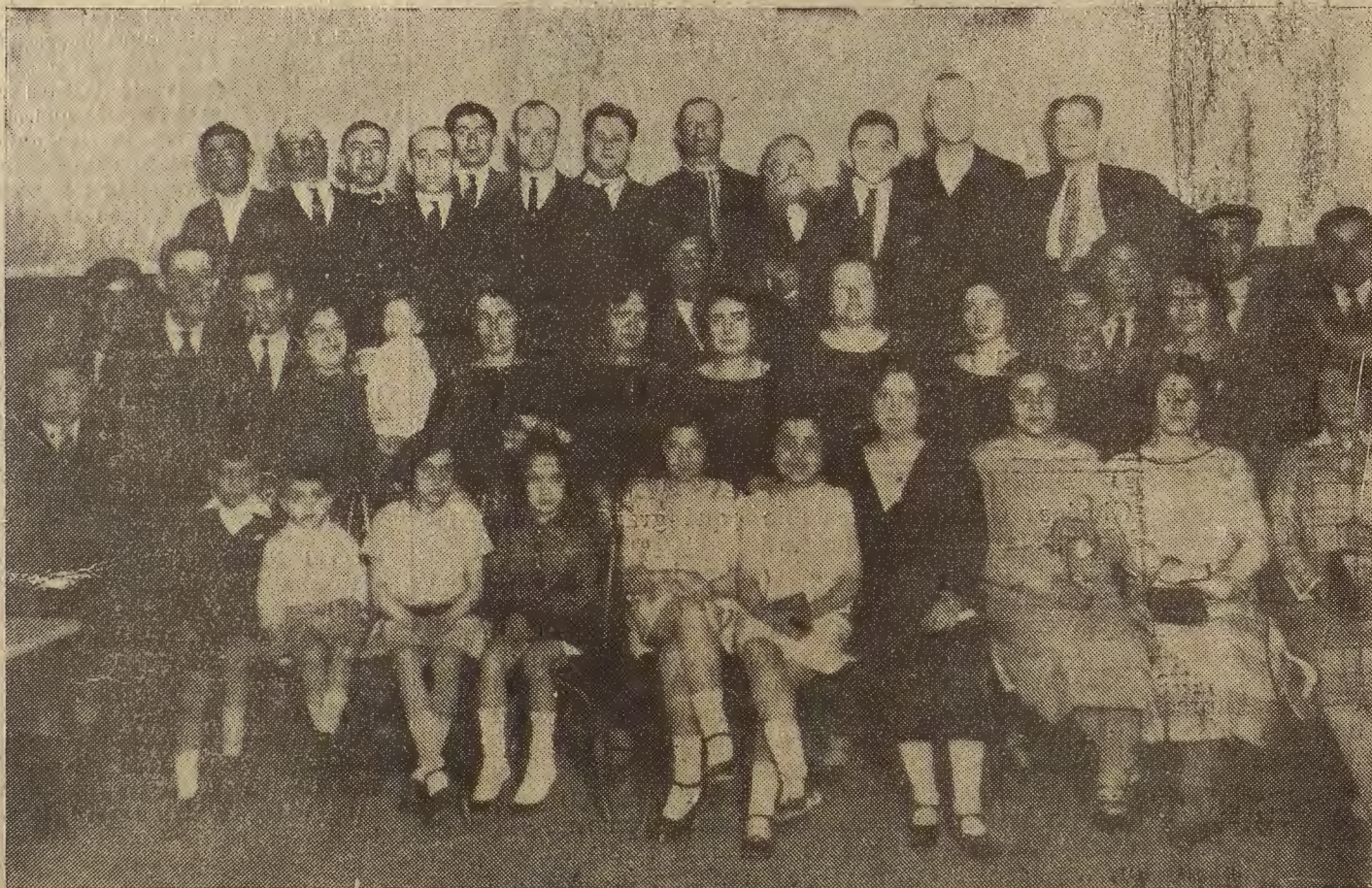
Grupo de concurrentes a la fiesta celebrada en el círculo "Unión de Cazadores y Pescadores de Zaragoza."

El plazo de entrega lo determinará el indicio técnico y el importe de los anuncios publicados en la Prensa local serán de cuenta del adjudicatario.