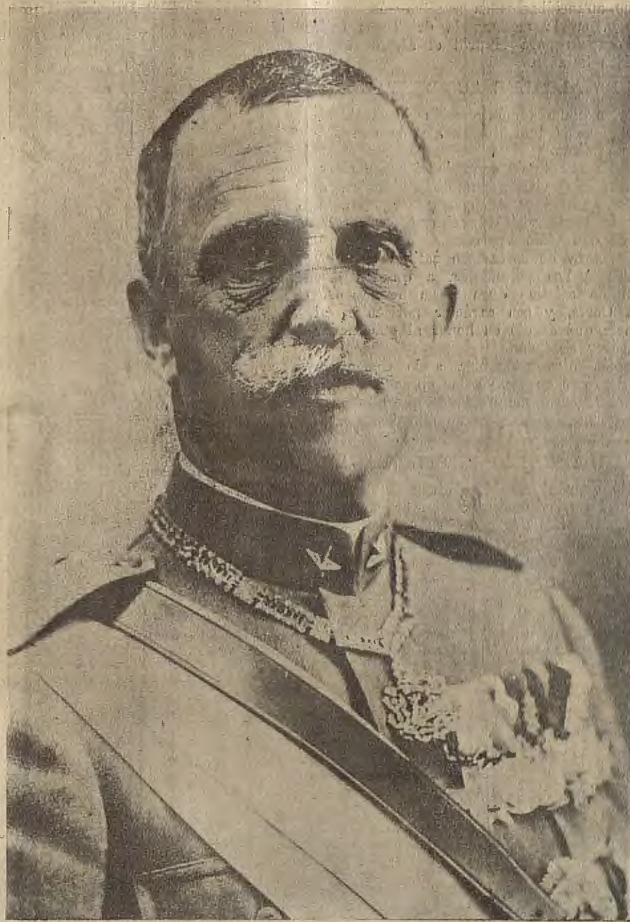
FIGURA DE ACTUALIDAD

Su actual alcalde es incapaz de escribir, no una carta, ni siquiera su nombre y apellido.