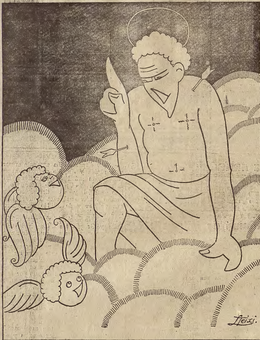
¡V NO VA MAS! -- San Sebastián a los angelotes. -- ¡Vaya niños, se terminaron los juzgos; ahora, a trabajar todo el mundo!

Se presentó el proyecto de nuevo Reglamento.