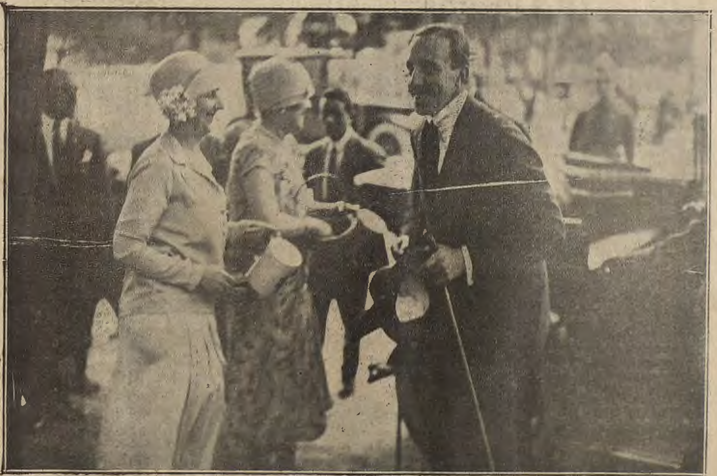
FIESTA DE LA FLOR EN MADRID. -- El Rey, entregando un donativo.

Se cuecen en agua, se mondan y hacen ruedas, poniéndolas después en una cazuela con manteca, sal, pimienta, perejil y cebollino picados y un poquito de harina. Se mojan enseguida con caldo de carne o de vigilia y un vaso grande de vino, según la cantidad de patatas empleadas, y cuando estén a punto se sirven bien sazonadas.