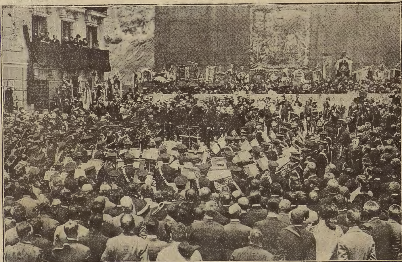
5 COROS CLAVÉ EN MADRID. -- Foto de descubrir la vida que da a una calle madrileña el nombre del músico catalán.