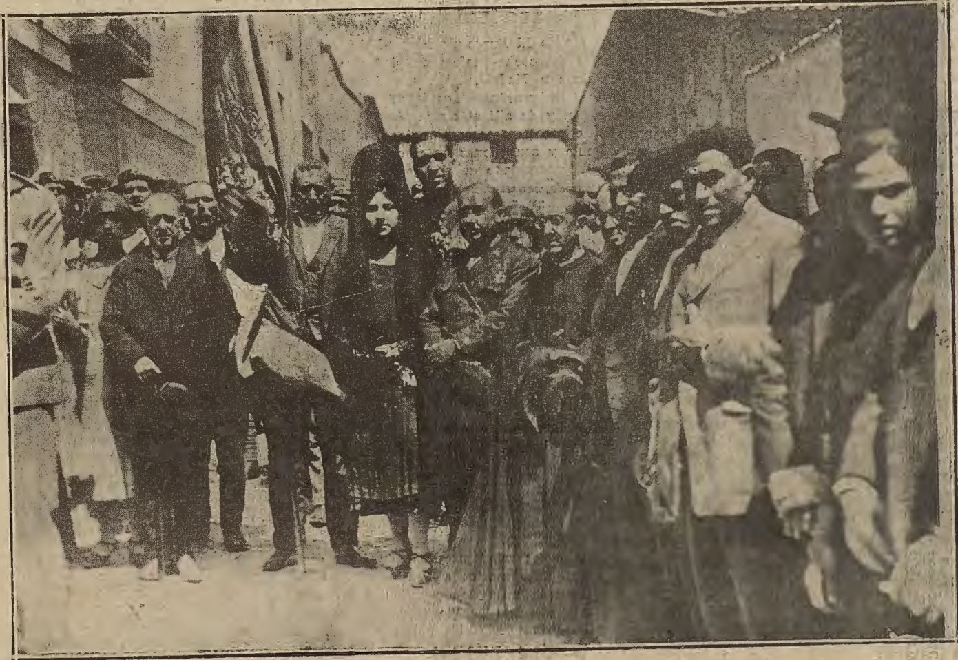
ALAGON: bendición de la bandera del somatén. - La madrina, con las autoridades, al salir de misa después de la ceremonia.

La correspondencia de LA VOZ DE ARAGON debe ser dirigida al apartado de Correos núm. 140; la literaria e informativa al Director; la administrativa al Administrador