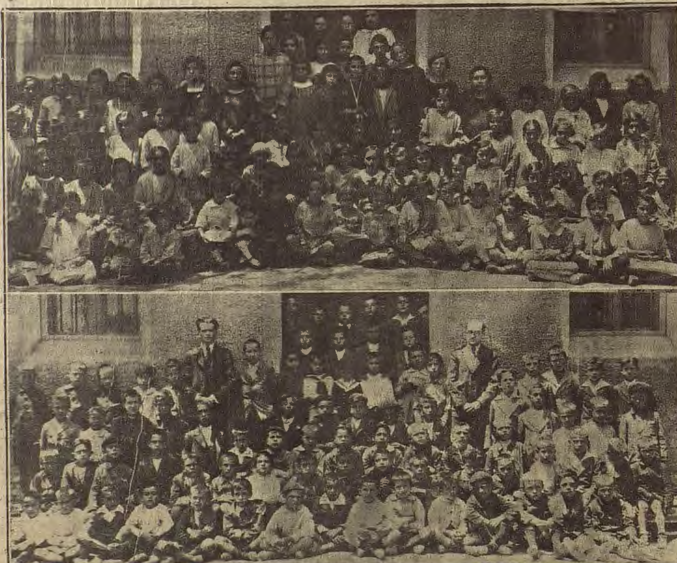
EXPOSICIONES ESCOLARES.—Las niñas y niños de la escuela de Montañana.