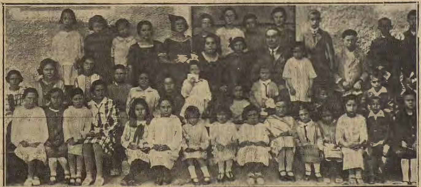
Las niñas y niños de la escuela de Moyera, fotografiados con motivo de la visita a la exposición escolar.