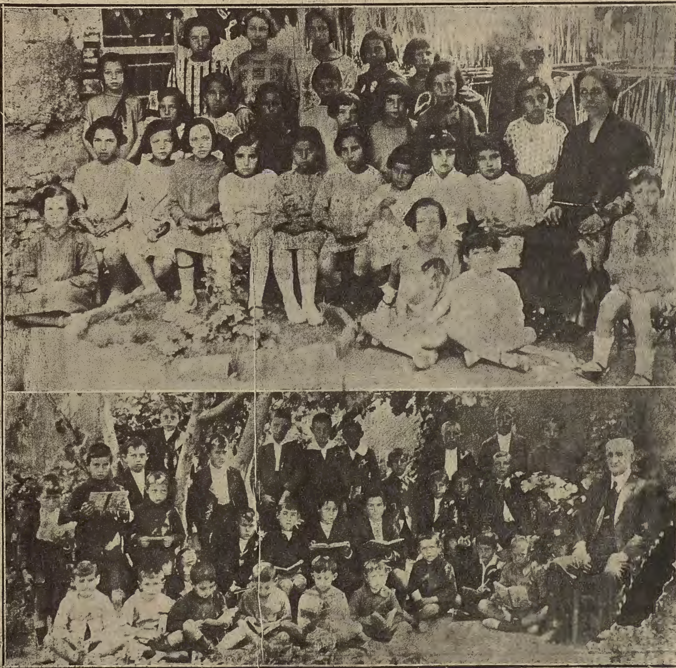
PEÑAFLORES. - Niñas y niños de la escuela nacional, fotografiados con motivo de la visita oficial a la exposición escolar.

El domingo, a las doce, se inauguró en el Centro Mercantil, la exposición de los cuadros del primero y de los esmaltes del segundo. Herrero es un pintor que empieza, audazmente, lanzado por la senda del impresionismo y de la pintura violenta. Gil Losilla presenta unos esmaltes finos, bien ejecutados y de muy buen gusto. La exposición de las obras de estos dos artistas se vió muy concurrida y ambos fueron muy felicitados.