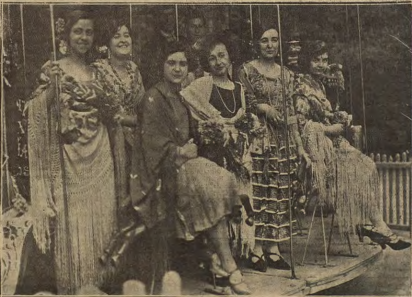
MADRID. — Un aspecto de la verbena celebrada en los jardines del Retiro a favor de las colonias escolares veraniegas de niños pobres.

Al la hora acostumbrada, terminó el Consejo celebrado por el Directorio. La referencia oficiosa dice