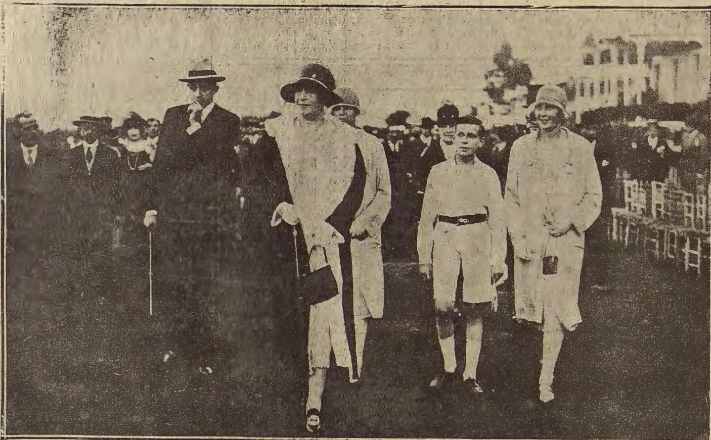
MADRID.— La reina y dos infantes en el Hipódromo de la Castellana