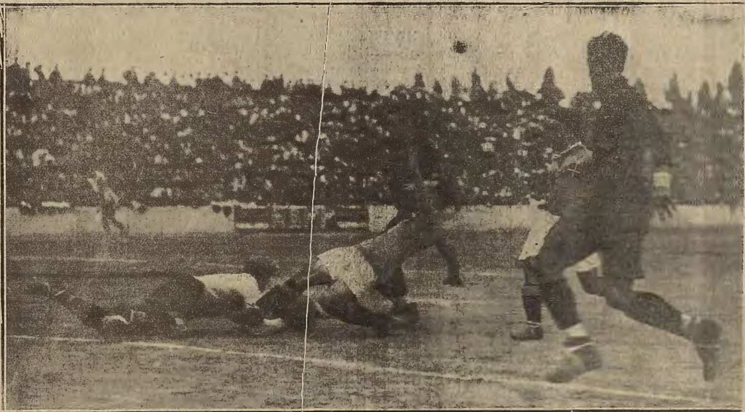
VALENCIA.—Uno de los más interesantes momentos del partido de fútbol Italia-España.

Después de haberlas tenido mucho tiempo en agua caliente y haberlas escaldado y limpiado sin olvidar el pequeño copo de pelo que se oculta en la separación del pie, se quita el hueso mayor y se ponen a cocer por espacio de seis horas, hasta que los huesecillos se desprendan fácilmente. Póngase en una cazuela un trozo de manteca y una cucharada de harina, humedeciéndola con caldo y échense dentro las manos, hechas trozos, juntamente con setas, cebollas pequeñas, perejil, sal, pimienta y nuez moscada; se deja que cueza todo lentamente durante media hora, y cuando vaya a servirse se traba con un batido y un chorrito de vinagre.