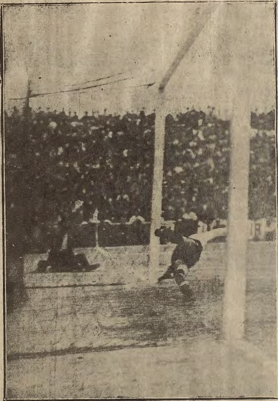
VALENCIA: El partido Italia-España. — El goal del «España»

Si se vuelve a jugar en España, habrá que depilar cuidadosamente esa rueda para que funcione.