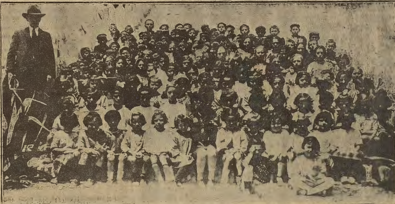
Niñas y niños de la escuela de Villamayor, fotografiados con motivo de la visita a la exposición escolar.

He aquí expuesta a grandes rasgos la formación profesional de los aprendices en la importante compañía ferroviaria francesa.