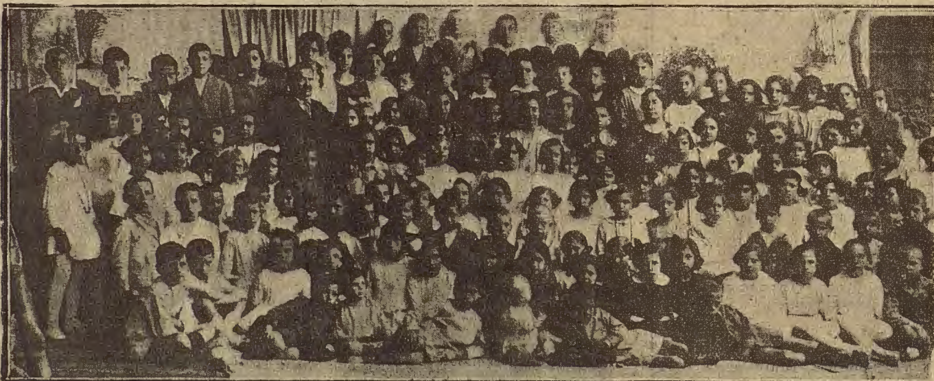
COLEGIO DEL BARRIO DE SANTA ISABEL.—Las niñas y niños en el acto de la visita a la exposición escolar.