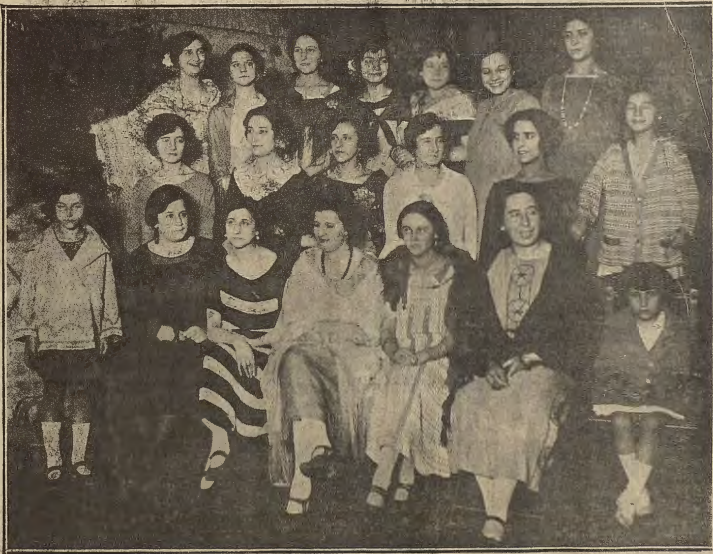
DE LAS FIESTAS DEL BARRIO DE JESUS (ARRABAL).—Verbena celebrada en el jardín de la casa de Sancerni.