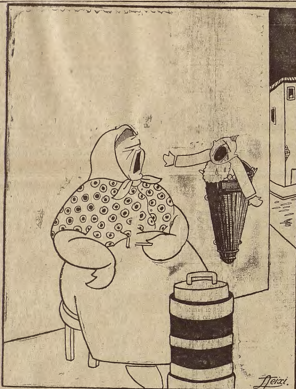
ZARAGOZA Y SUS PROGRESOS.— ¡Demonio de crios; cuanto mejor quiere una hacer las cosas peor se lo pagan!

¡El teatro es, a veces, un veneno de actividad pasmosa!