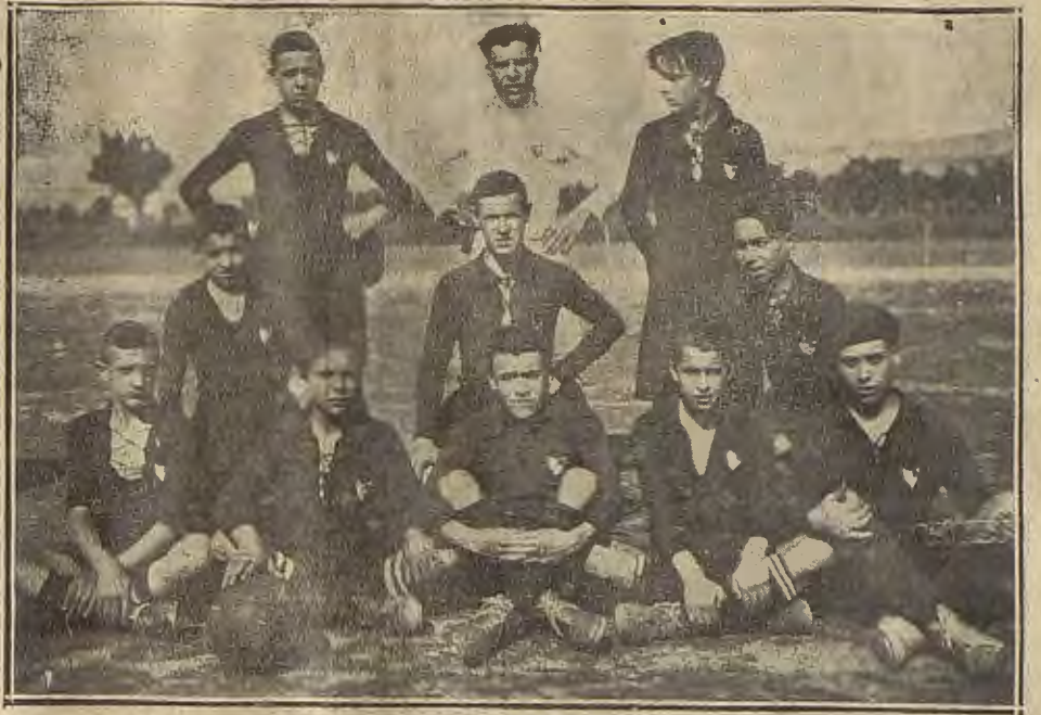
CALATAYUD.—El nuevo equipo de fútbol, Calatayud F. C. formado recientemente que cuenta con valiosos elementos, entre los que sobresale el guardameta.

el campeón belga Washer con el líquido «score» de 7 a 5, 6 a 4 y 6 a 2.