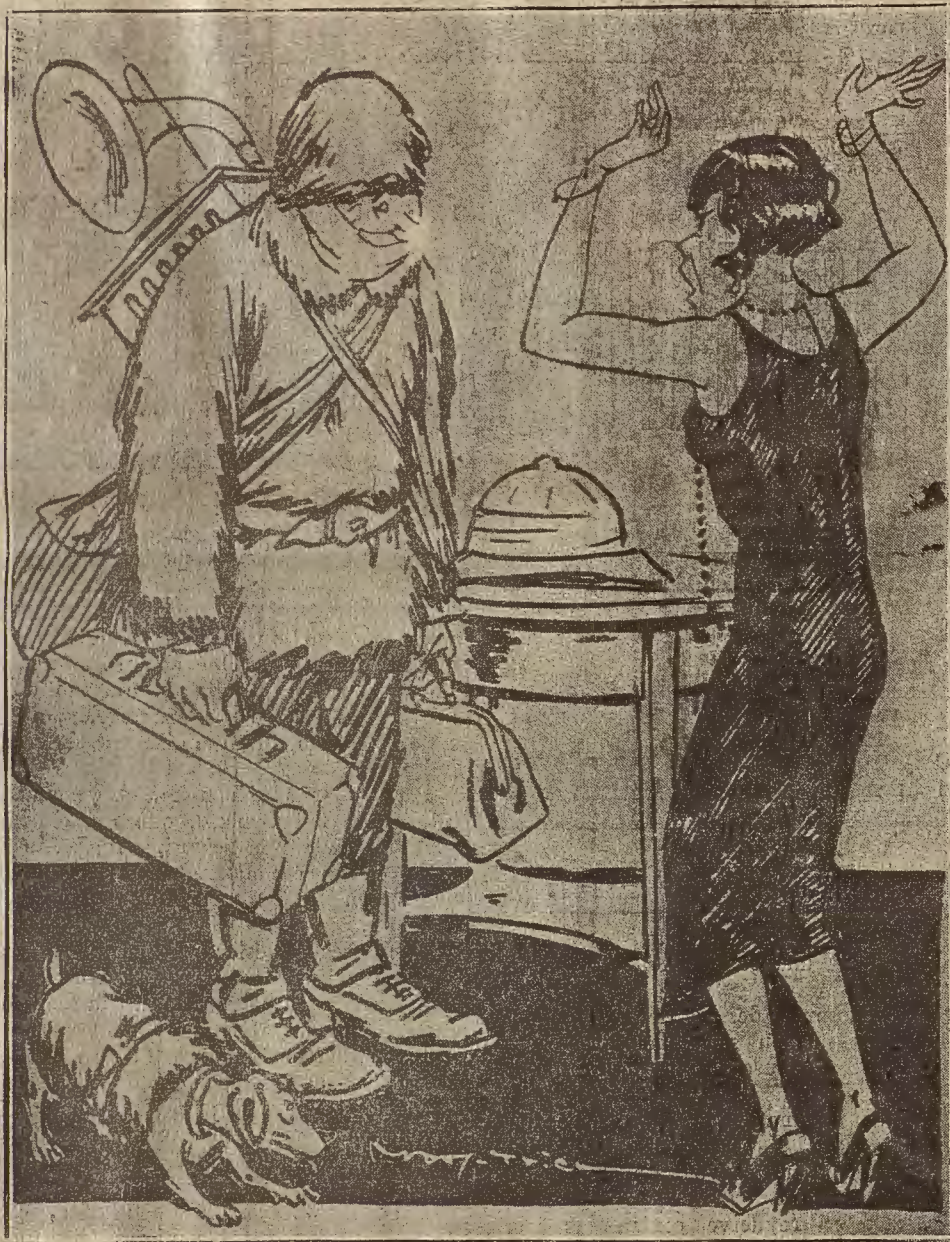
EN SOCORRO DE AMUNDSEN.—¡Cómo! Apenas llegado del Sahara, te vas al Polo Norte... ¡Eso es saltar del atidierre al helado Polo!

Además de las varias que celebramos con Madrid, tenemos conferencias telefónicas diariamente con Barcelona y San Sebastián