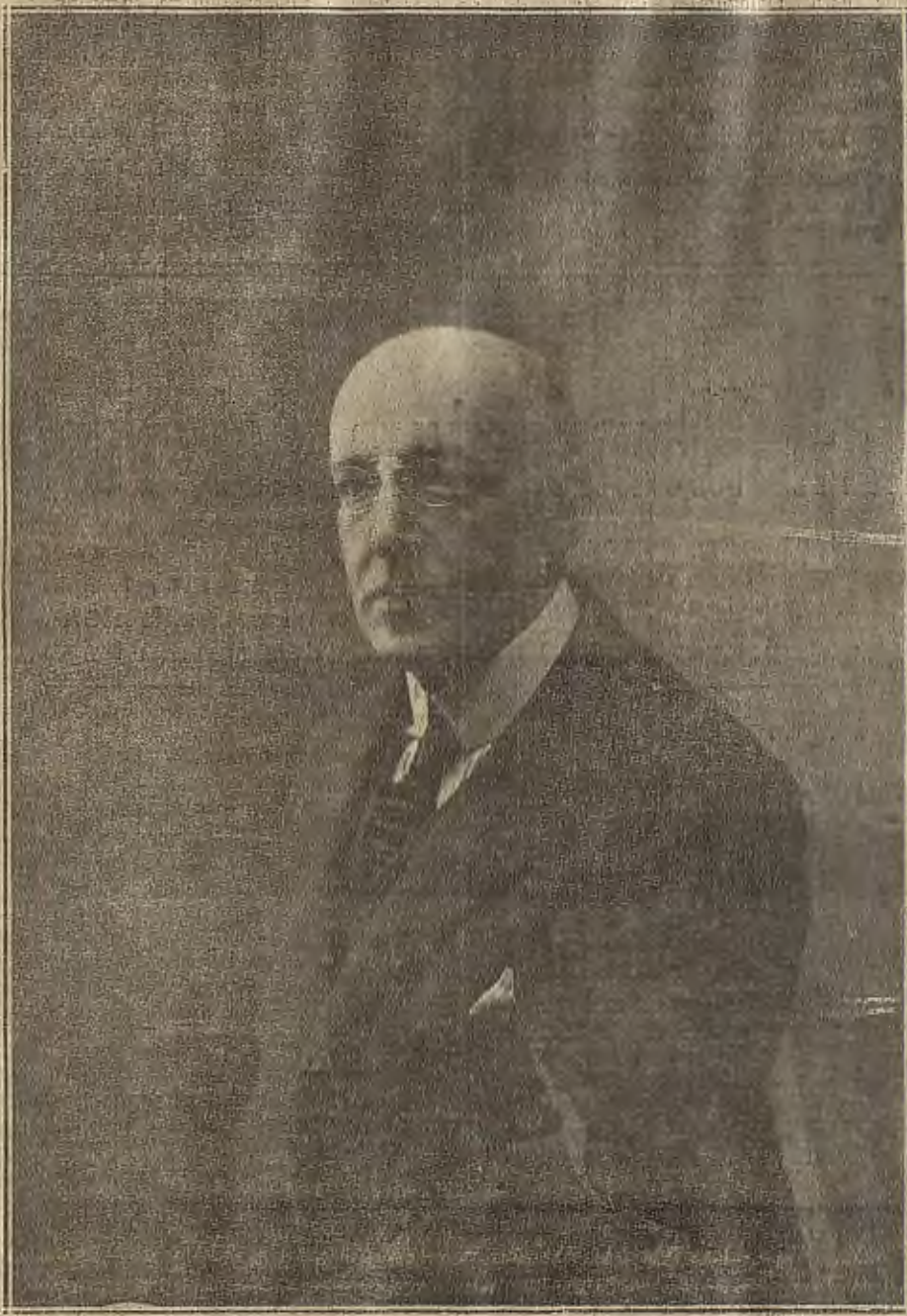
FIGURA DE ACTUALIDAD.—D. Eduardo Gómez de Baquero ( Andrenio ), que ha ingresado en la Real Academia Española.

Los alcaldes de Alfamén y Uncastillo han remitido matrícula industrial. —Los alcaldes de Castejón y de Valdecasa remitieron el repartimiento de ruinas edificios y solares, apertura de anillamiento y recuento de ganadería.