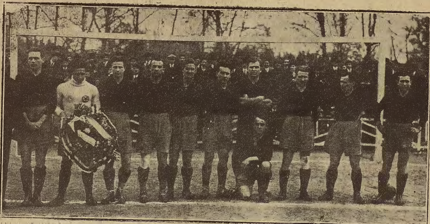
DEL PARTIDO DE FUTBOL DEL DOMINGO.—EL EQUIPO SPARTA, DE PRAGA, QUE VENCIO AL REAL ZARAGOZA C. D., POR SEIS A UNO (Foto. A. de la Barrera).

En el segundo tiempo, por ausencia de Lage, pasó Lozano a su puesto en la defensa, quien por cierto, en una salida temeraria de Vilarrodona, evitó un gol seguro.