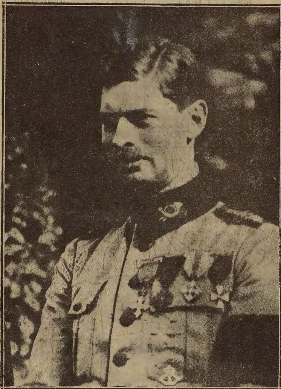
FIGURA DE ACTUALIDAD.—EL PRINCIPE CAROL DE RUMANIA, QUE HA RENUNCIADO A LOS DERECHOS AL TRONO DE SU PAIS, DEL CUAL ERA PRINCIPE HEREDERO

El soldado quedó hospitalizado en aquel establecimiento benéfico.