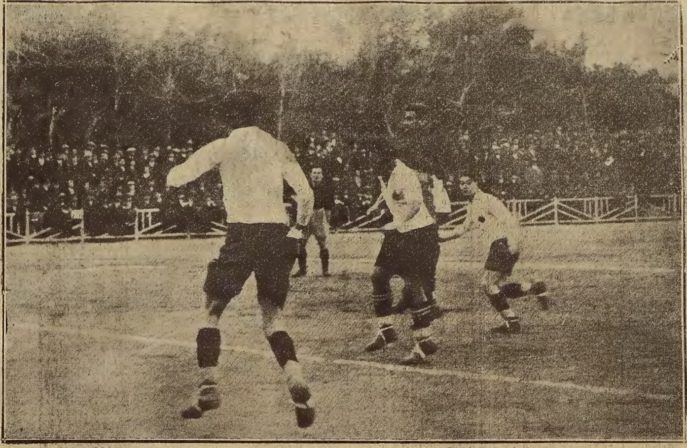
DEL PARTIDO DE FUTBOL DEL DOMINGO. — UNA «MELEE» EN LA PORTERIA DEL REAL ZARAGOZA C. D.

Con estos antecedentes, no es aventurado