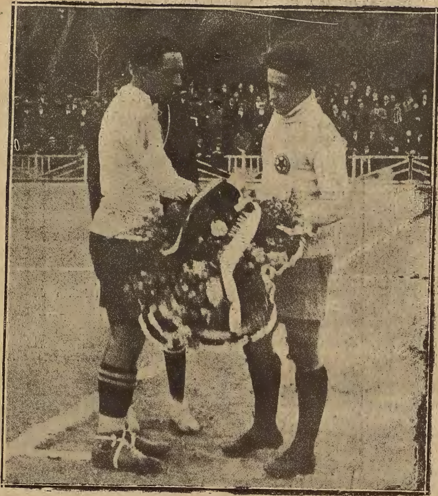
DEL PARTIDO DE FUTBOL DE ANTEAYER.—LOS CAPITANES DEL SPARTA, DE PRAGA, Y DEL REAL ZARAGOZA C. D., CAMBIANDO LOS RAMOS ANTES DE COMENZAR EL PARTIDO