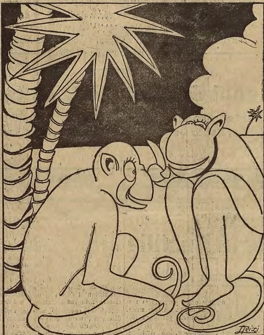
—Es imposible que prospere nuestra raza con el inca cuíable número de "mon-s" que en estos días se han cogido!

fotográficos de F. R. Xerbury, secretario de «The Architectural Association». Imposible hallar corte más hábil, producción de luces y sombras más exquisita. La fotografía del patio principal del palacio sevillano de Almirante, por ejemplo, es muy hermosa. El rincón toledano de la «Casa del Obispo», de que nos han enseñado pruebas para otro número, consigue un detalle, tiene una plenitud luminosa, que dan la sensación no sólo del sitio sino del momento.