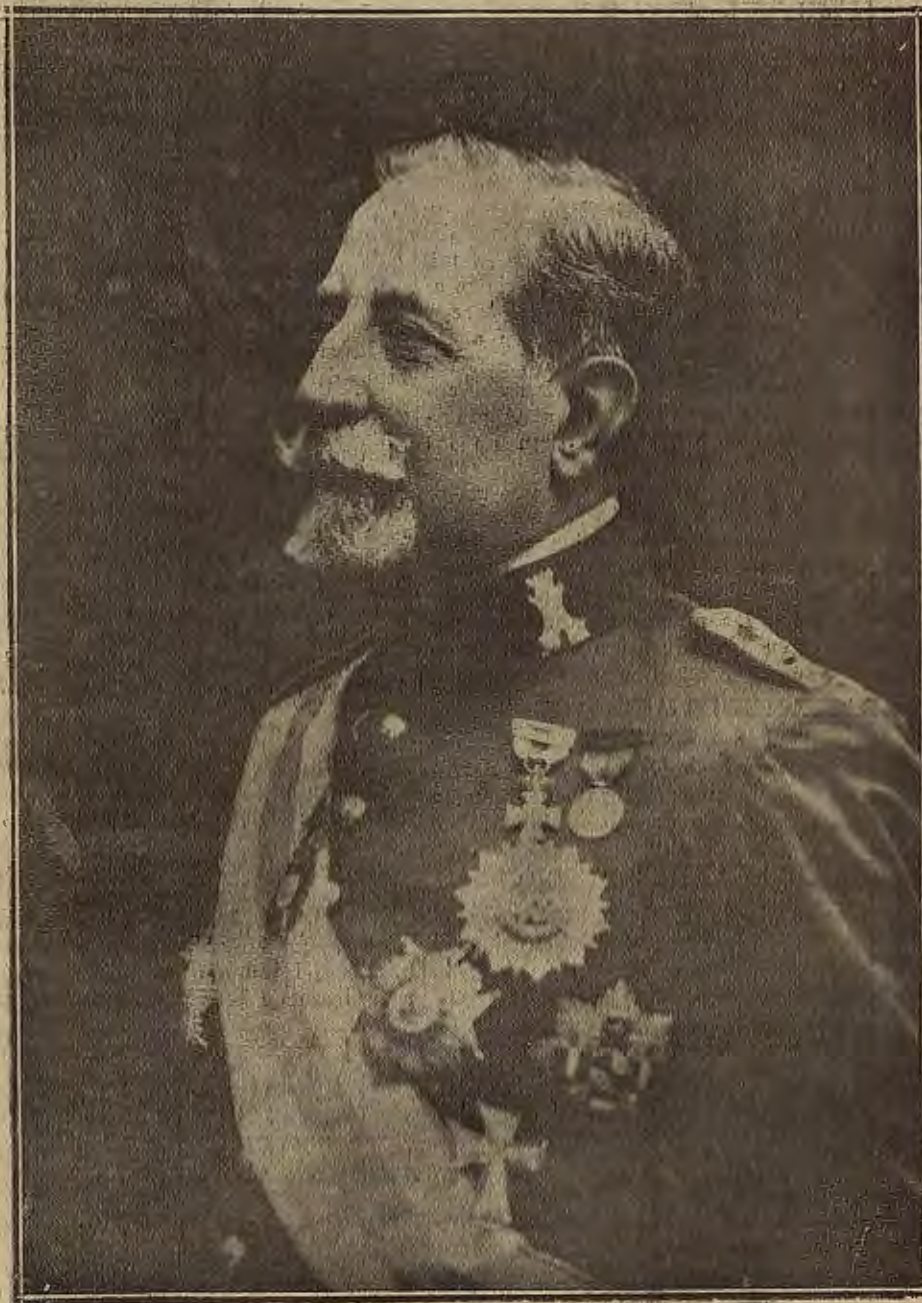
FIGURA DE ACTUALIDAD

Bien vivimos ahora sin esas perniciosas preocupaciones. Hombres de