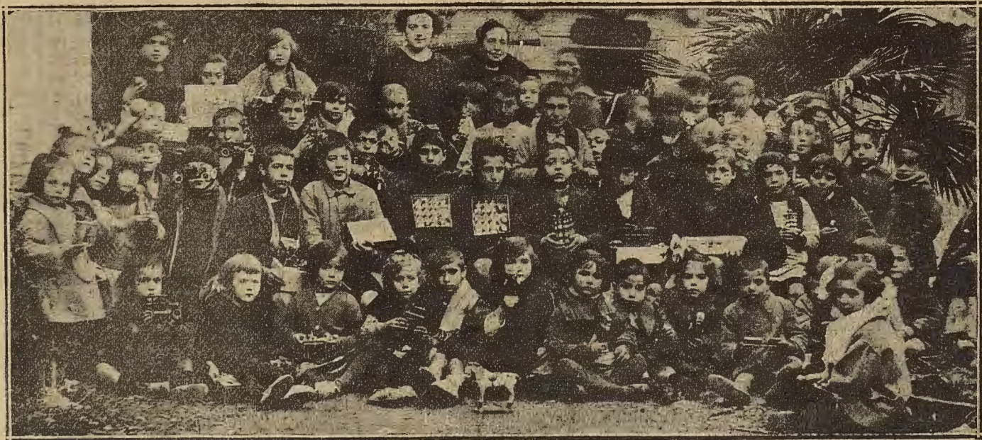
NINAS Y NINOS DE LA ESCUELA DE SAN AGUSTIN, A QUIENES FUERON REPARTIDOS AYER JUGUETES CON MOTIVO DE LA FESTIVIDAD DEL DIA