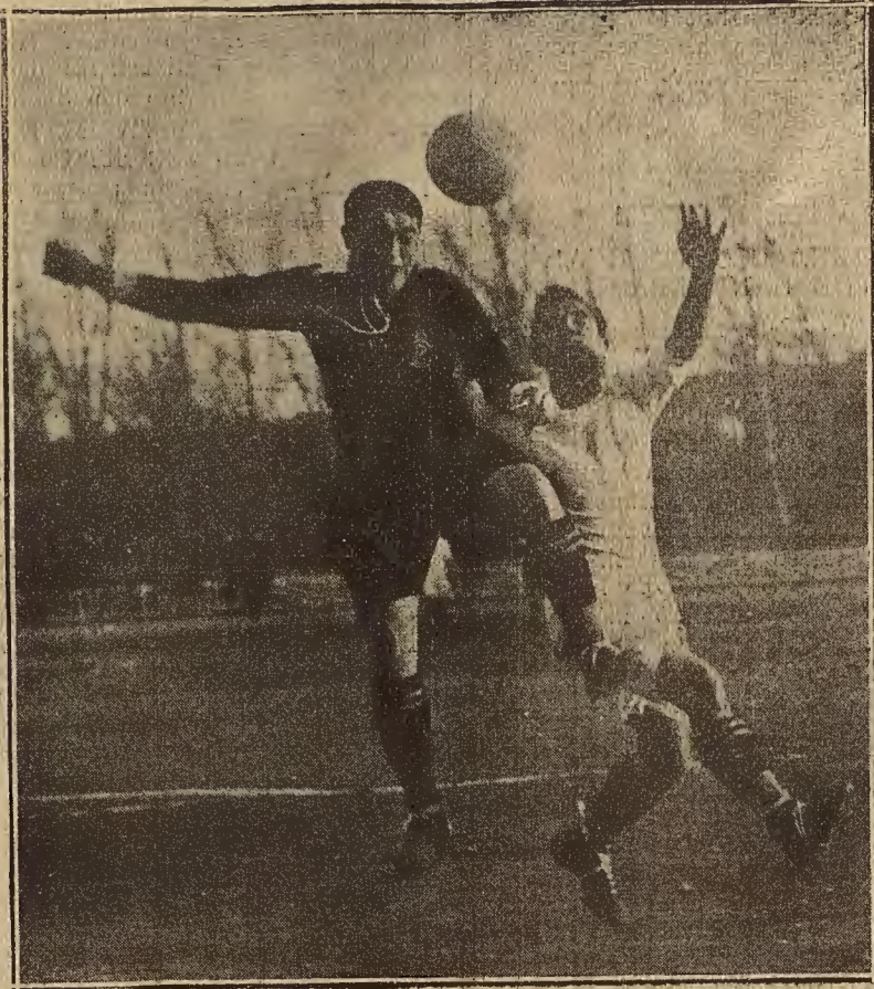
DEL PARTIDO DE FUTBOL JUGADO AYER ENTRE EL INFANTIL DEL EUROPA Y EL INFANTIL DEL ZARAGOZA.—UNA JUGADA INTERESANTE (Foto. A. de la Barrera).