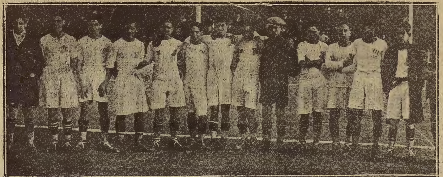
EQUIPO INFANTIL DEL EUROPA, QUE VENCIO AYER AL INFANTIL DE ZARAGOZA, POR 2 A 1.

Hielados, Bocadillos, Licores, Chocolates, Repostería, Mariscos