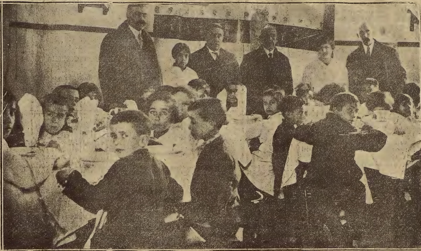
EN EL GRUPO ESCOLAR «GASCON Y MARIN.—NINAS Y NINOS OBSEQUIADOS AYER CON UNA COMIDA EXTRAORDINARIA ANTES DEL REPARTO DE JUGUETES

Y nosotros, mejor que los franceses, podemos recordar la famosa frase de Balzac: «Los grandes recursos del Estado son hipotecas sobre los vicios de la nación».