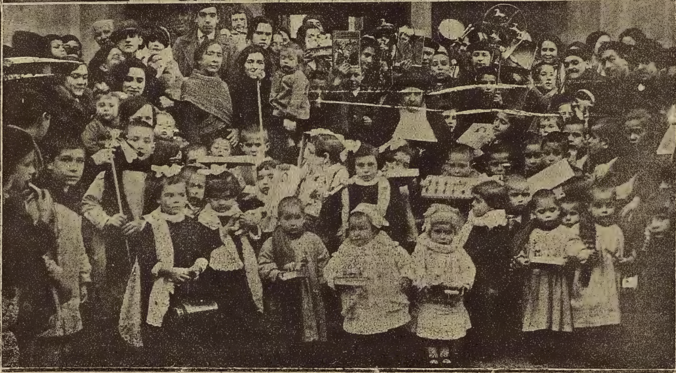
LA FIESTA DE LOS REYES EN EL HOSPICIO PROVINCIAL.—ARRIBA, LA CABALGATA DE LOS REYES MAGOS. ABAJO, LOS NIÑOS Y NIÑAS DESPUES DEL REPARTO DE JUGUETES.