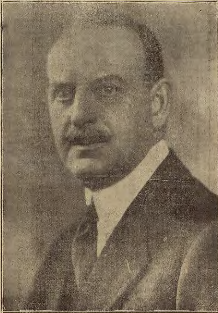
Mr. ODGEN H. HAMMOND, QUE HA SIDO NOMBRADO EMBAJADOR DE LOS ESTADOS UNIDOS EN ESPAÑA, EN SUSTITUCION DE Mr. MOORE (Foto Vidal). (Fotografiado LA VOZ DE ARAGON)

Quienquiera que haya leído las anteriores líneas creerá que quedó solucionado el pavoroso problema de la Litera con la construcción de su tan suspirado Canal, y más aún si al cruzar sus extensas llanuras con el raudal caminar del tren de viajeros o del automóvil deportista, ve alguna incipiente huerta que, como cinturón de esmeraldas, ciñe los estrechos contornos de nuestras viejas villas.