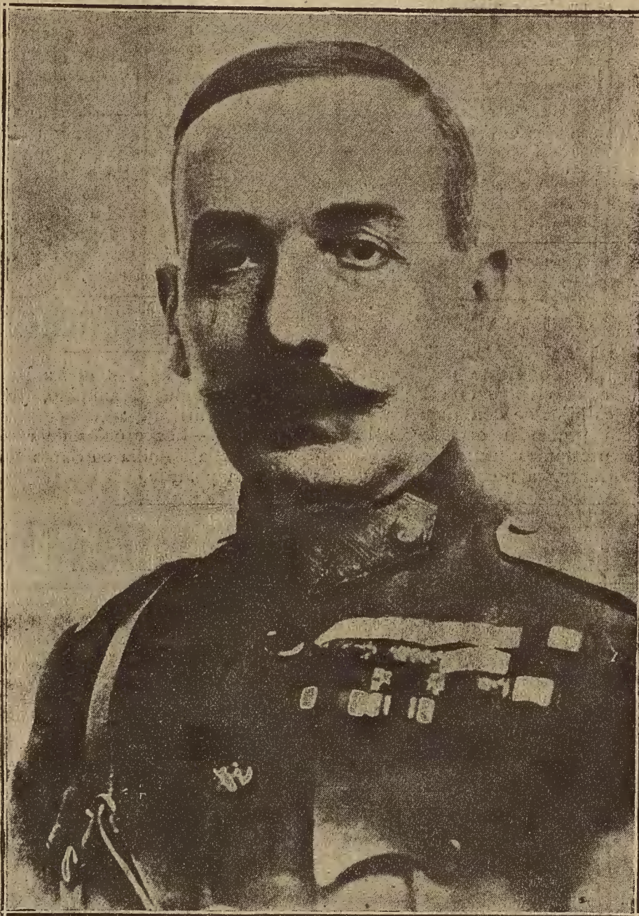
FIGURA DE ACTUALIDAD.—EL GENERAL PANGALOS, QUE SE HA ERIGIDO DICTADOR EN GRECIA