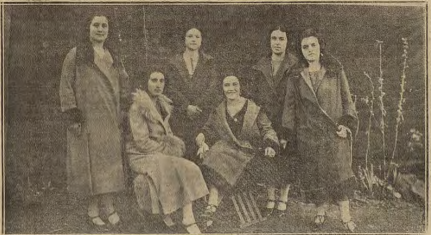
DE JARQUE. SENORITAS DE LA LOCALIDAD QUE POSTULARON PARA CONTRIBUIR AL AGUINALDO DE LOS SANTOS. DADO

Hielados, Becadillos, Liceres, Chocolates, Repostería, Marisco