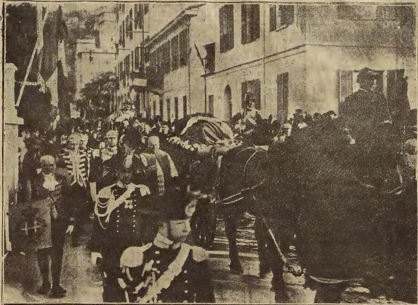
BORDIGHERA (ITALIA).—TRASLADO DE LOS RESTOS DE LA REINA MARGARITA DESDE EL PALACIO REAL A LA ESTACION PARA SER CONDUCIDOS A ROMA