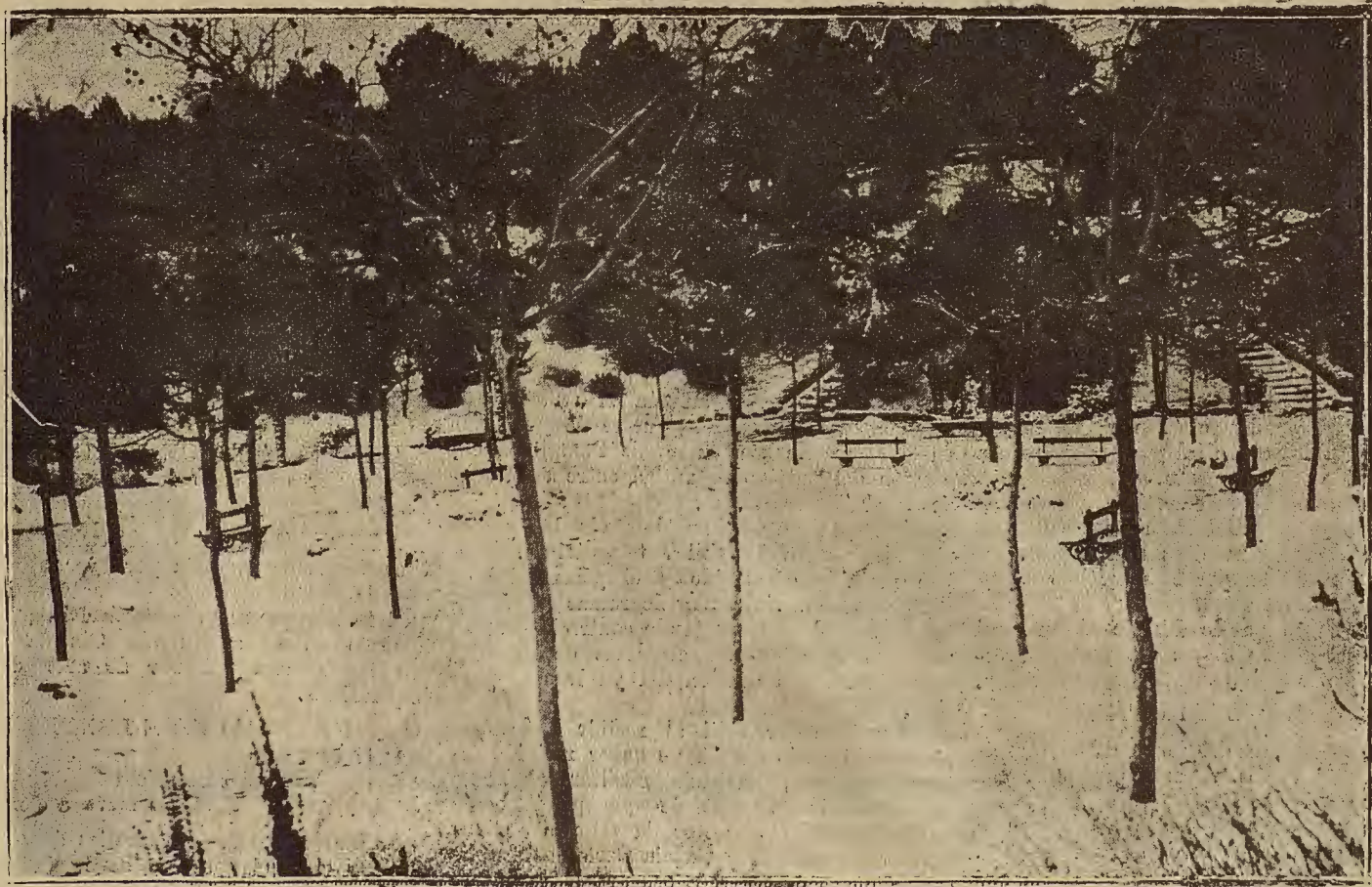
LA HONORADA DEL CABEZO DE BUENA VISTA, DESPUES DE LA NEVADA DE AYER