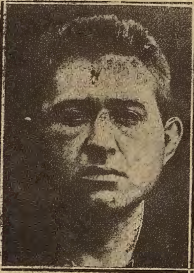
BENITO CASTRO, ANARQUISTA GUI- LLOTINADO EN BURDEOS

En mis escritos anteriores dejé consignado que el río Esera es insuficiente para alimentar el Canal de Aragón y Cataluña, y al sustentar esta tesis es claro y evidente que me refiero al caudal o corriente ordinaria de dicho río, única que en la actualidad se puede utilizar, puesto que la gran masa de agua procedente de las grandes avenidas necesariamente se ha de perder mientras no