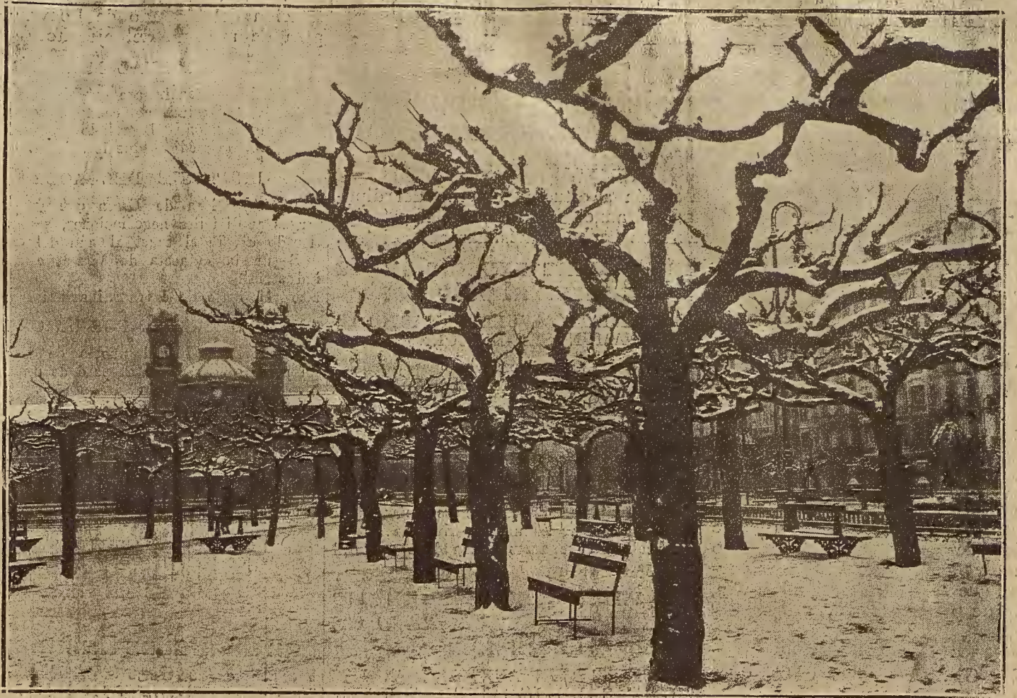
EL TEMPORAL DE NIEVES EN SAN SEBASTIAN.—ASPECTO QUE OFRECIAN EL PASEO Y ALREDEDORES DE LA CONH A DURANTE LA RECIENTE NEVADA

60 metros de altura desde el envase de ci- mientos, el espesor de su base será de 49 metros lineales, el volumen total de esta obra es de 43.000 metros cúbicos, y su costo, en la actualidad, se puede calcular aproximadamente, en siete y medio millones de pesetas. El importe de la expropiación forzosa de los terrenos que han de inundar las aguas del pantano, ascenderá a un mil- lón y medio de pesetas.