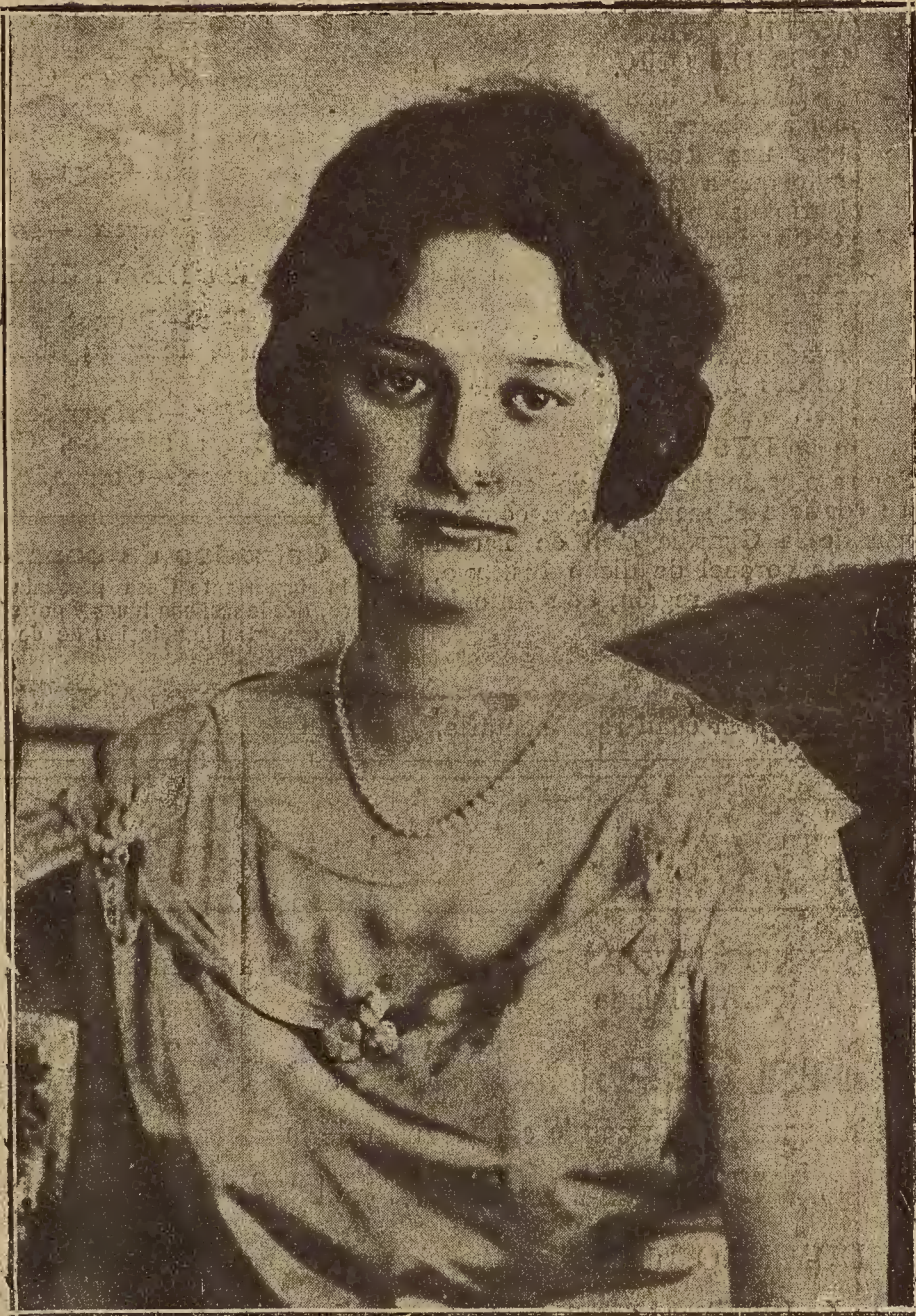
FIGURA DE ACTUALIDAD.—LA PRINCESA ASTRID DE SUECIA, CUYO VIAJE A LONDRES, HA DADO LUGAR A QUE SE HABLE DE SU MATRIMONIO CON EL PRINCIPE DE GALES

Los abajo firmantes, alumnos de las Facultades de Derecho, Medicina, Filosofía y