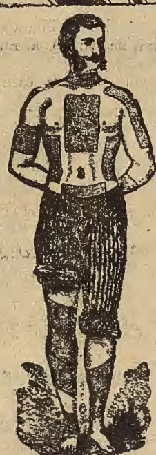
MARCA REGISTRADA EXIGIDA EN LA CUBIERTA DE CADA EEMPLASTO