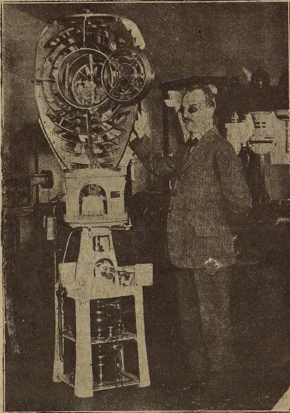
FIGURA DE ACTUALIDAD

El profesor Gustavo Dalén, de Estocolmo, a quien han hecho célebre sus inventos, por los cuales acaba de recibir el premio Nobel. Hace algunos años se quedó ciego en consecuencia de unos experimentos con aparatos de alumbrado, de su invención. A él se deben los aparatos perfeccionados que alumbran las calles de Estocolmo, así como las señales luminosas que se emplean en Londres.