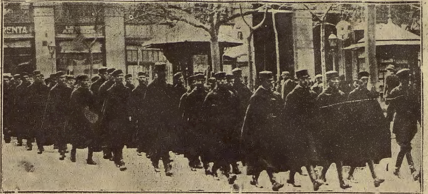
REPATRIACION DE TROPAS.—LOS ARTILLEROS DEL 9.º LIGERO, QUE LLEGARON ANTEAYER A ZARAGOZA, AL ENTRAR EN EL TEMPLO DEL PILAR EN LA MAÑANA DE AYER.