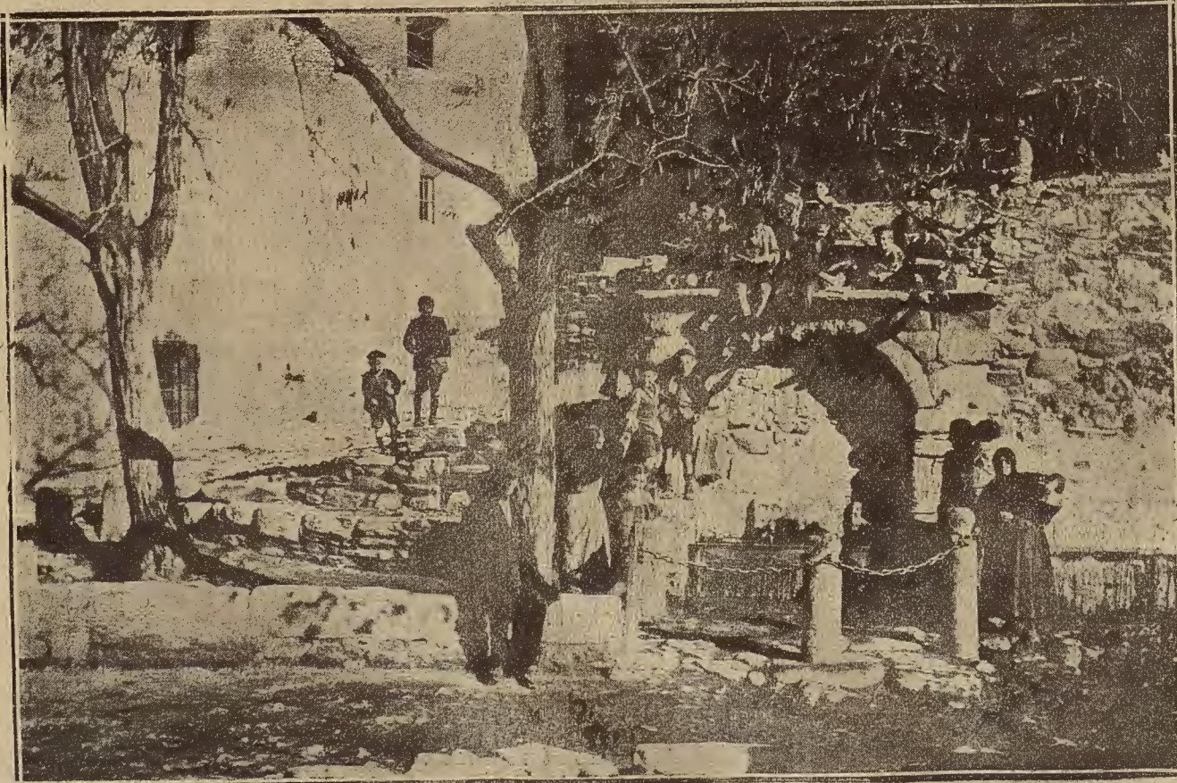
ARAGON PINTORESCO.—PUENTE PUBLICA, DE ORIGEN ARABE, EN LA PLAZA DE EL FRASNO

Por indisposición del señor Decano del Colegio, se suspende hasta nueva convocatoria, la junta general anunciada para el día 31 del corriente.