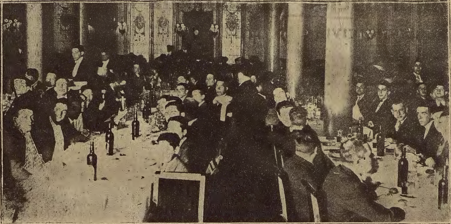
EN EL CENTRO MERCANTIL.—UN ASPECTO DEL BANQUETE CELEBRADO ANOCHE EN HONOR DEL EQUIPO DEL IBERIA S. C., QUE GANO EL PARTIDO QUE DECIDIO A SU FAVOR EL CAMPEONATO REGIONAL DE FUTBOL.