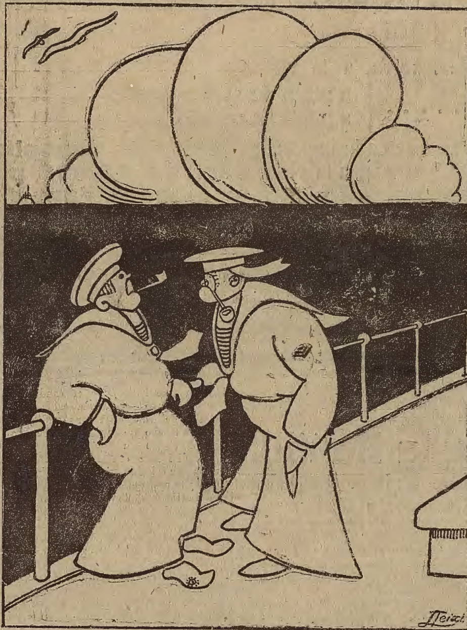
SIGUIENDO EL «RAID»